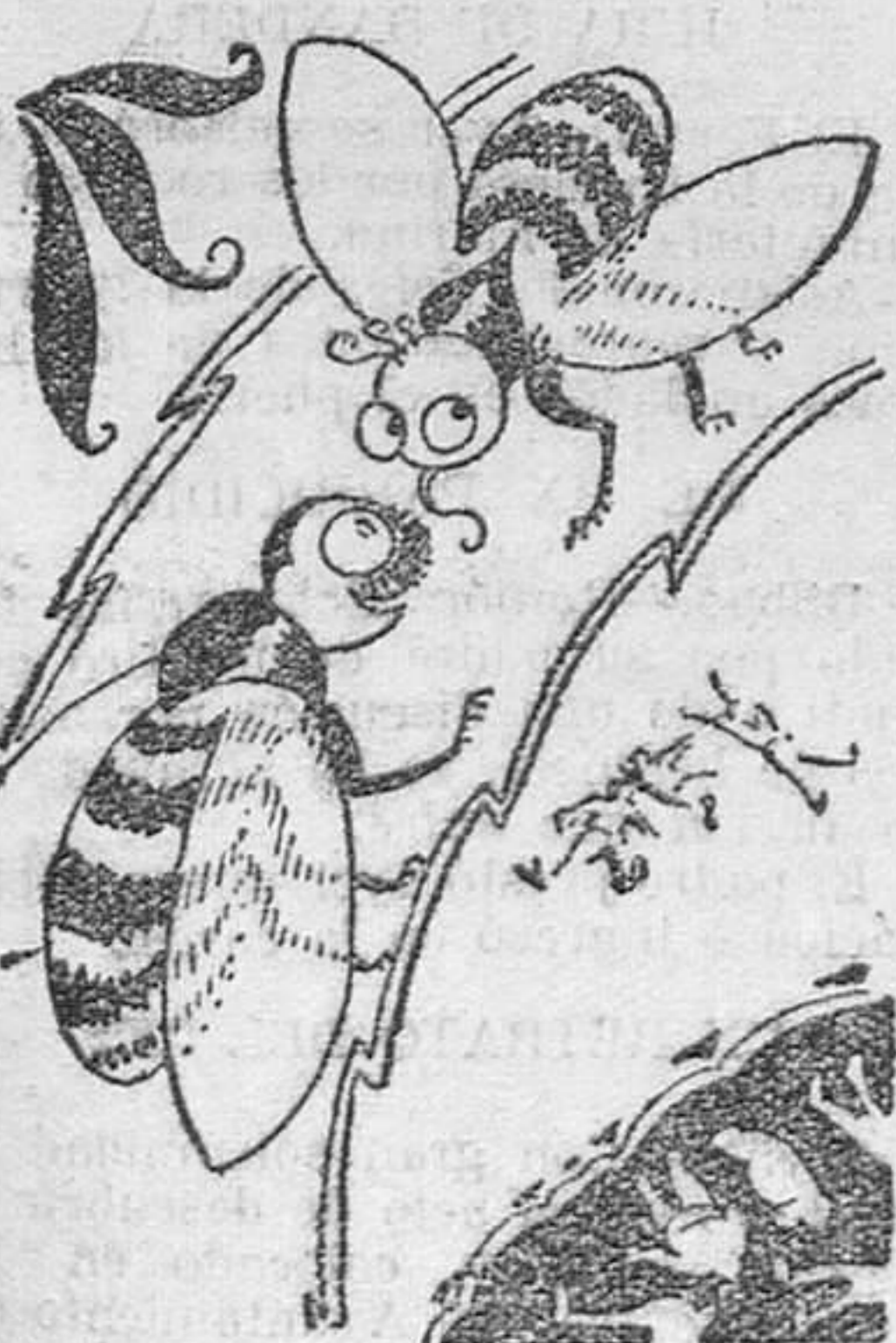
Es que se tienden a descansar en medio de las selvas. Parece ser que pica con más furia a los que se...