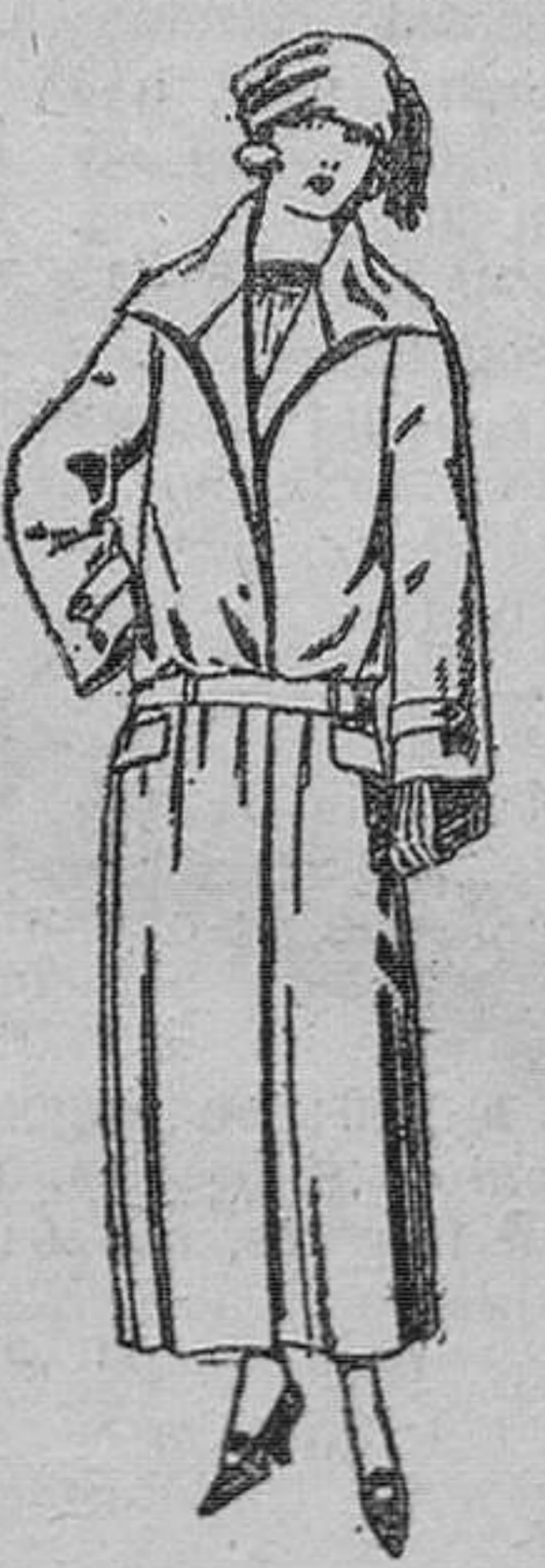
Abrigos de gabardina inglesa, impermeabilizada, en negro, azul y color. De ptas. 70 a 165.