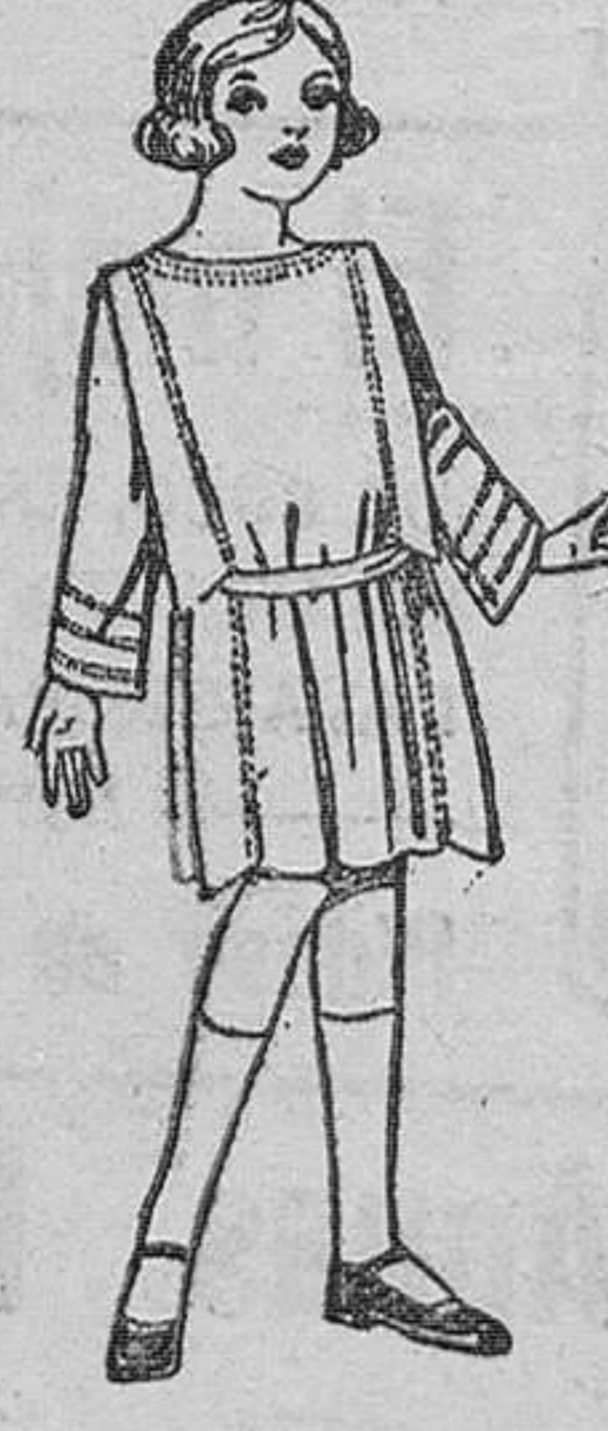
Vestidos de sarga inglesa, popeline, etc., en azul y color, adornos pespunte seda, para niñas de 4 a 9 años. De ptas. 35 a 42.