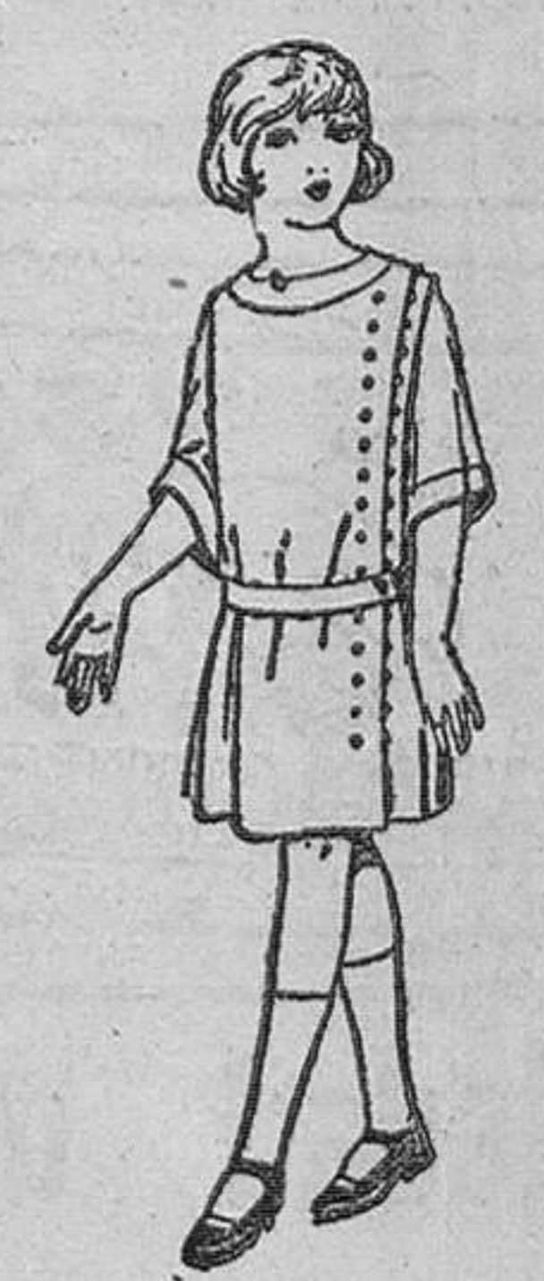
Vestidos de crepé de lana, estambre, etc., en azul y color, para niñas de 4 a 9 años. De ptas. 30 a 40.