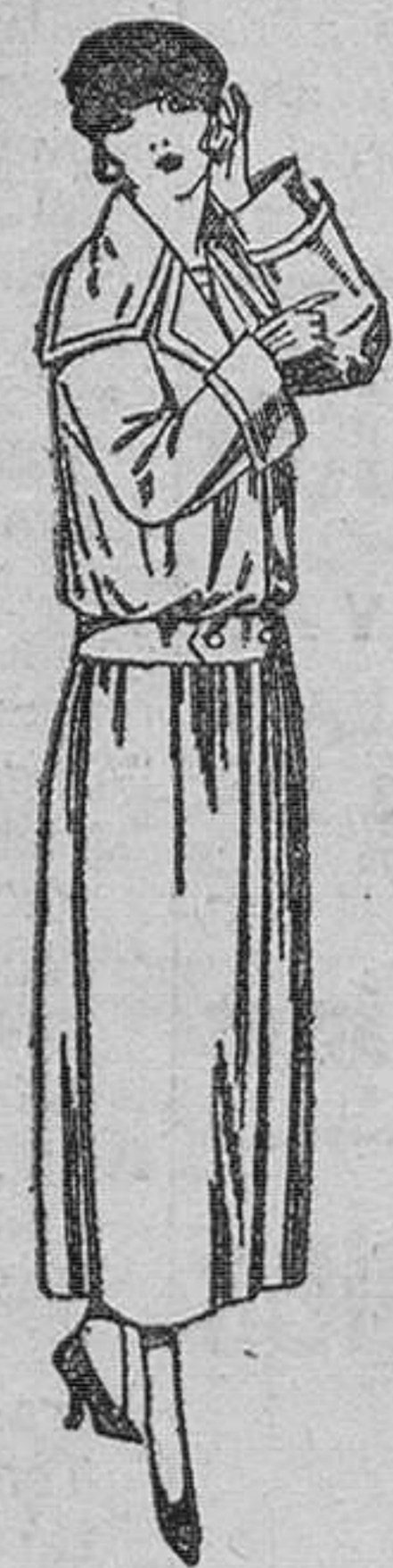
Guardapolvos de dril, crudo, gris, etc. De ptas. 25 a 40.