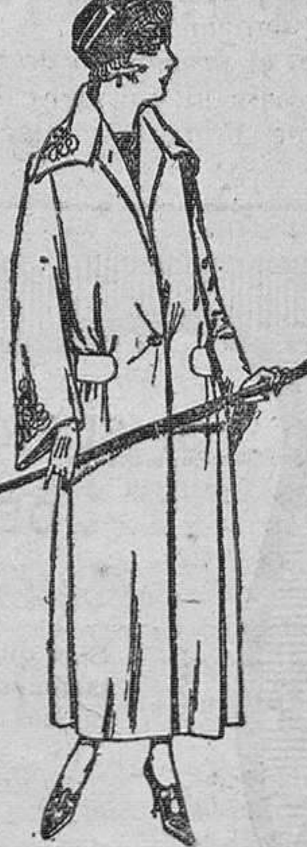
Abrigos de gamuza, ratina, etc., en negro, azul y color, adornos bordados. De ptas. 85 a 110.

Ropas confeccionadas para caballero, señora, niño y niña