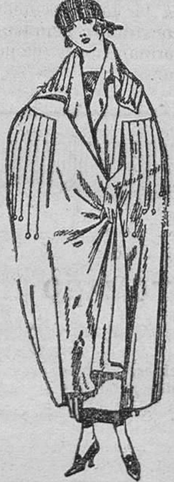
Capas de gabardina, pañete, etc., diferentes colores. De ptas. 85 a 125.