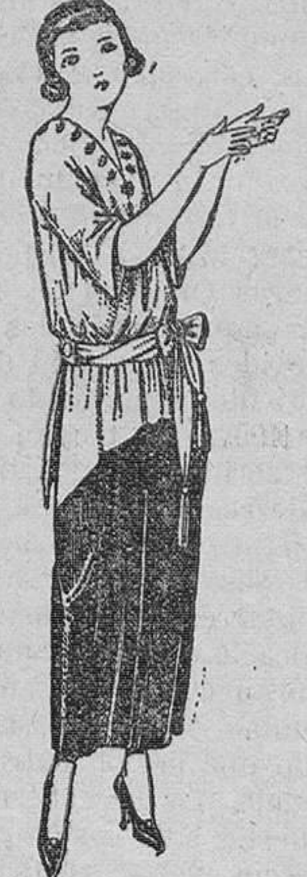
Paletots de punto de seda, adornos bordados. De ptas. 47 a 120