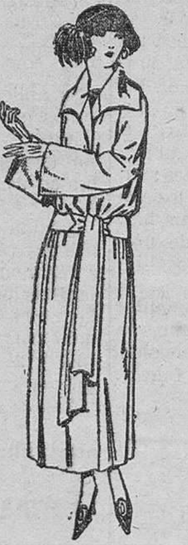
Abrigos de cheviot, gabardina, ratina, etc., en negro, azul y color. De ptas. 50 a 75.