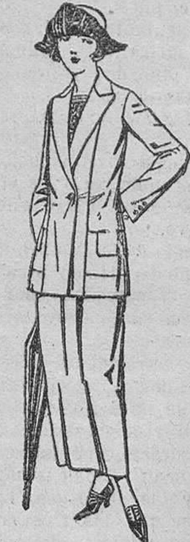
Trajes sastrer, de sarga inglesa, satén, estambre, etc., chaqueta forrada de seda, en negro, marino y colores moda. De ptas. 115 a 150.