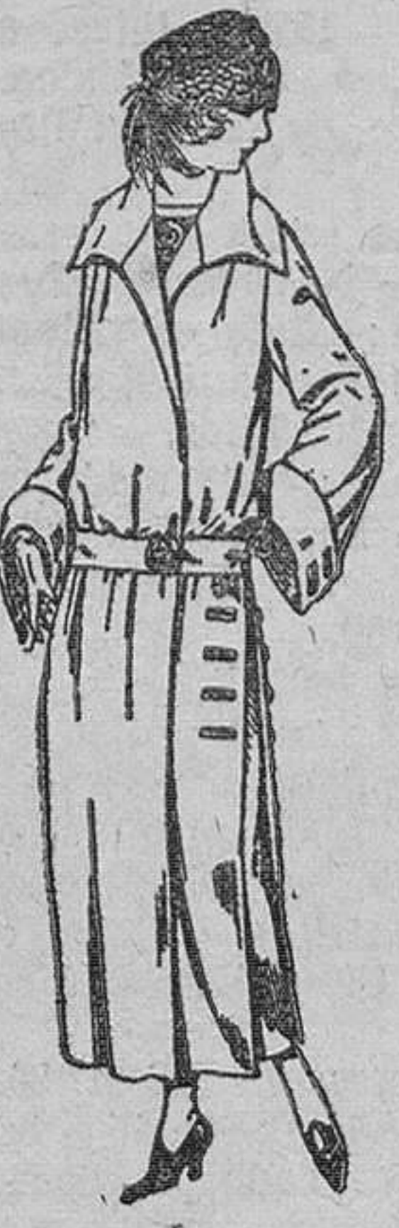
Abrigos de gamuza, gabardina, etc., en negro, azul y color. De ptas. 70 a 100.