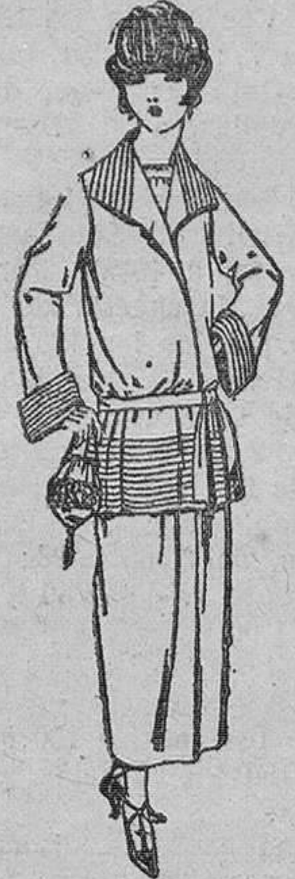
Trajes sastrer, de sarga inglesa, cheviot, etc., adorno, pliegues, chaqueta forrada de seda, en negro, azul y color. De ptas. 150 a 165.

SUCURSALES: Madrid, Barcelona, Alicante, Almería, Bilbao, Cádiz, Cartagena, Gijón, Granada, Málaga, Palma de Mallorca, Santander, Sevilla, Valladolid y Zaragoza