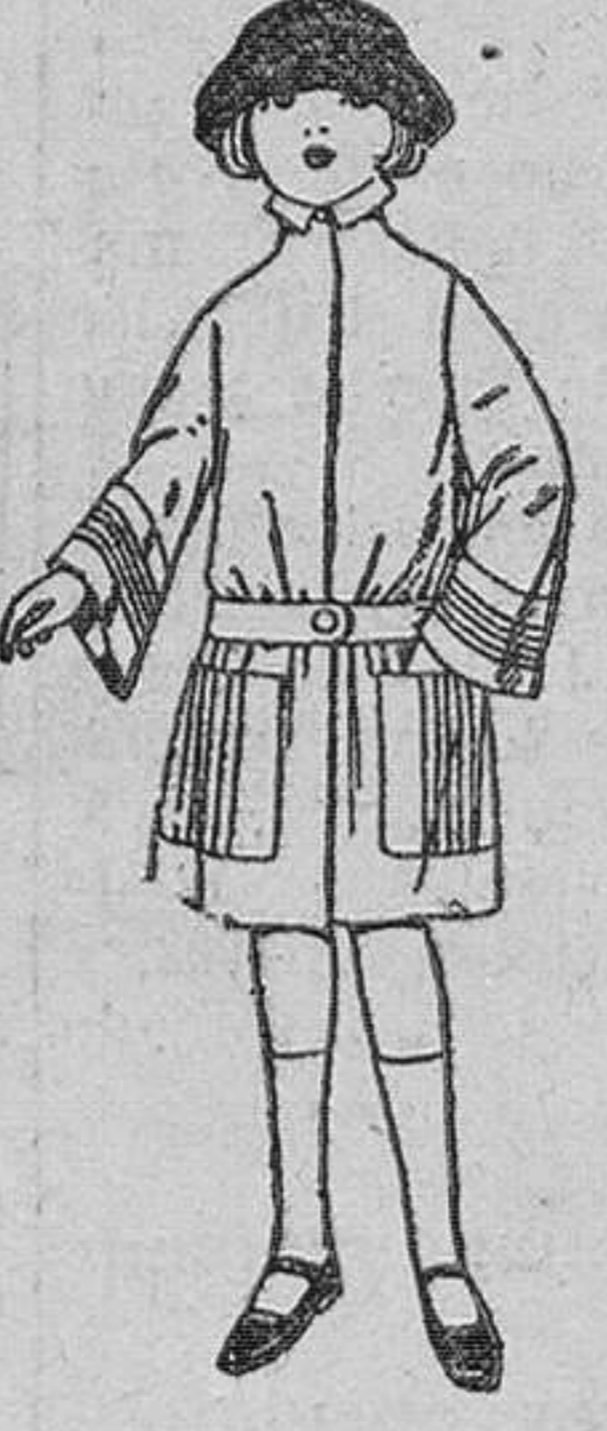
Abrigos de terciopelo, de lana, gabardina, etc., en azul y color, para niñas de 4 a 12 años. De ptas. 30 a 40.