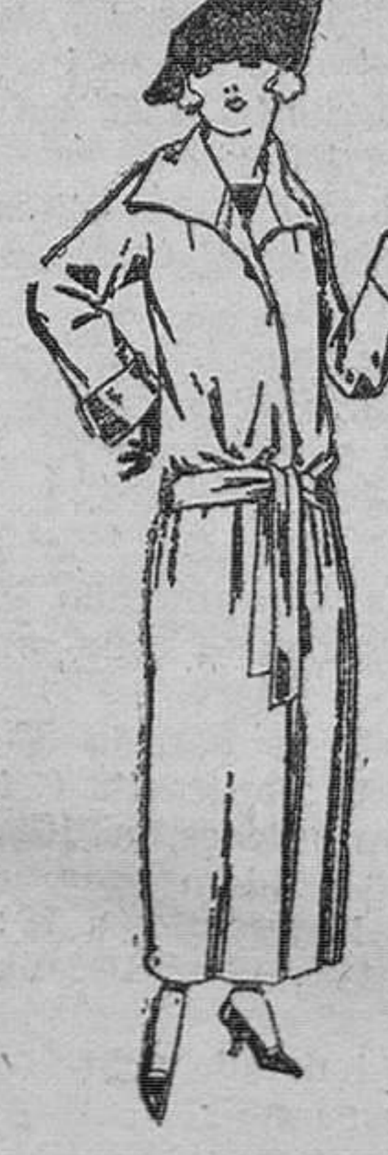
Guardapolvos de dril, satén, etc., colores moda. De ptas. 29 a 56.