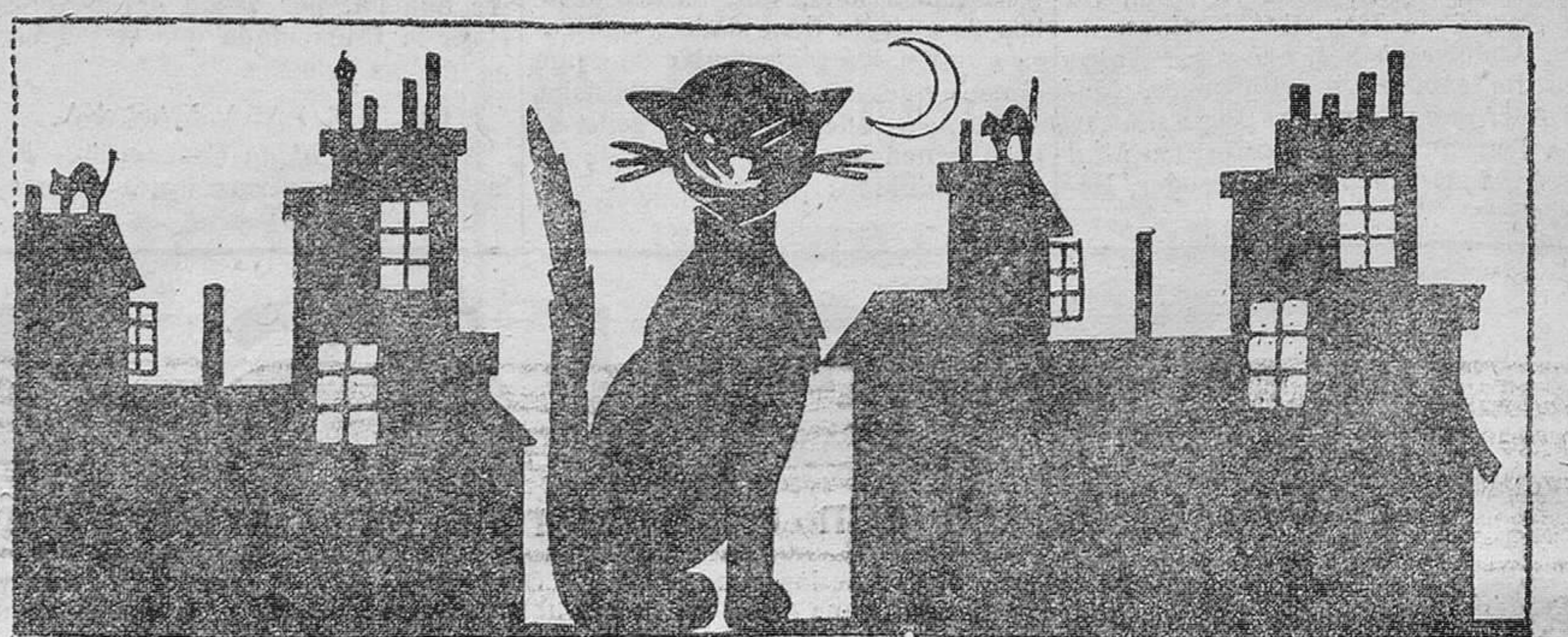
«Nocturno», capricho humorístico, recortable, para «abat-jour», o para los delantallitos de Baby...