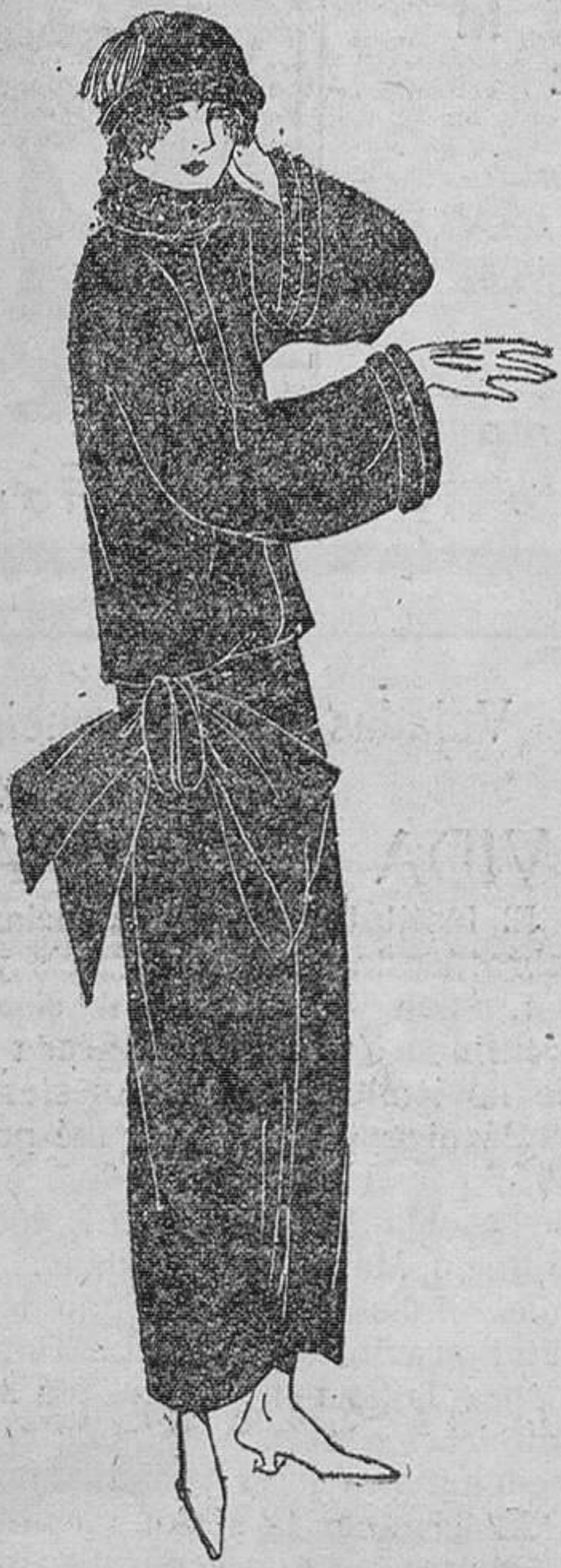
Traje de terciopelo negro adornado de rizados de cinta de moaré negra en el cuello y borde de las mangas. Cinturón de terciopelo negro cerrado por una gran lazada.