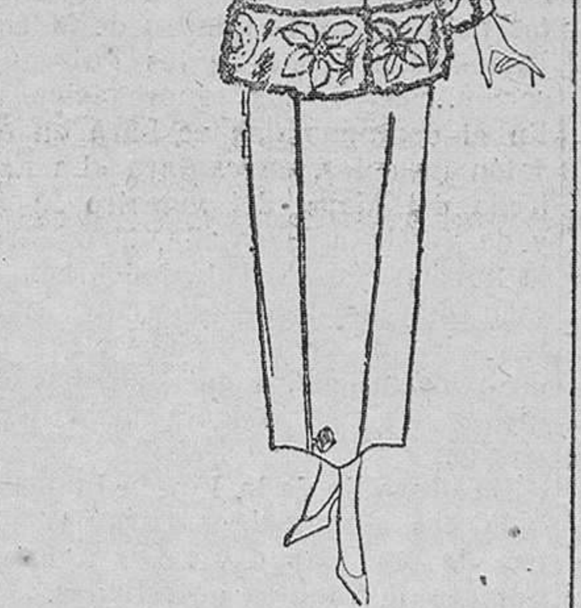
Traje sastré en «foullaine». Gris topo, adornado de topo bordado