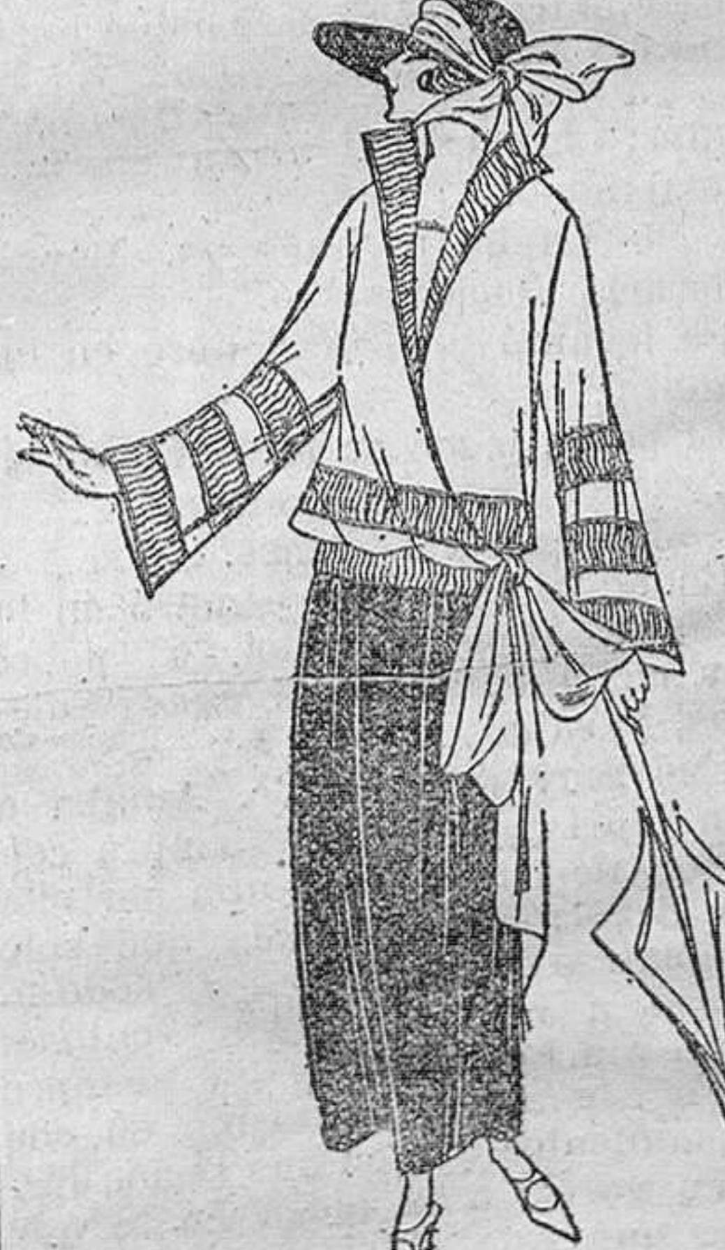
Sobre una falda de crespón marrón negro, lucirá mucho, y bien, un blusoncito de crespón tabaco claro, ornado de bandas abullonadas

Se conoce que sabe usted mucha ortografía, por la serie de fallas que para disimularlo pone en la suya. Es inútil la superchería. Usted podría servir de maestra a muchos señores con título académico. Pues así como adullera a sabiendas la ortografía, creo que exagera usted sus prevenciones contra su joven cortejo. Termina la carta sin acordarse del rasgo de sinceridad que ha tenido al principio. ¿Qué significa aquel: le soy franca, le quiero , entre las demás vacilaciones? Como soy de los que sostienen que todas las ventajas están de parte de quien se deja querer, y todos los inconvenientes de la del que quiere, excuso decirle cuál será mi consejo. Mientras sea un hombre joven, honrado, laborioso y enamorado, quíerale, aunque sea un poquitín, que el tiempo y él se encargaran de robustecer las raíces de su cariño.