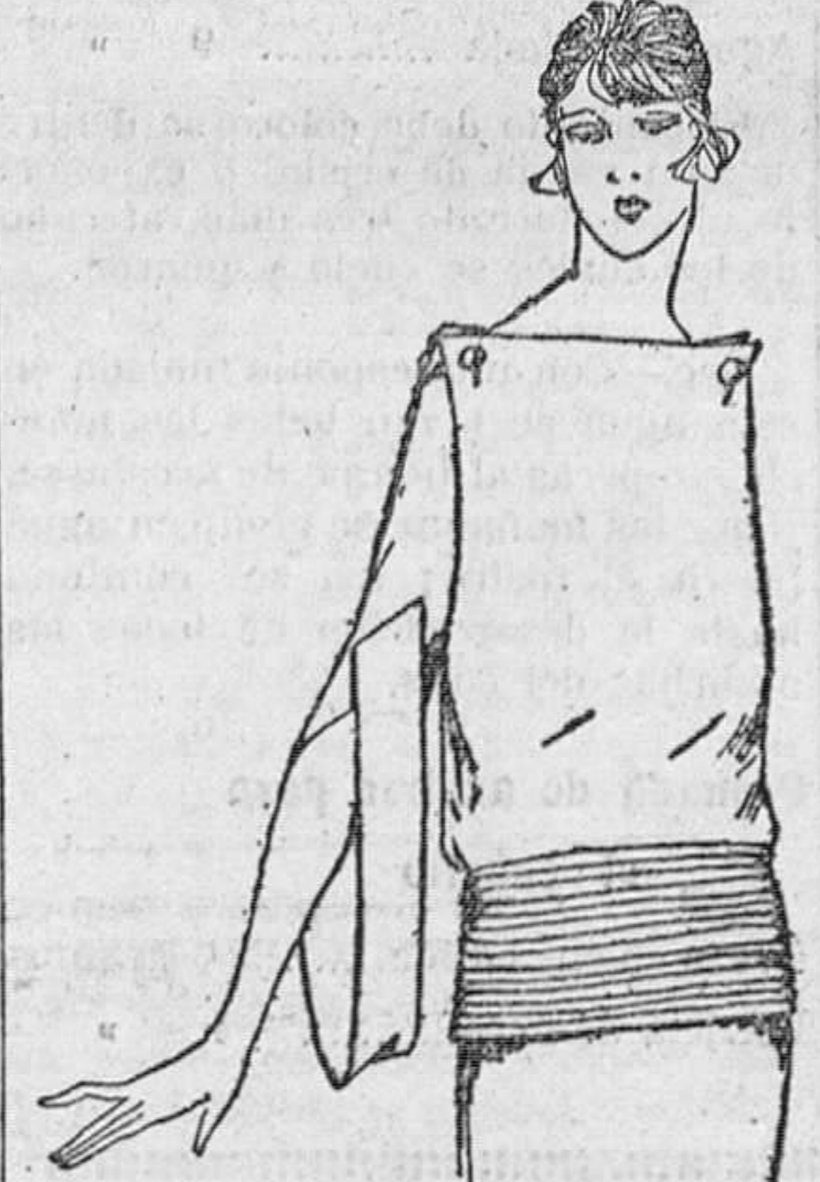
Blusa, de corte original en crespón Georgette, terminada a la altura de las caderas por una serie de pespuntos o bordado de cadeneta en seda de color vivo

Que por cierto no lo es. Breve será mi contestación, por la índole del asunto. Y como no la concepto como el pseudónimo indica, creo que con que nos entendamos el que pregunta y el que responde, basta. Además, debo ser algo conceptualoso en la exposición de mi parecer, por razones que se le alcanzarán. Si no me entiende, ¡lo sentiré mu-