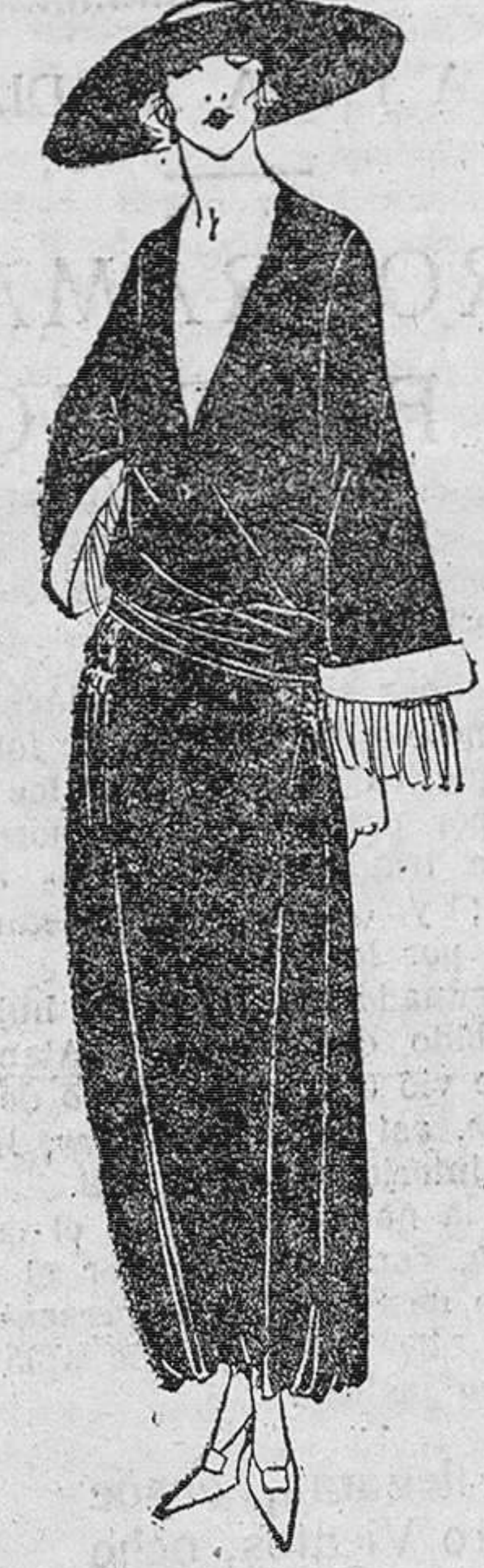
Traje en crepé de satén negro frunciendo en las caderas. Mangas de amplias vueltas blancas con unas pequeñas chorreras plisadas.

Esto, siempre en el caso especial que se consulta, porque le advierto, señorita—y esto lo brindo a todas mis amables amigas y favore-