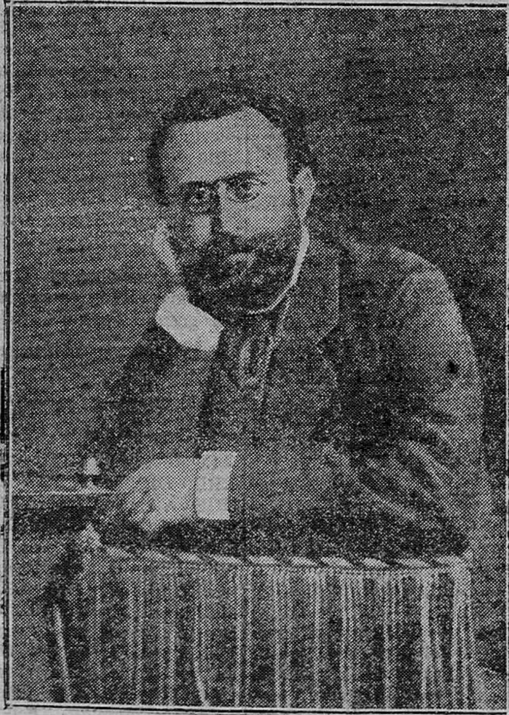
Silvela, ministro de la Gobernación en 1879

de sobre un espíritu selectísimo, todavía conserva algún calor la actuación de aquel eminente hombre de Estado.