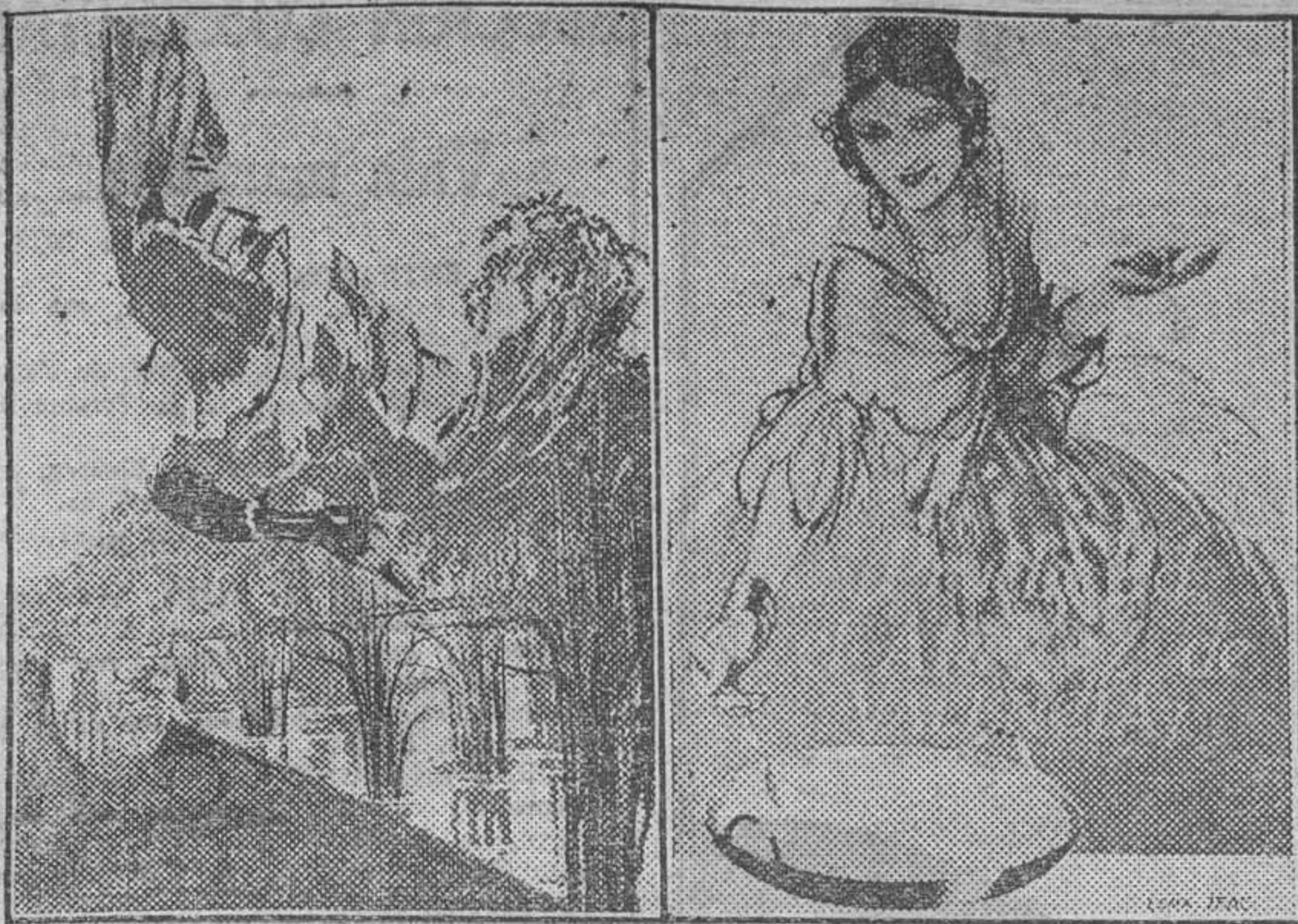
1 y 2. Cartelas que obtuvieron los dos segundos premios de las secciones extranjera y nacional...