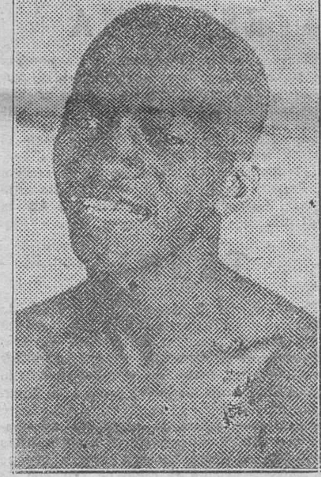
El negro Alp. Brown, que al vencer al español Vidal, ratifica su título de campeón mundial