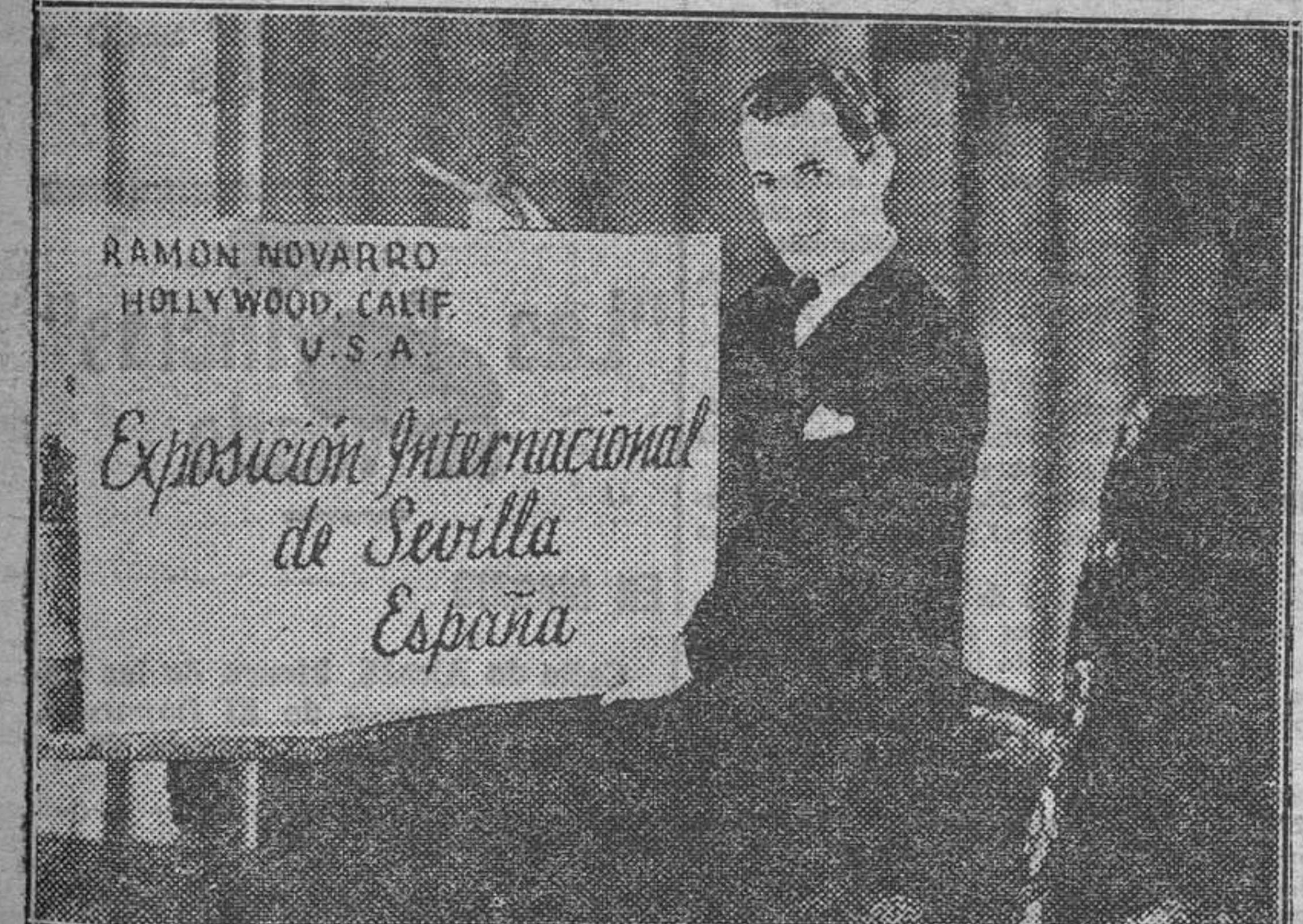
Ramón Novarro, desde las columnas de LAS PROVINCIAS, por mediación nuestra, envía un saludo a la Exposición de Sevilla