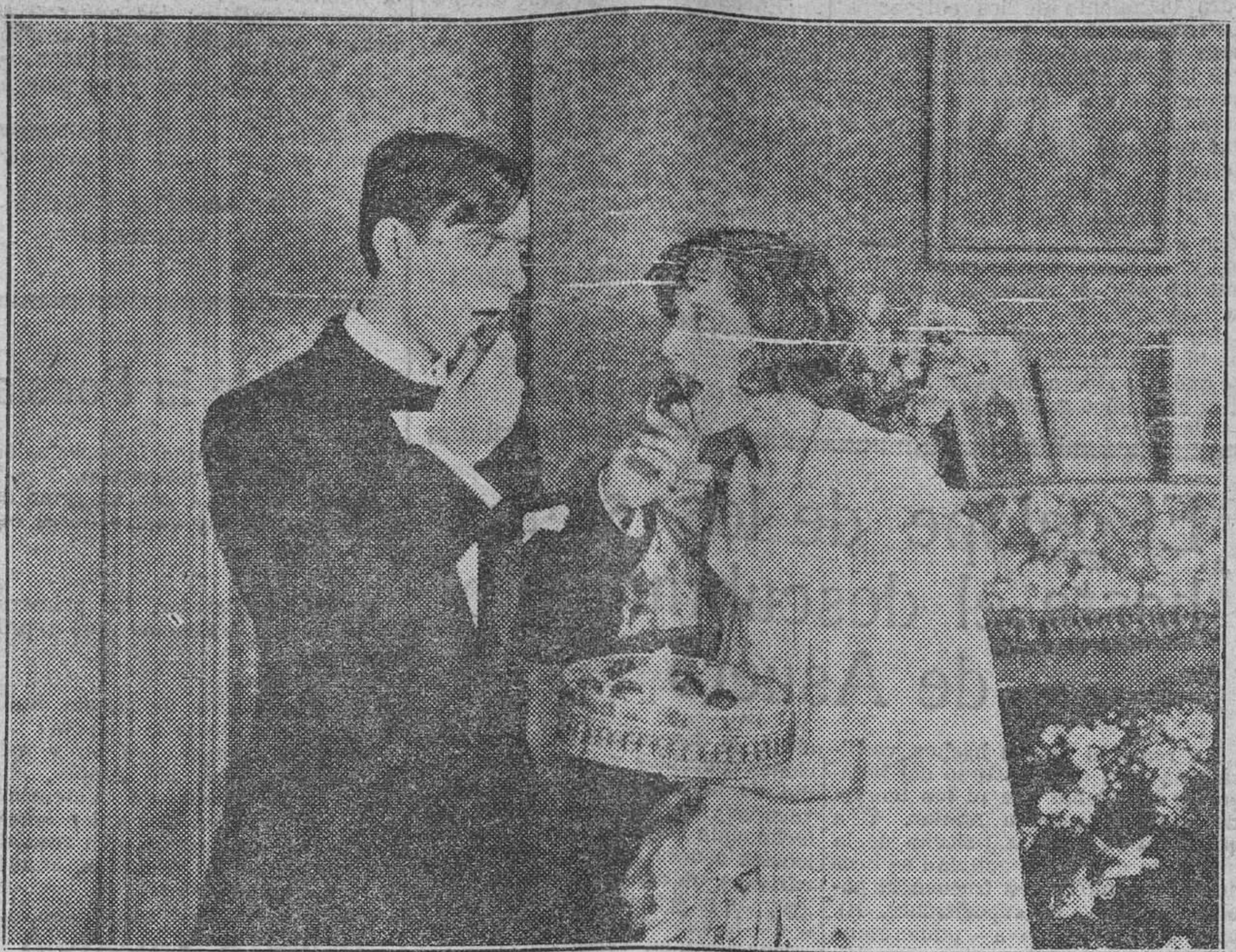
El famoso actor cómico EDDIE CANTOR, ídolo del público norteamericano y JOBYNA RALSTON, en la saludísima comedia a lo Harold Lloyd, titulada «POR ENCOMIENDA POSTAL»