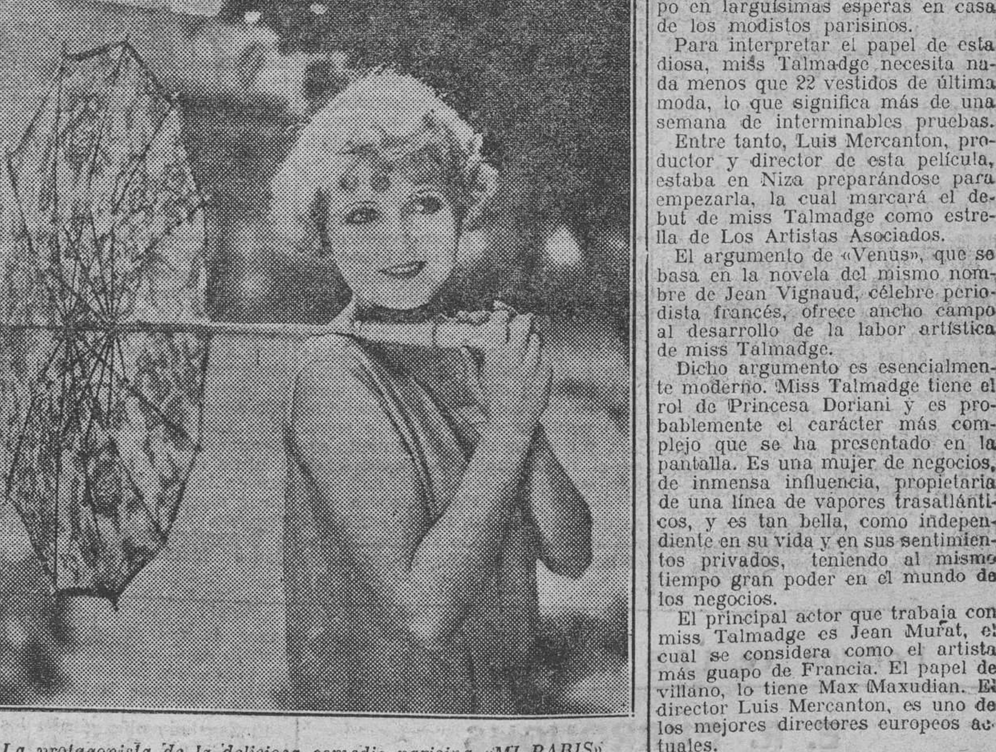
La protagonista de la deliciosa comedia parisiña «MI PARIS»