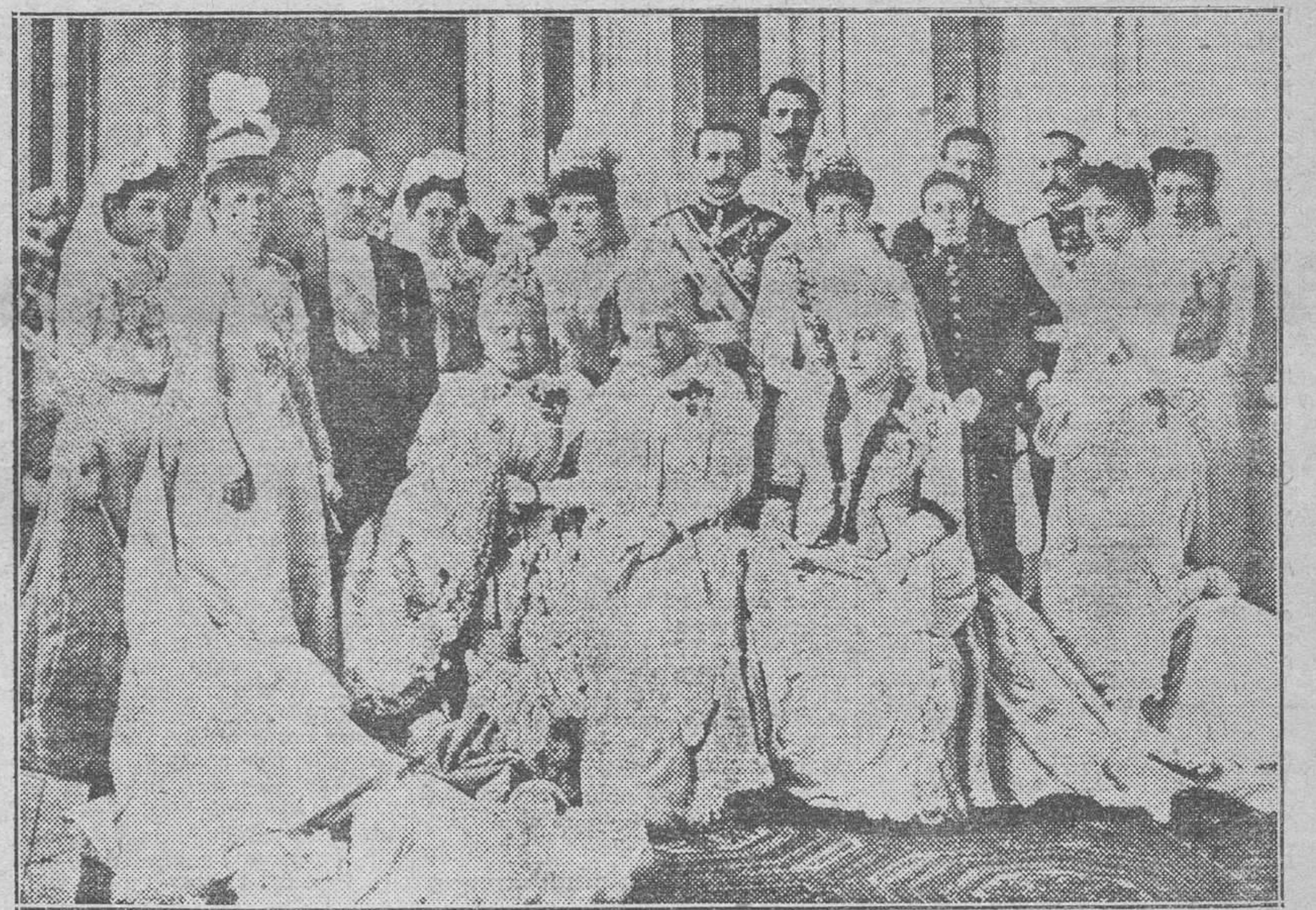
La familia Real, durante la Regencia

Ha causado general sentimiento el fallecimiento de Su Majestad la Reina doña María Cristina, que tan