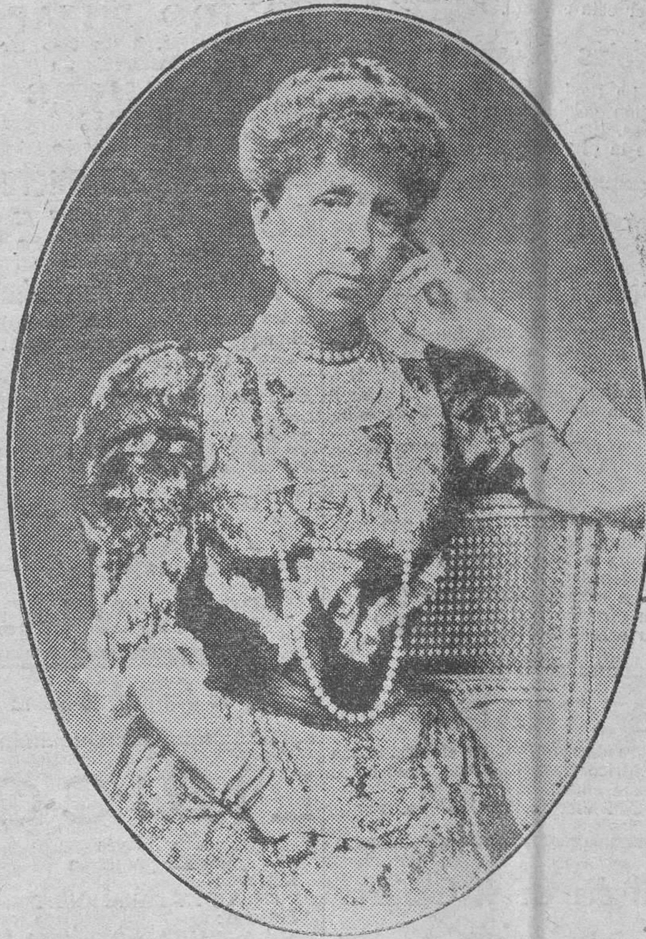
S. M. la Reina Cristina, madre del Soberano español

Coincidió la Regencia de María Cristina con el infructuoso levantamiento del general Villacampa. Sagasta, con sus medidas, logró desbaratar la revolución; y la Reina consiguió uno de sus más felices éxitos indultando al general rebelde, a instancias de la hija de éste, que así se lo rogó.