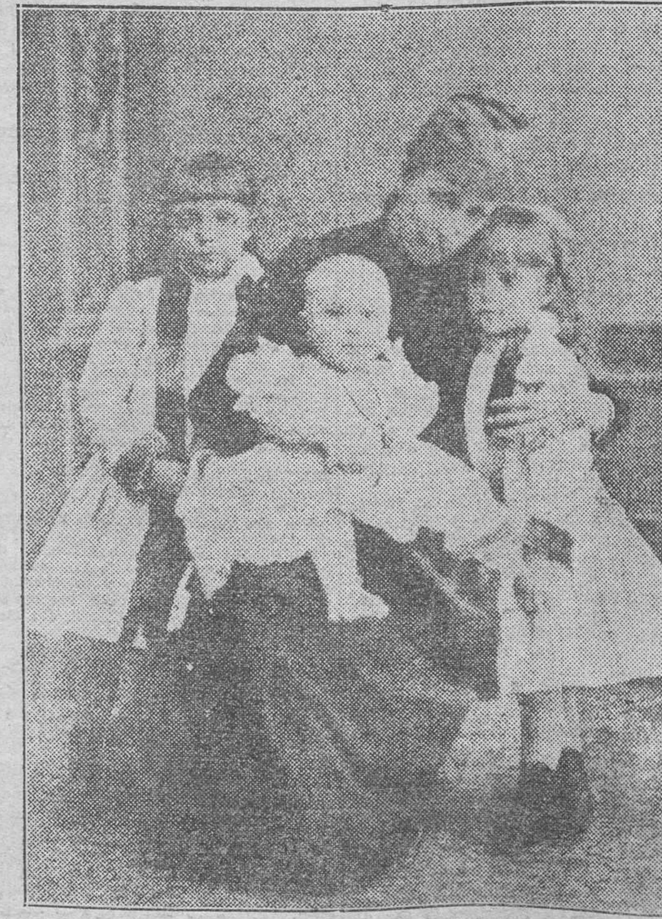
S. M. la Reina, madre amantísima

La Reina, joven, viuda, apenas conocida de los españoles, ya que apartada por entero de los asuntos políticos, vivía dedicada exclusivamente a la educación y cuidado de sus hijos, se encargó en momentos difíciles de la gobernación del Estado. Su primer acto como Reina, fue encargar del Poder a don Práxedes Mateo Sagasta, que constituyó un Gobierno liberal. Induló a varios reos políticos, derogó un decreto de Pidal sobre enseñanza y tuvo el acierto de ganarse prontamente los respetos y las simpatías nacionales.