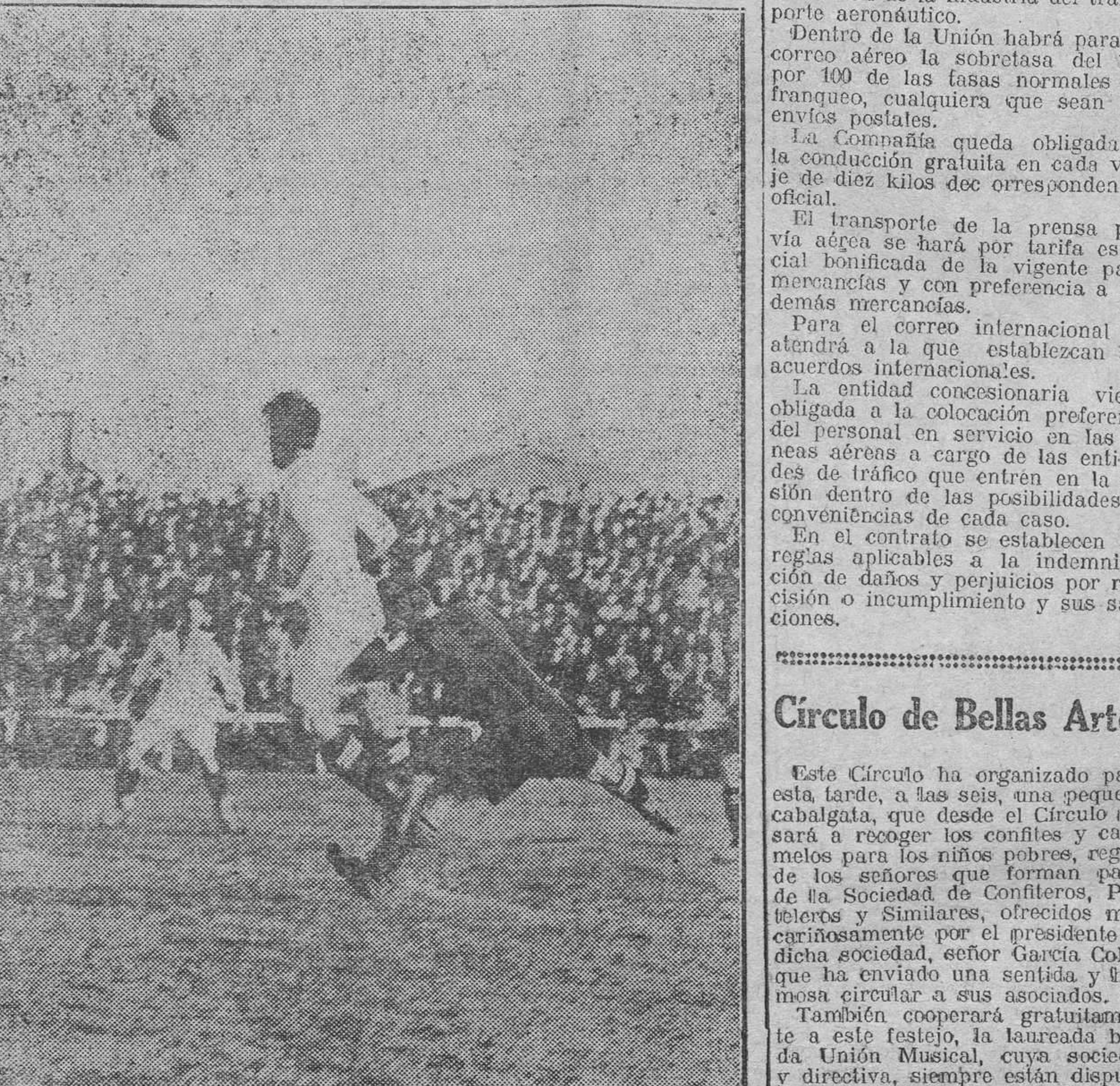
Uno de los innumerables fauts que se le escaparon al guipuzcoano Insausti