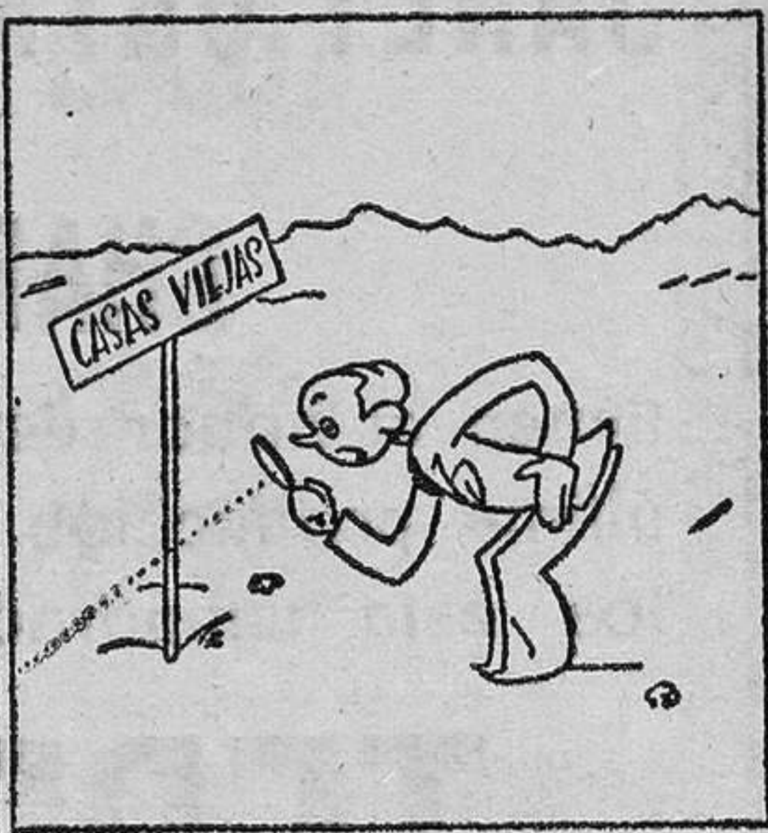
No han encontrado ni tejas, los que han ido a Casas Viejas.