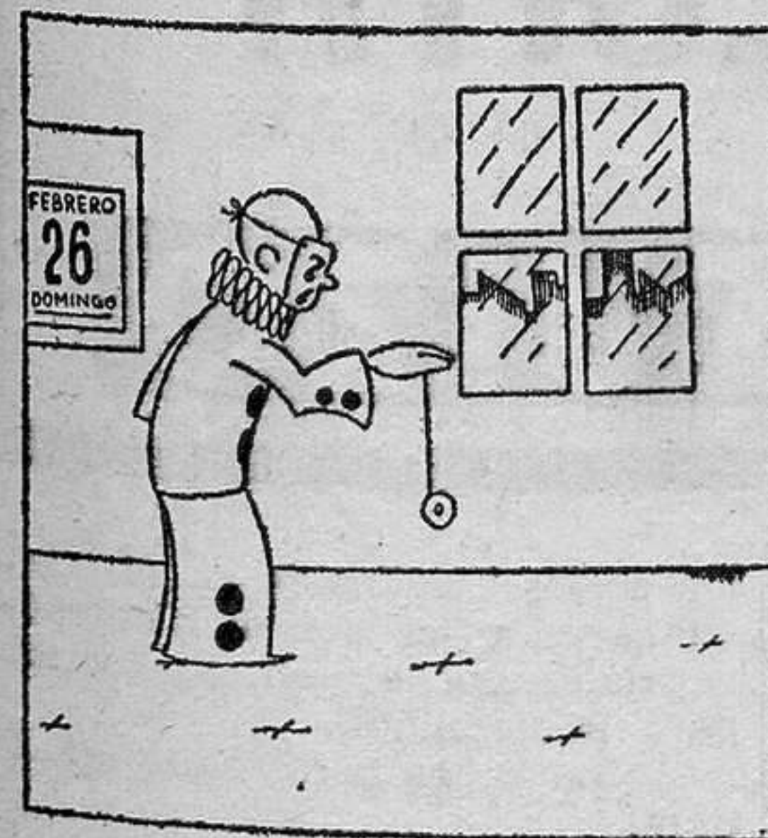
Don Carnaval no salió, porque tenía el "yo-yo".