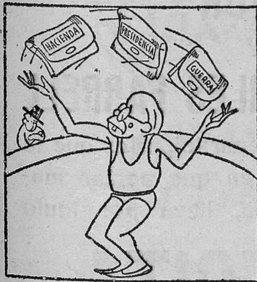
Juega, como con esferas, Azaña con tres carteras.