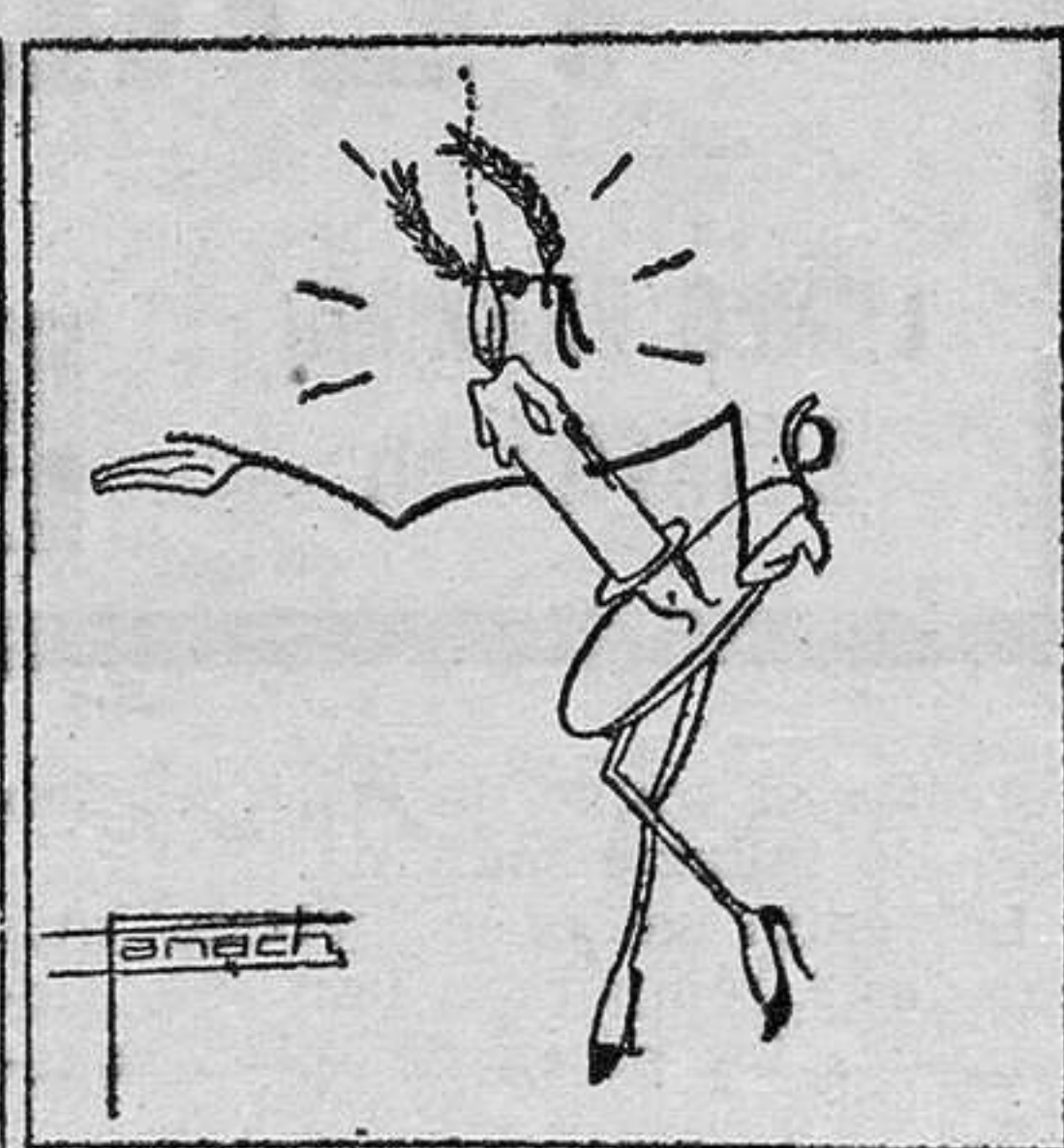
La que se lleva la gloria es, cual veis, la palmatoria. (Texto y monos de Panach.)

A propuesta de la comisión de reclamaciones se acordó elevar a la Diputación provincial la instancia redactada por secretaria, en los términos interesados por varias compañías con salto, productoras de fluido eléctrico, rogando que no prevealeza el aumento de cinco pesetas por kilowatio año, establecido en los presupuestos para 1933 de aquella Corporación por su comisión gestora.