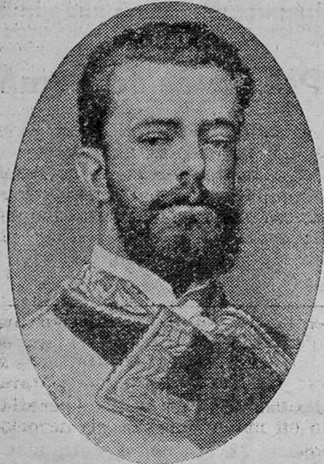
Amadeo I de Saboya

Lo que más elocuentemente hablaba al corazón de los espíritus vulgares, era el coche que utilizó en su postrimer carrera desde el Congreso de los Diputados hasta el Ministerio de la Guerra. Los