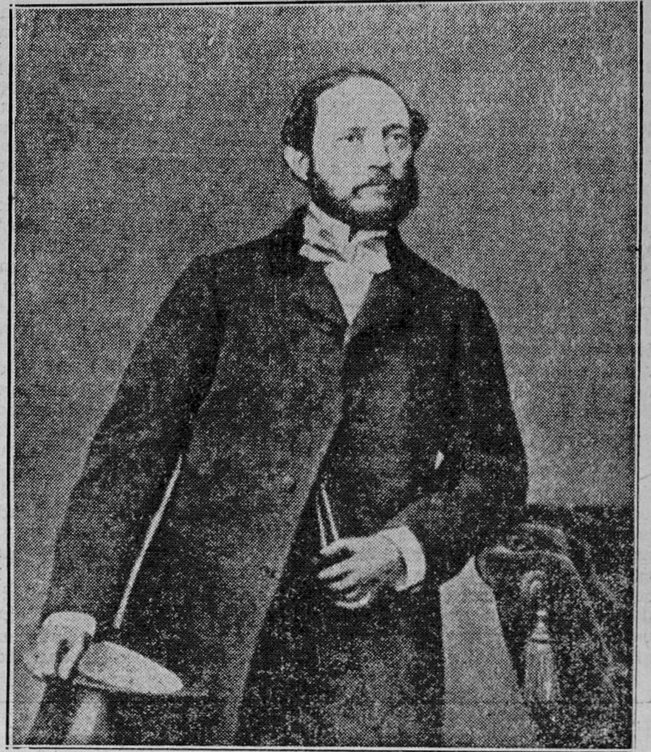
El general Juan Prim

El Rey don Amadeo, tras un breve descanso en Cartagena y Aranjuez, prosiguió su viaje a Madrid donde llegó el día 2 de Enero d