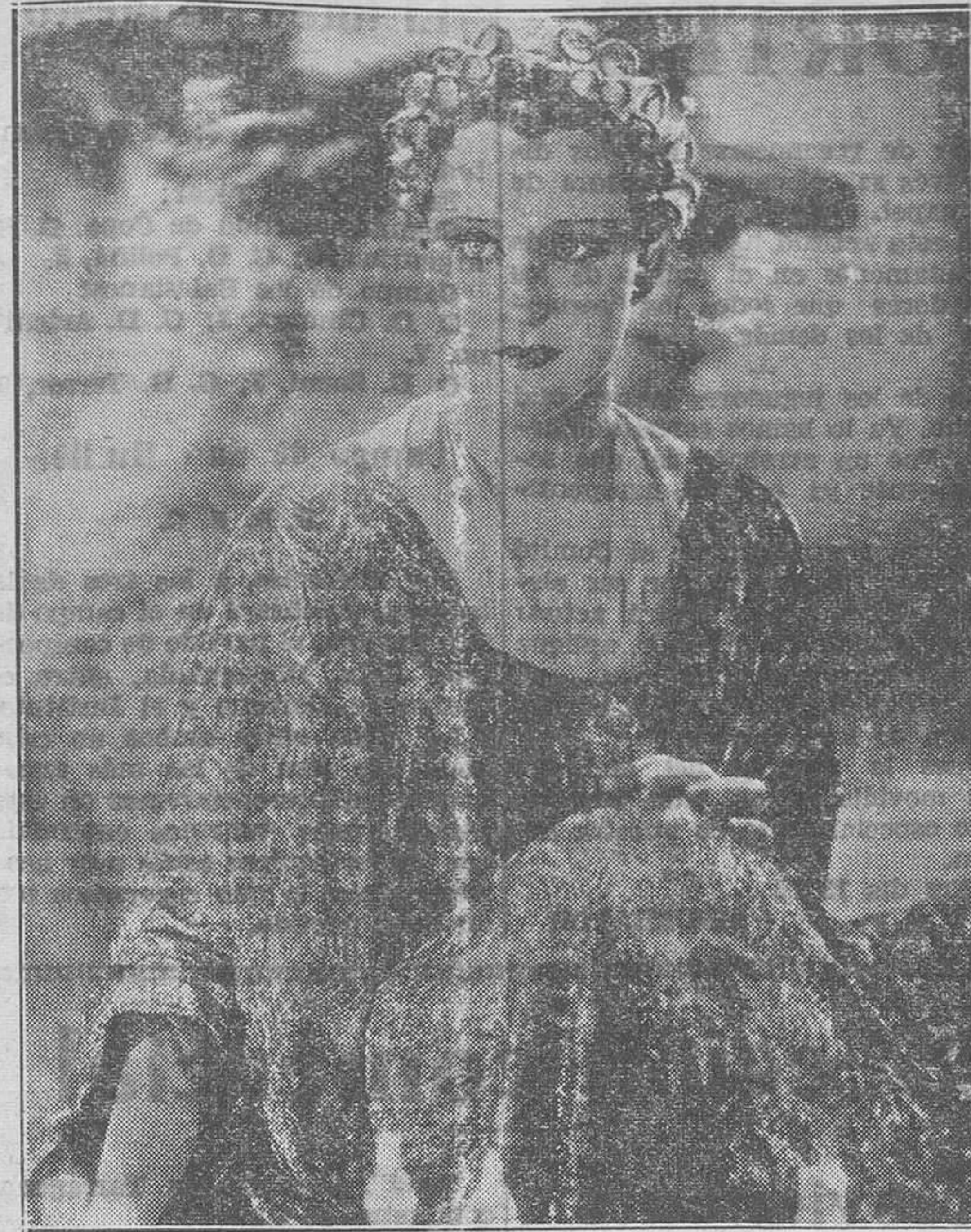
La bellísima Brigitte Helm, que triunfa en «La Atlántida», dirigida por G. W. Pabst

Richard Rodgers y Lorenz Hart, notables compositores norteamericanos, autores de más de cien popularísimas canciones, han escrito diez números musicales para la hermosa cinta Paramount, titulada «Amame esta noche», los cuales habrán de ser muy populares en cuantas partes se exhiba la maravillosa opereta, que tiene por intérpretes principales a Maurice Chevalier y Jeanette Mac Donald,