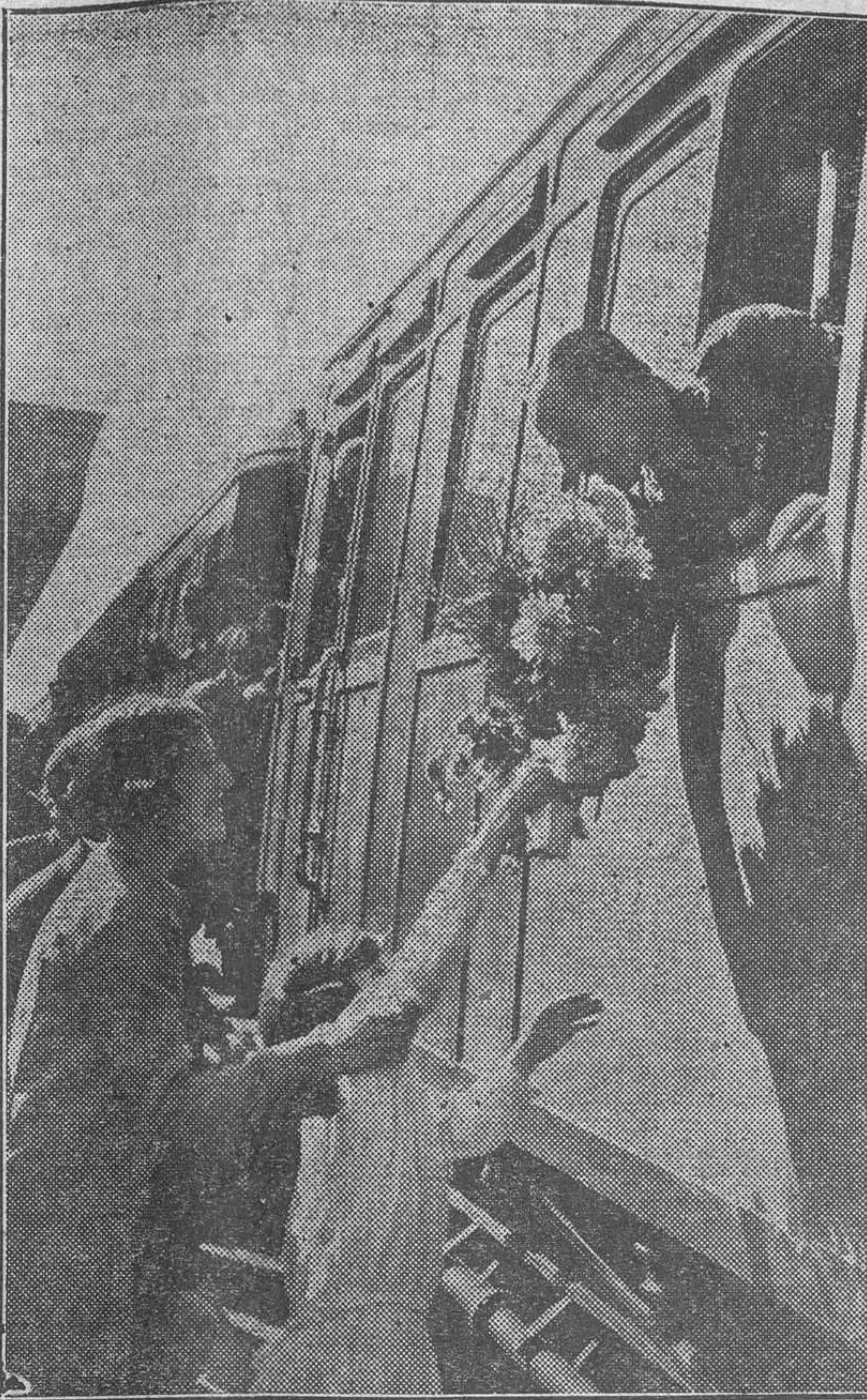
En el empalme de Barcelona a Gerona, S. M. el Rey recibe un ramo de flores de manos de una muchacha del pueblo.