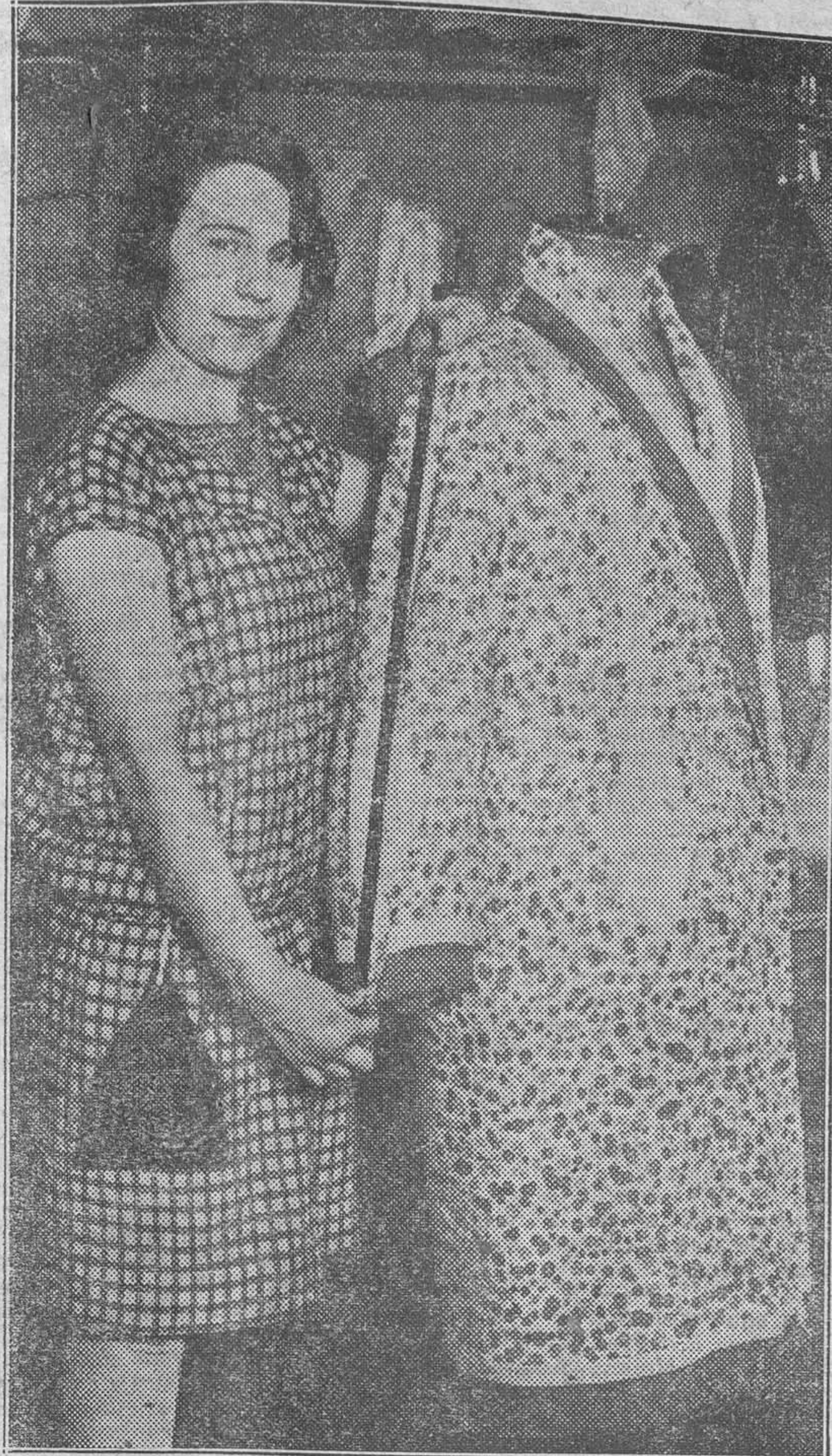
La Cámara Sindical de las Costureras ha proclamado el éxito del Concurso de aprendizas...

Si desea usted comprar Trajes Vestidos Abrigos Pielles Alfombras Mantas Edredones Géneros punto Tejidos en general INFORMESE ANTES en la CASA COGOLLOS QUE LE INTERESA San Vicente, 120-Tel. 1.120