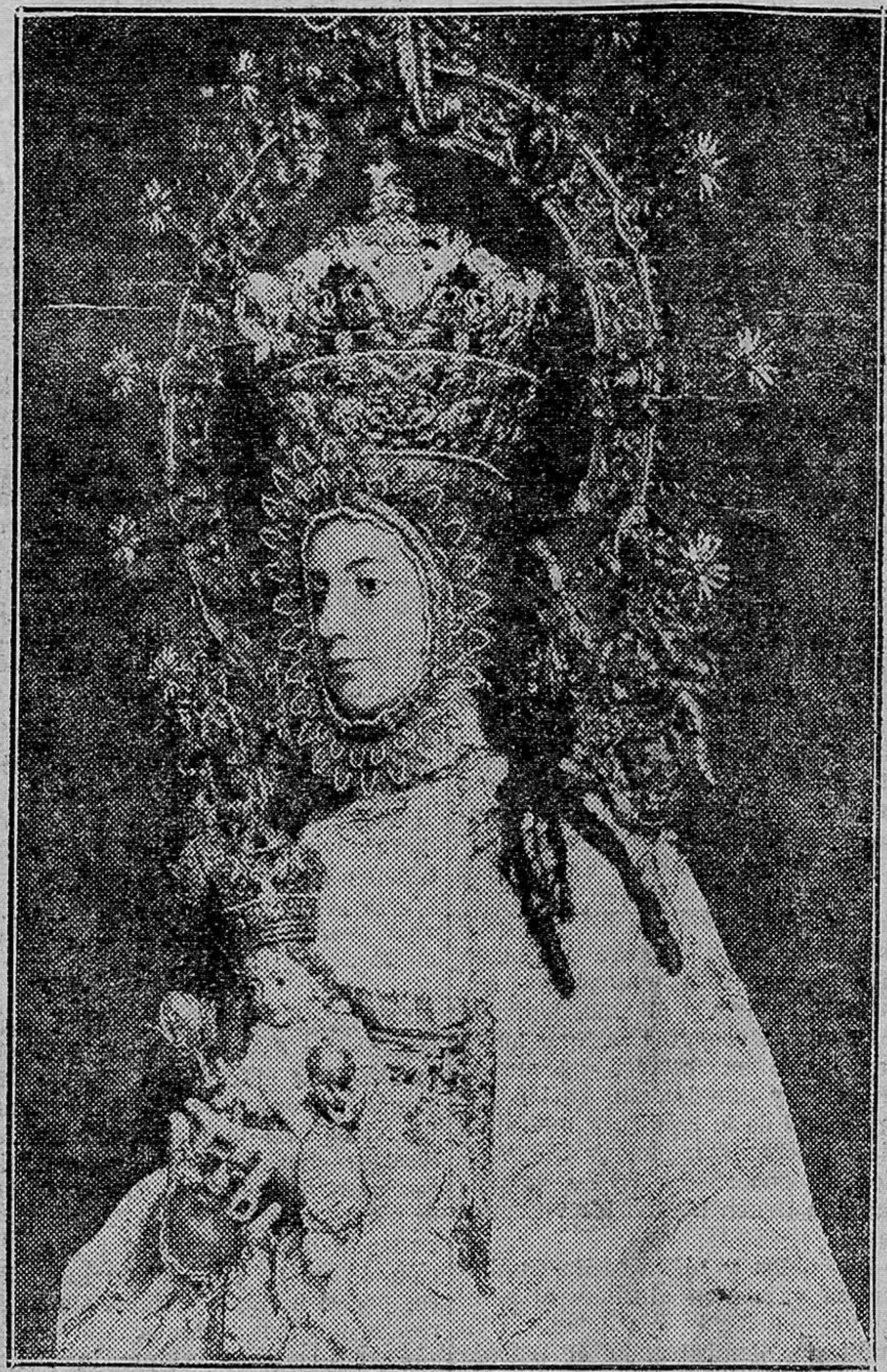
Primera fotografía obtenida, inmediatamente después de coronarla el Obispo, de esta veneranda imagen de la Virgen de Belén