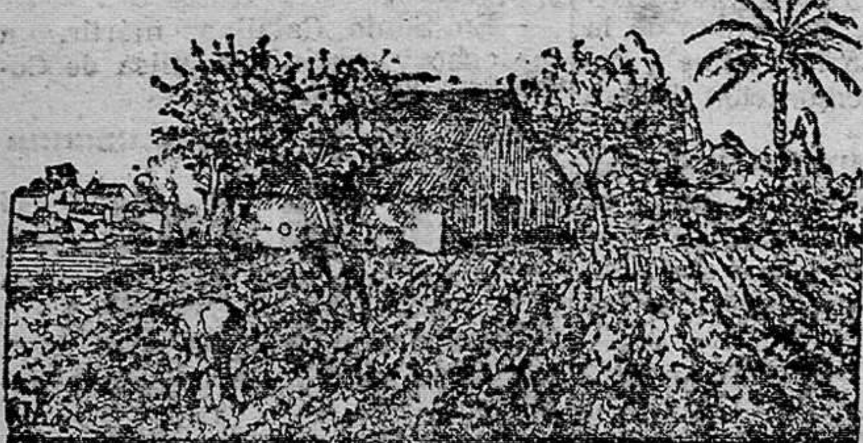
ANTONIO GARCIA, LINDERNA, 21, ENTRESUELO

Vendo más barato que todas las liquidaciones juntas. Compare los precios: Cortes de colchón para la cama ... 8 ptas. Sábanas flor algodón, todo una pieza ... 3,50 ptas. Colchas seripiqué para la cama ... 5 ptas. Cortes pantalón irrompible, para caballero ... 2 ptas. Por cinco céntimos, dos cuellos para caballero. Un corte de traje lana, para caballero ... 4 ptas. Gamuzas para abrigos señora, metro ... 0,75 ptas. Lanas para traje señora, metro ... 0,75 ptas. Vichys para colegiales, metro ... 0,90 ptas. Lanilla negra para lutos, metro ... 0,25 ptas. Servilletas damasco ... 2 ptas. Una docena pañuelos jareton ... 1,50 ptas. Un mantel para la mesa ... 2,50 ptas. Bufandas de seda para ambos sexos ... 2,50 ptas.