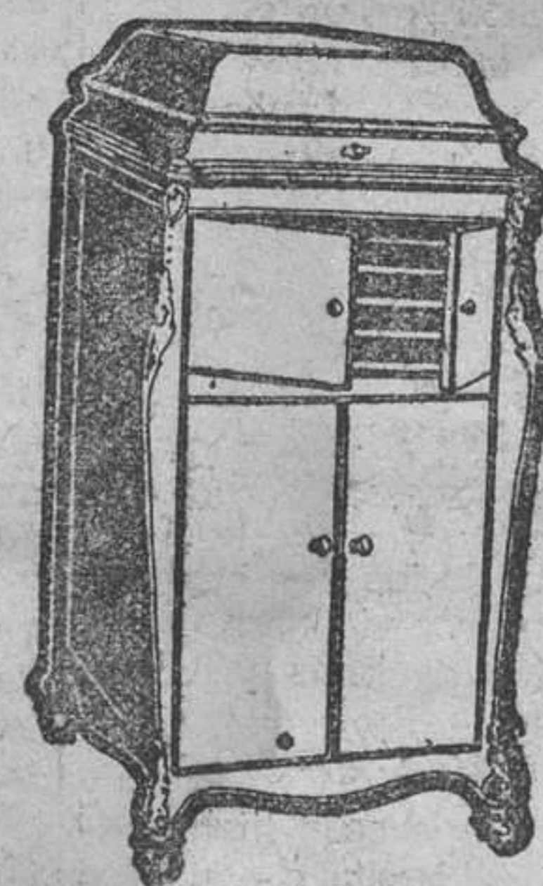
Magnífica GRAMOLA de la COMPAÑIA DEL GRAMOFONO, con 80 discos escogidos de la misma. Las que se hallan expuestas en el

REGALO VERDAD A LOS LECTORES DE ESTAS PAGINAS