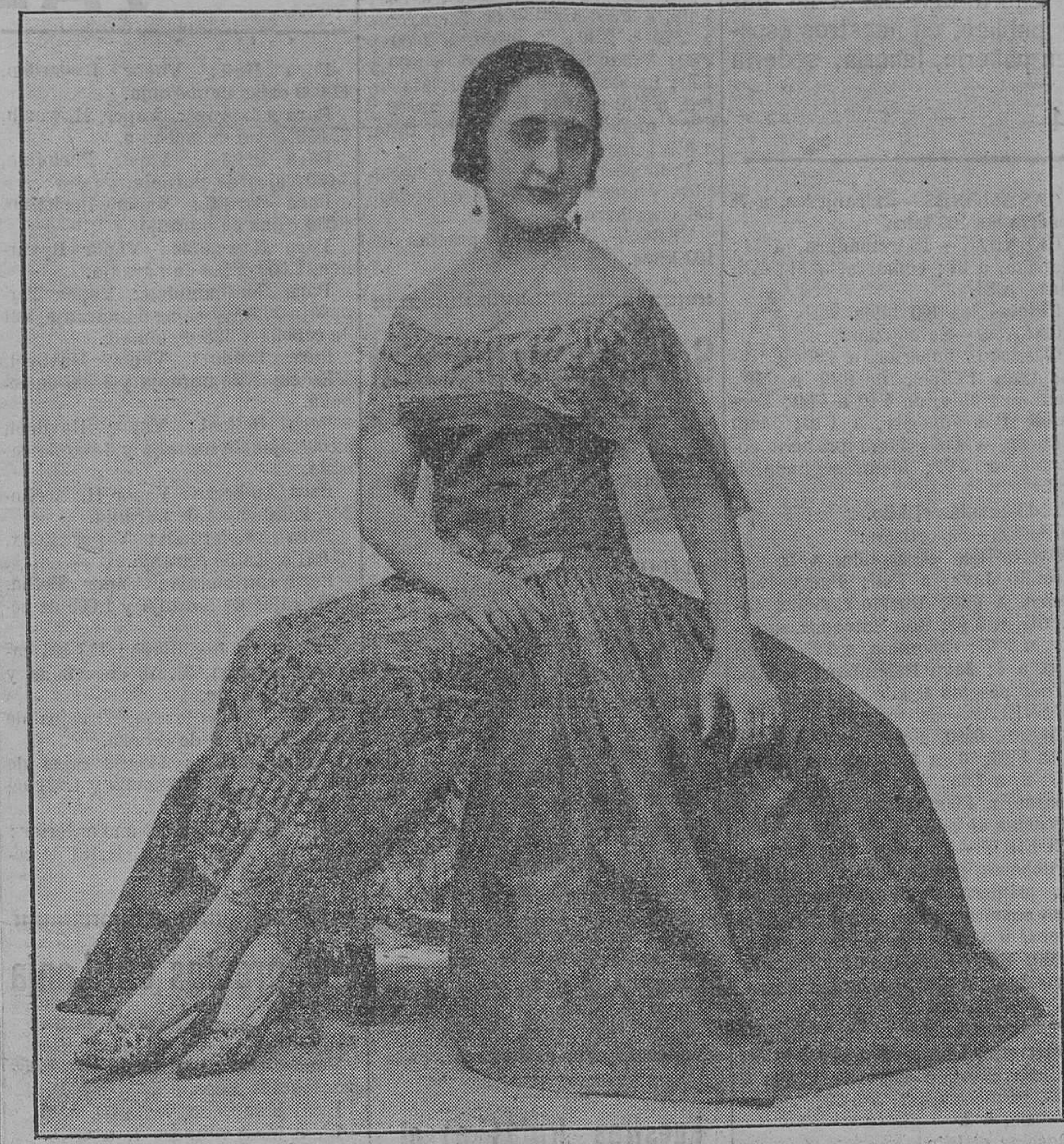
Una «toilette» de Iyonne Raynael, uno de los más famosos modistos

No gusto yo de estas tertulias, pero mi padre no puede prescindir