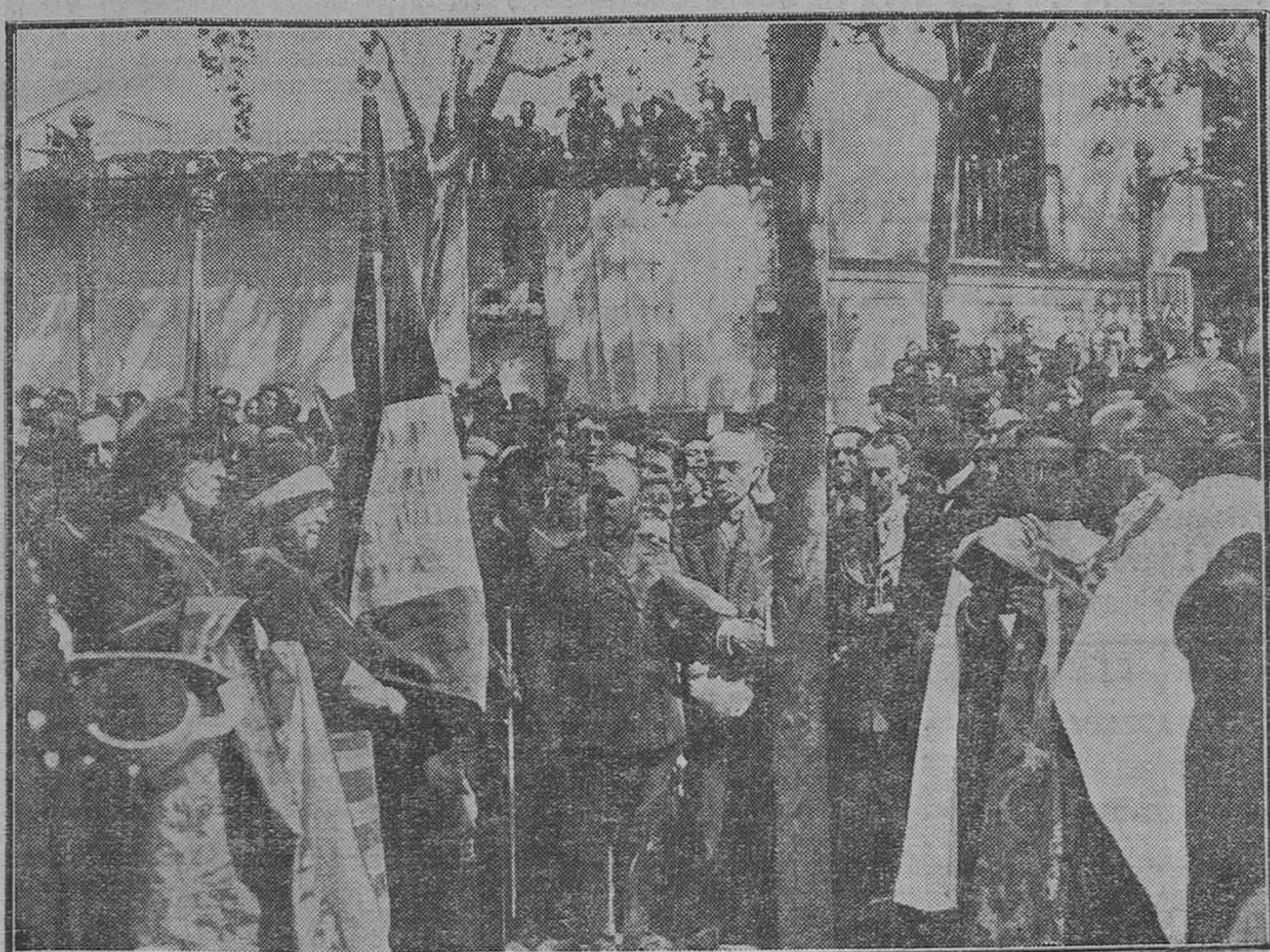
Burriana.—Bendición de las banderas del Somatén y del 5.º Tercio de la Guardia civil (De nuestro redactor señor Barberá)