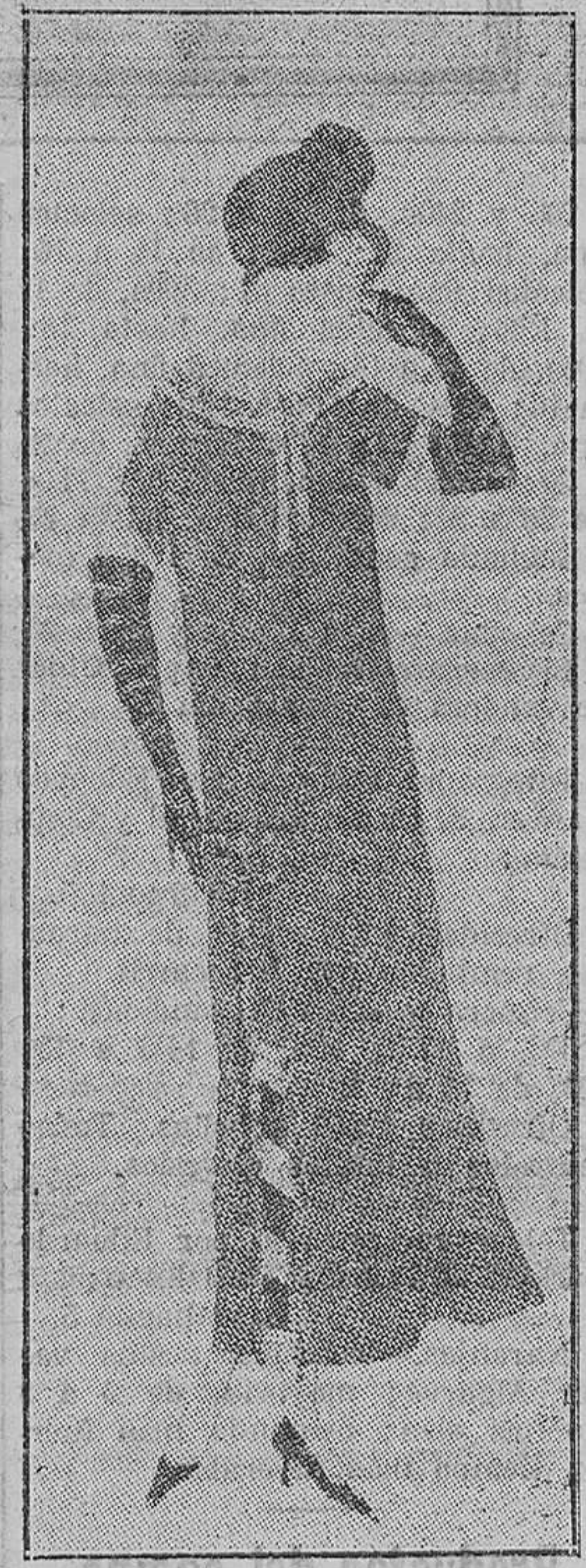
Traje de primavera blanco, combinado con verde. Modelo Drecoll

Las tempranas mimosas han surgido, como todos los años, rubias, intensamente perfumadas de aromas apasionados, esbeltas, lozanas, y que, al ser contempladas y desbordarse en el abigarrado jarrón de Talavera, dan la sensación de una brillante cascada de rayos de sol. Todos los años llegan estas be-