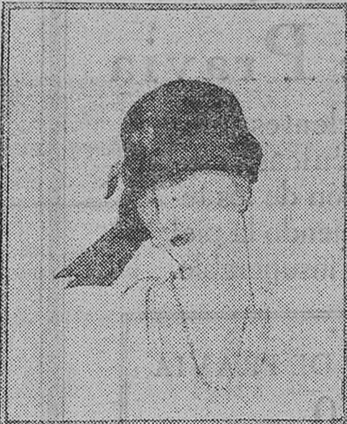
Otro modelo de Lewis en forma de pequeña cloche, de moiré negro, con un nudo en un lado