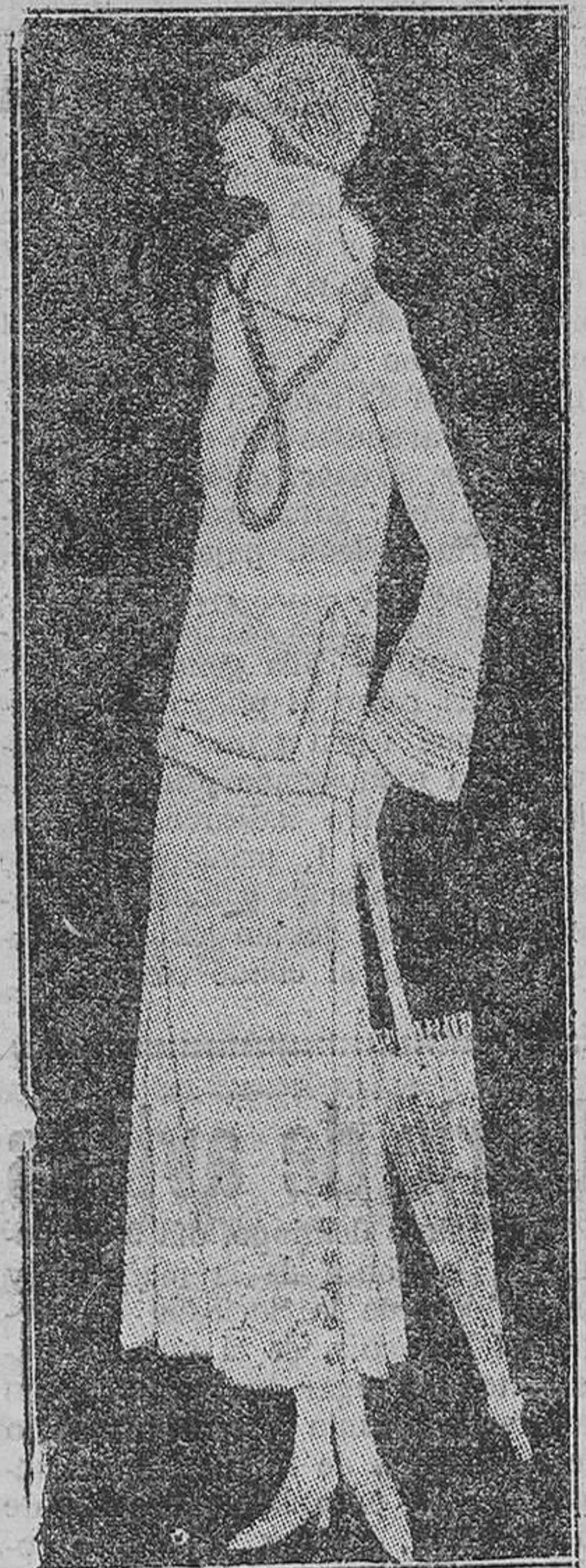
Sencillo y elegante traje color violeta, adornado con plata