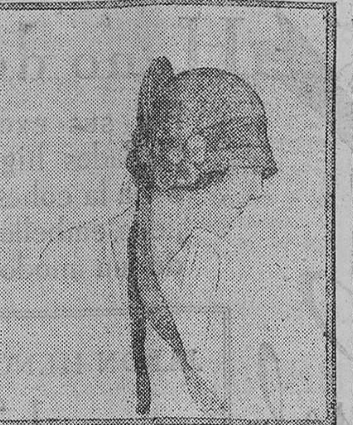
Ensayo de sombrero Luis XVI adornado con flores y cintas rojas y negras