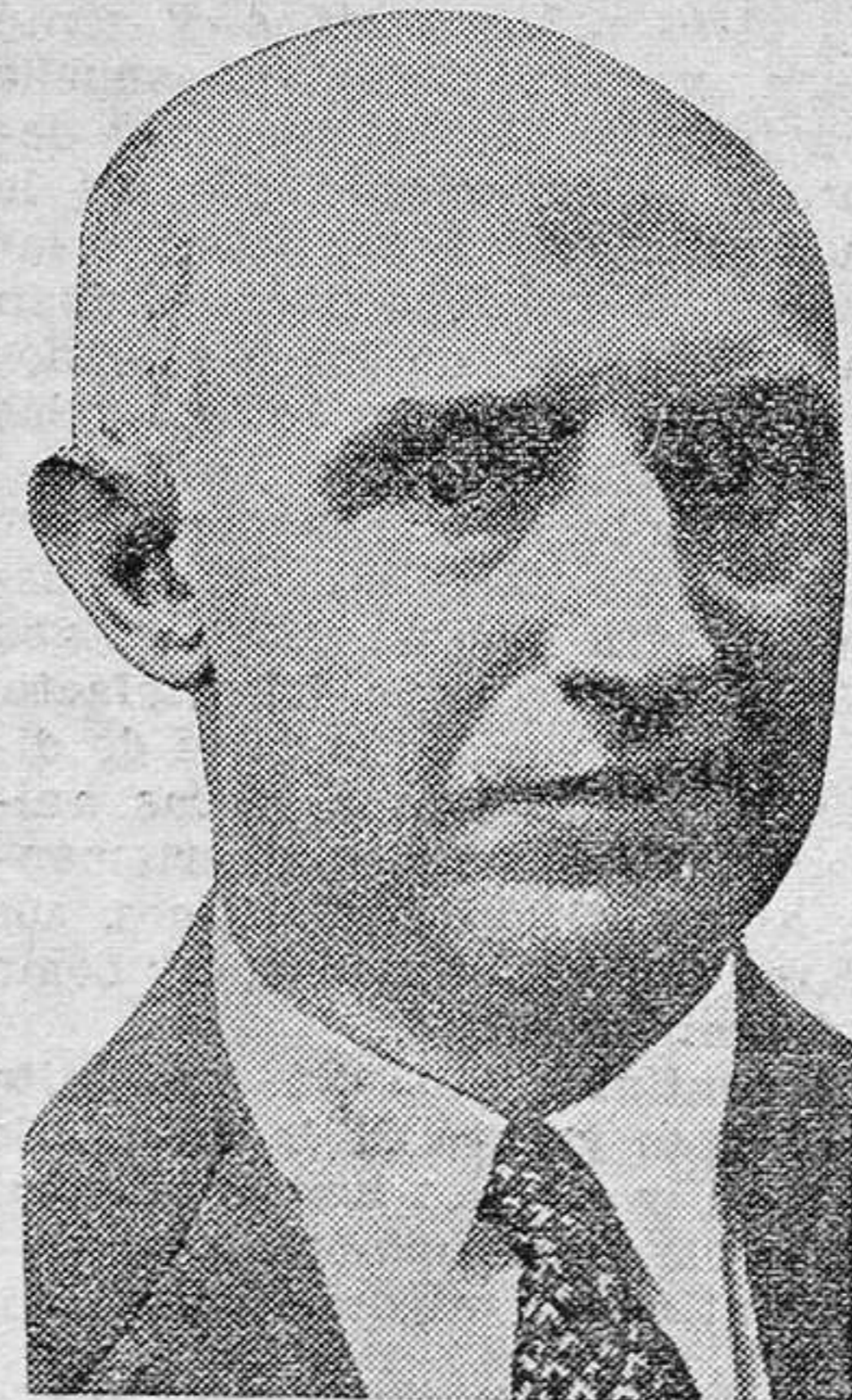
Don Juan March, a quien se le piden seis millones de pesetas de fianza para responder de los daños que puede haber ocasionado al Estado