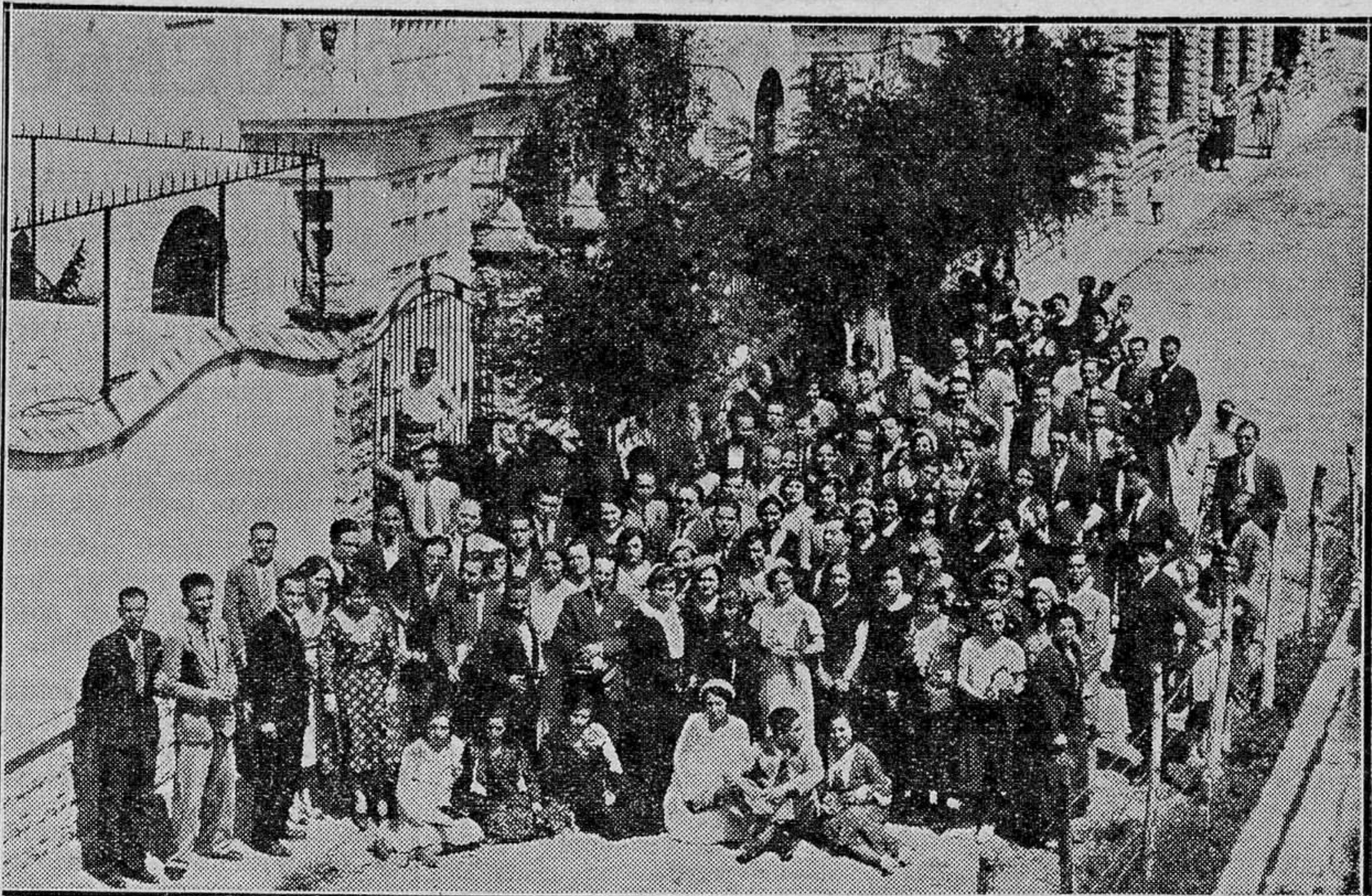
Los cursillistas aspirantes a ingreso en el Magisterio, saliendo de visitar una de las barriadas de casas baratas, construidas con el auxilio de la Caja de Previsión