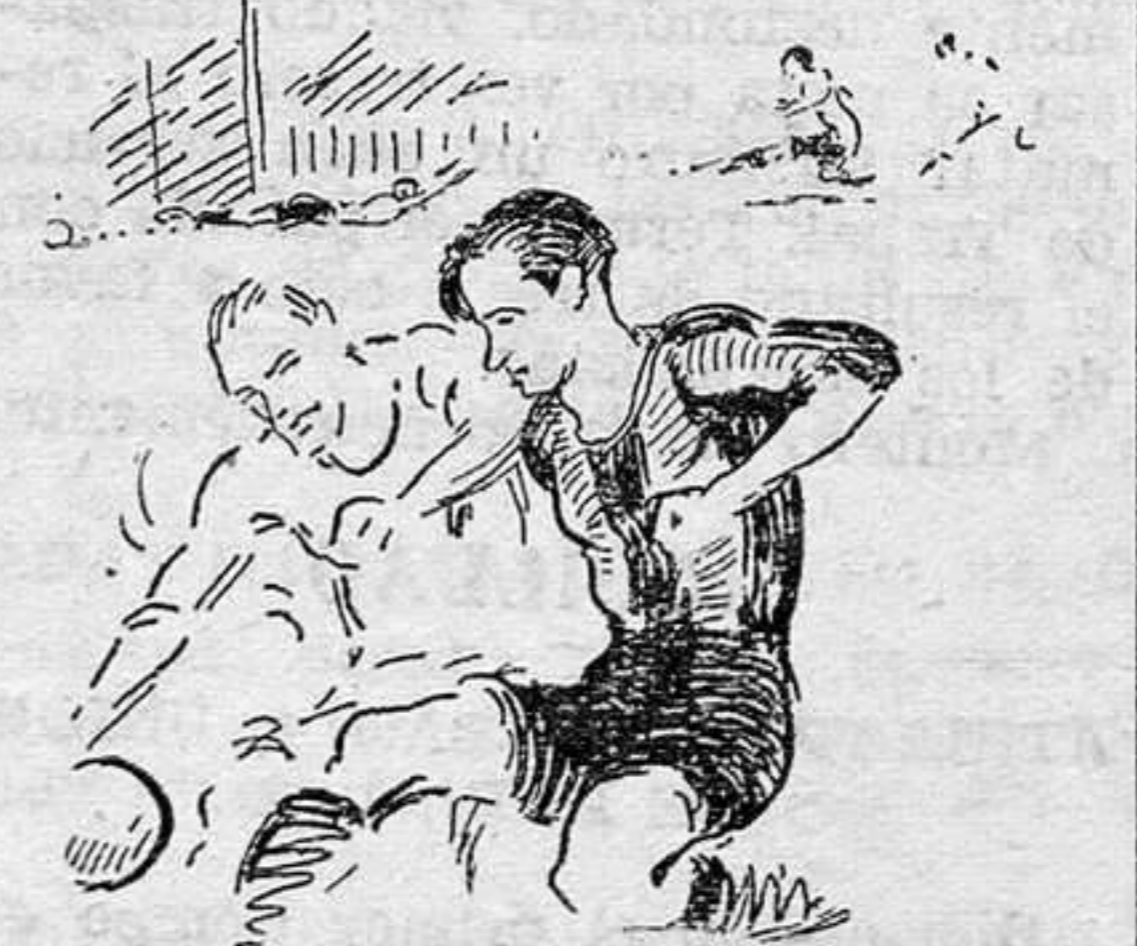
Un avance de Goiburu

Melcón se dejó ayer en Mestalla, para muchos, todo su prestigio. Para nosotros, no. Sin pretender que tuviera un