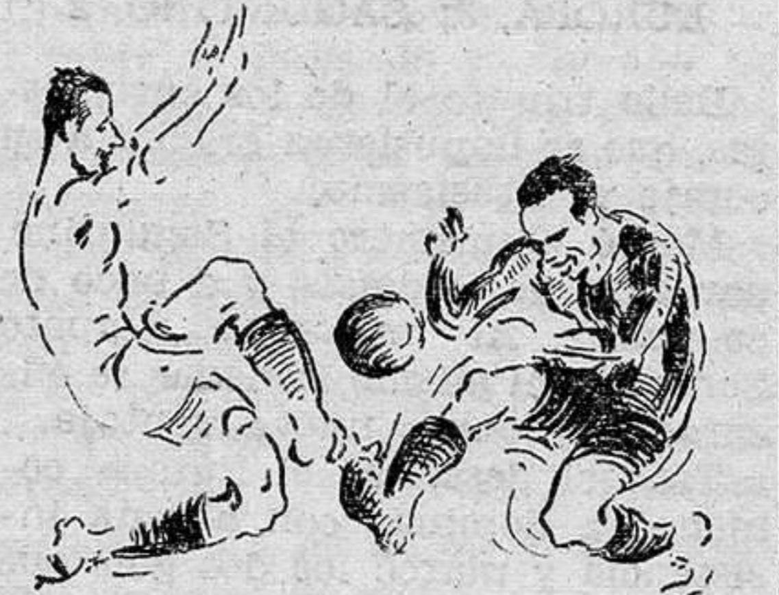
Un despeje de Melenchón

Tuvo el Barcelona tres grandes cosas. Una línea delantera con una triplete central que se hartó de jugar como y cuando quiso.