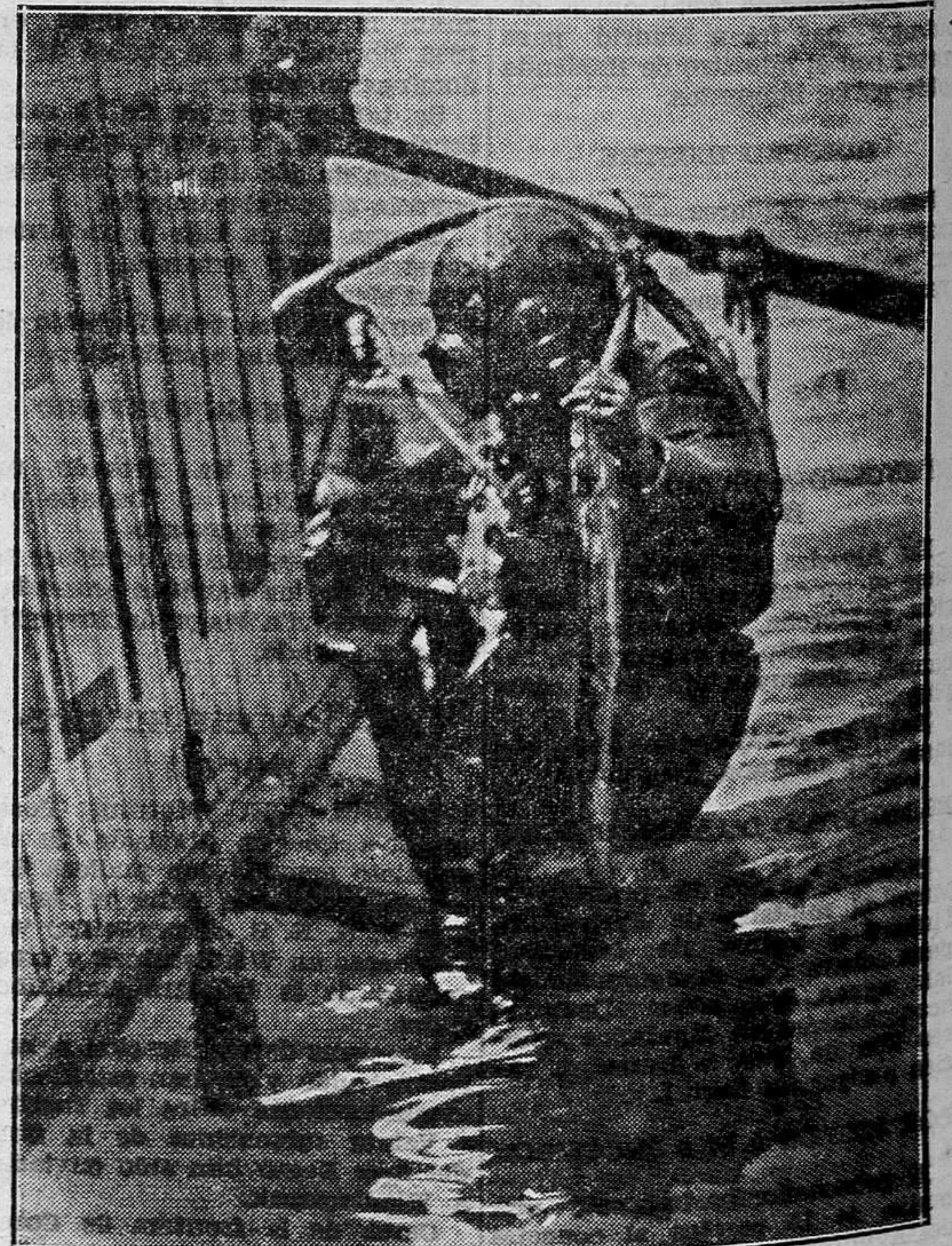
Tras dos horas de inmersión, el buzo sale del agua para descansar durante quince minutos