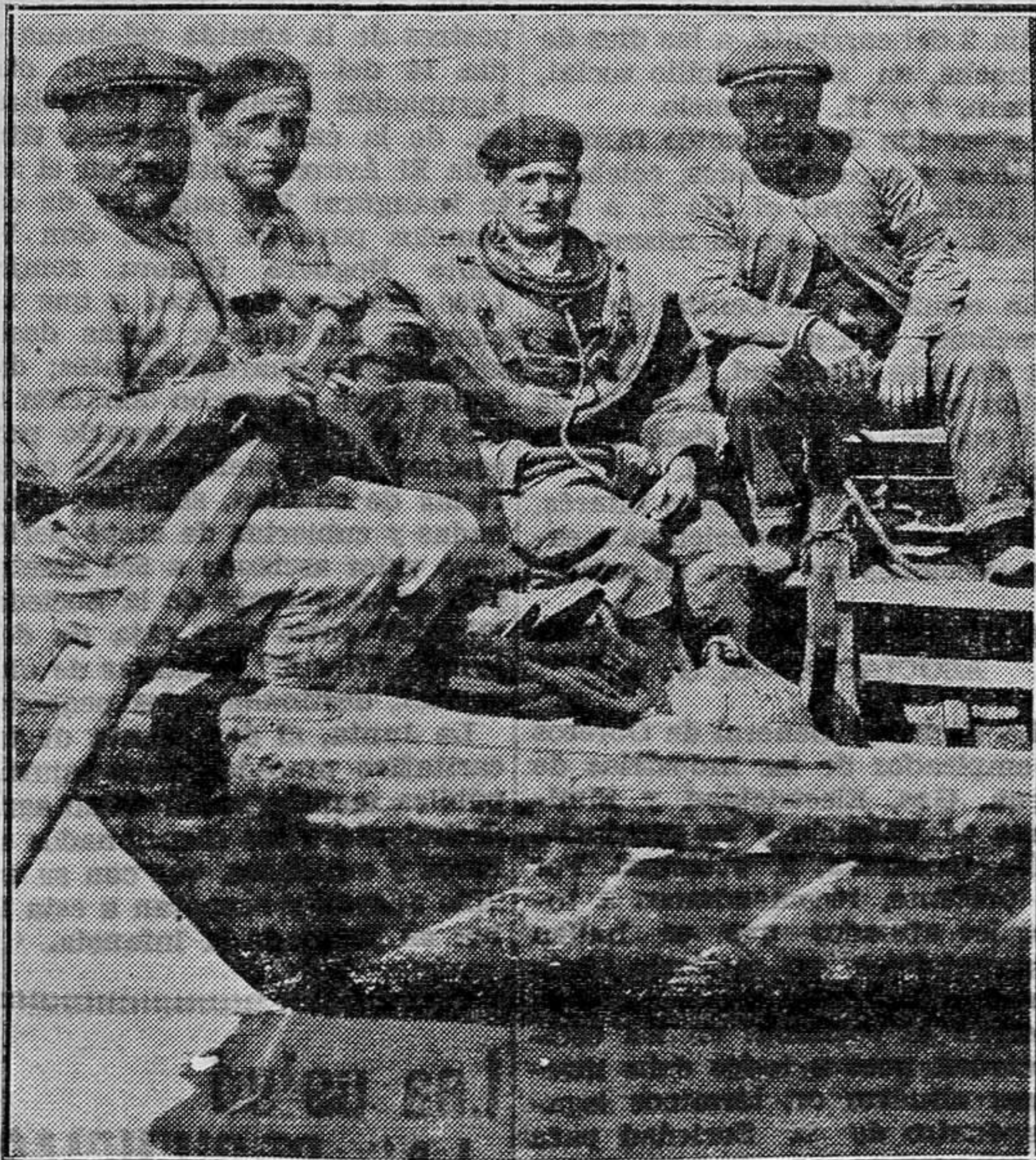
El buzo y sus ayudantes van mar adentro dispuestos al trabajo

Un buzo, Un guía, que es el encargado de recibir las señales que desde abajo, y por una cuerda, le va dando el buzo. Dos encargados de la bomba que transmite al buzo el aire respirable. Y el patrón de la barca.