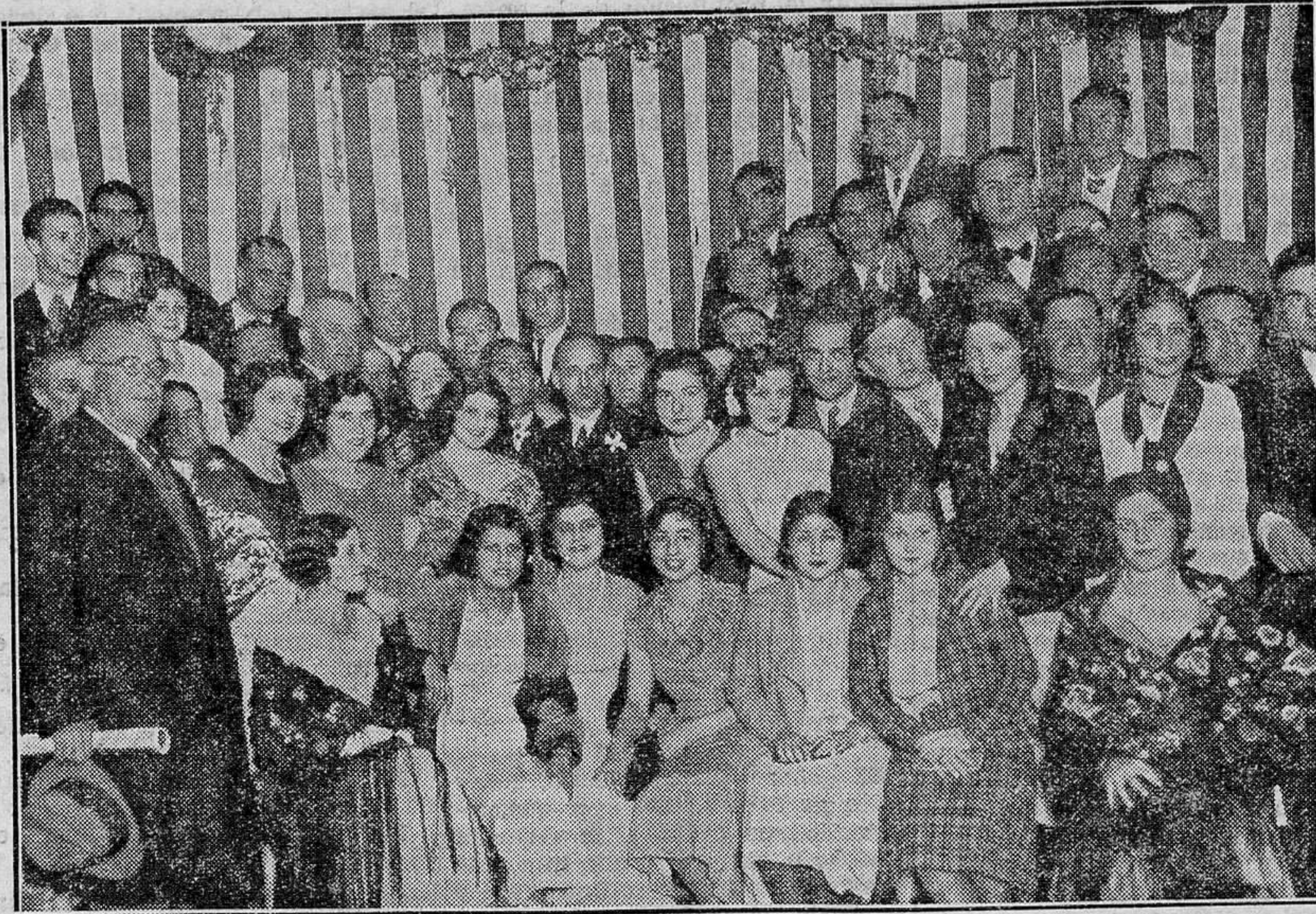
De la famosa Feria de Sevilla.—El ministro de la Gobernación, señor Casares Quiroga (x) visita la caseta del Círculo Militar

Mientras dure la colaboración (no siempre muy lógica) entre todos los elementos opuestos a los extremos, se podrá evitar, probablemente, que Hitler llegue al Poder en Alemania, menos en algunos Estados, pero bastaría que los socialistas se separaran de los conservadores, o viceversa, para que la avalancha nacional-socialista derribara todos los obstáculos. An-