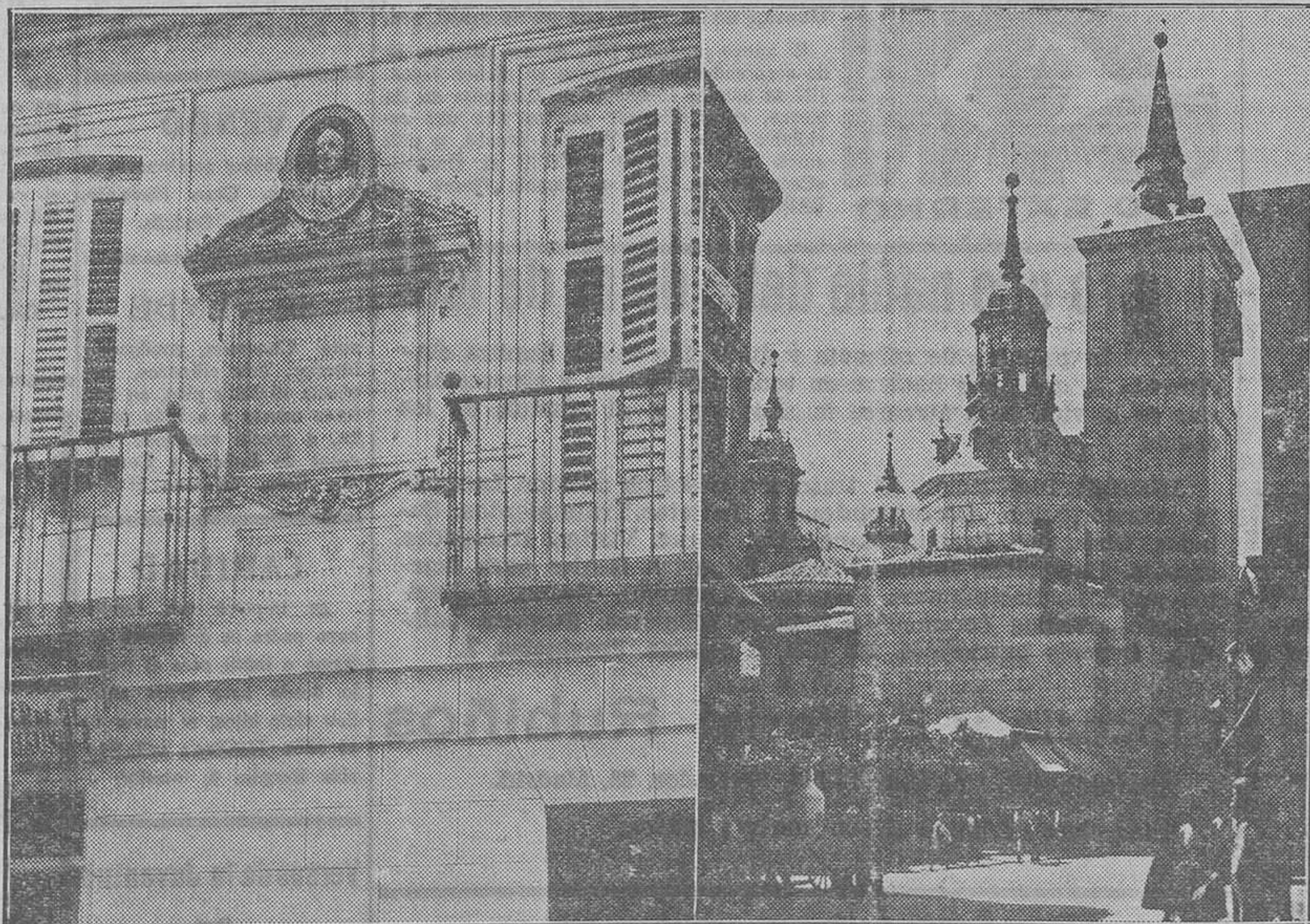
Fachada de la mansión de Lope de Vega.—Iglesia de San Sebastián, donde reposan las cenizas del eminente escritor

que no perfectas todas sus obras, en todas ellas dejó algo del esplendor de su genio.