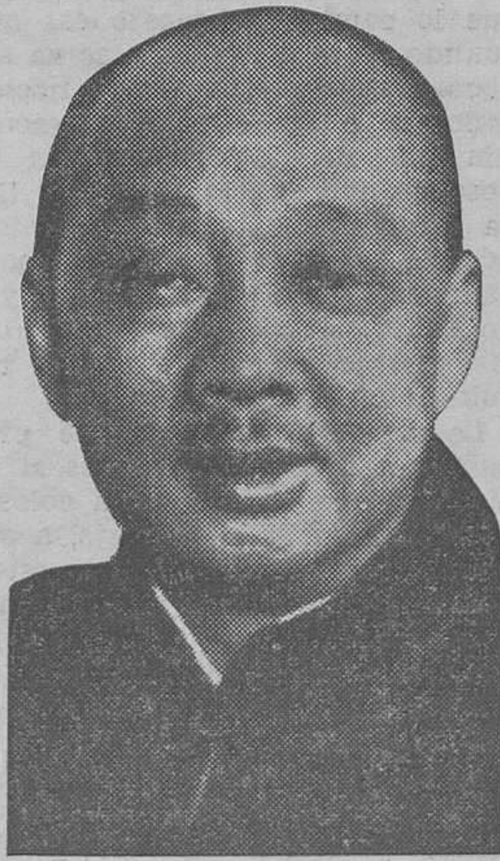
Hsie Chieh Shie, primer ministro de Negocios extranjeros del nuevo Estado manchú