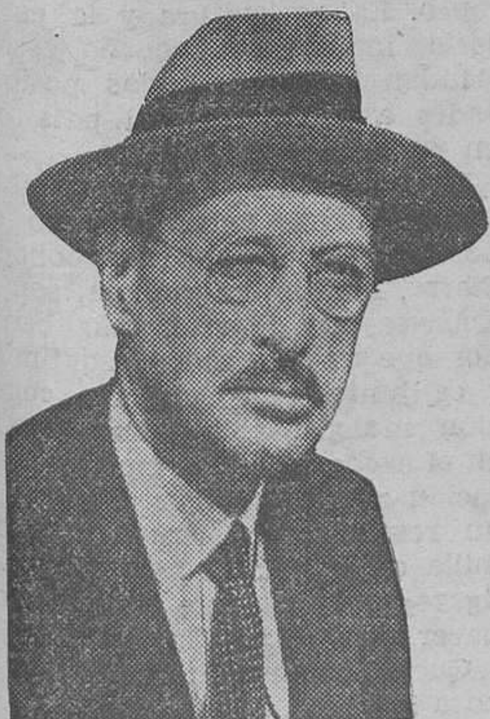
El conde Karoly, jefe del Gobierno austriaco, que presentó la dimisión colectiva