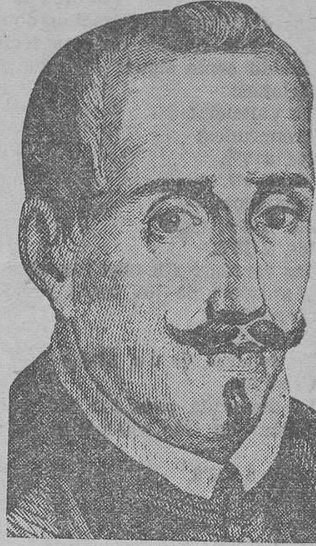
Lope de Vega

Para las almas inteligentes y sensitivas, uno de los barrios más interesantes que tiene Madrid es, sin duda alguna, esa porción de calles y plazas que, conservando a través del tiempo su primitiva conformación urbana, se agrupan mansas y silenciosas en torno a la antigua iglesia de San Sebastián.