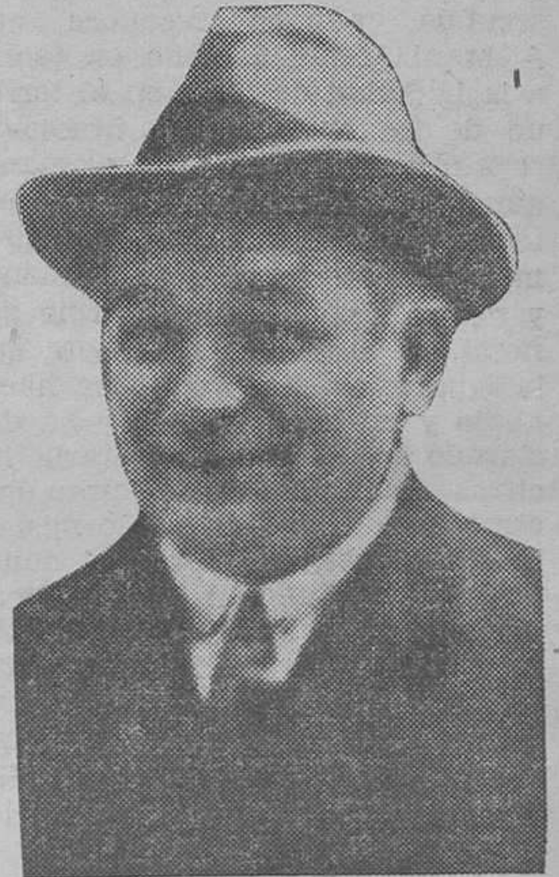
Mr. Hansson, líder del partido socialista sueco, a quien el Rey Gustavo ha encargado la formación de nuevo Gobierno