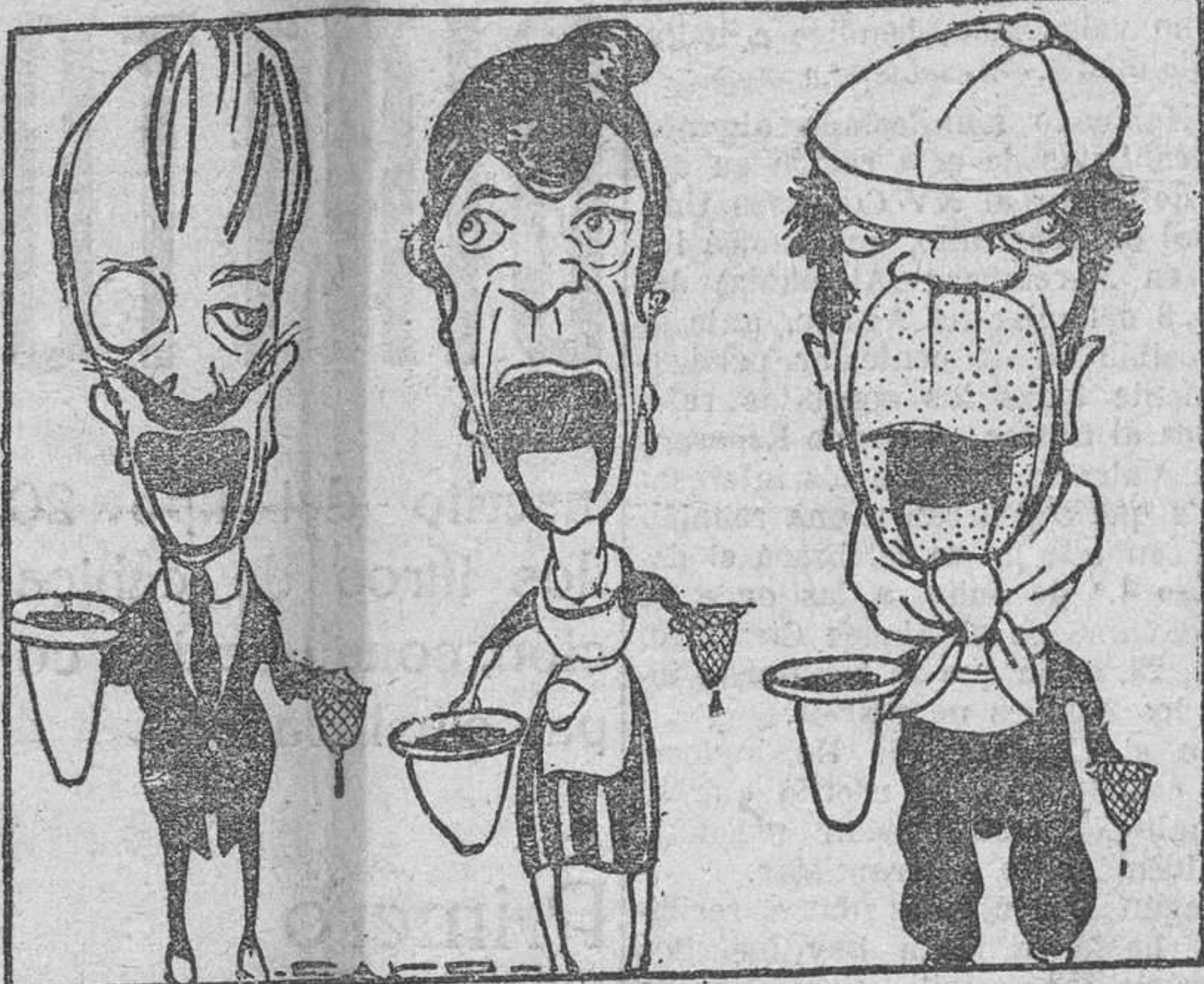
El lápiz de Caro ha sorprendido lo: bostezos de esas figuras de las rifas de Neuilly, que parecen monstruos hidrocefalos de la familia de Sanz. Hay que aprovechar uno de esos bostezos, y hacerle tragar a la cabezota una pelotilla, para ganar un salero, dos saleros, tres saleros... equi. salero

París tiene también sus ferias de pueblo como nuestra Feria de Navidad; pero como París es un mundo, esta feria es una maravilla que forma la población pintoresca de saltimbanquis, atletas y feriantes. Una gran explanada de más de dos kilómetros de longitud. Allí está instalada la feria, con sus barracas a un lado y otro de la Avenida, formando una «calle de feriantes», cubierta con el patio luminoso de un