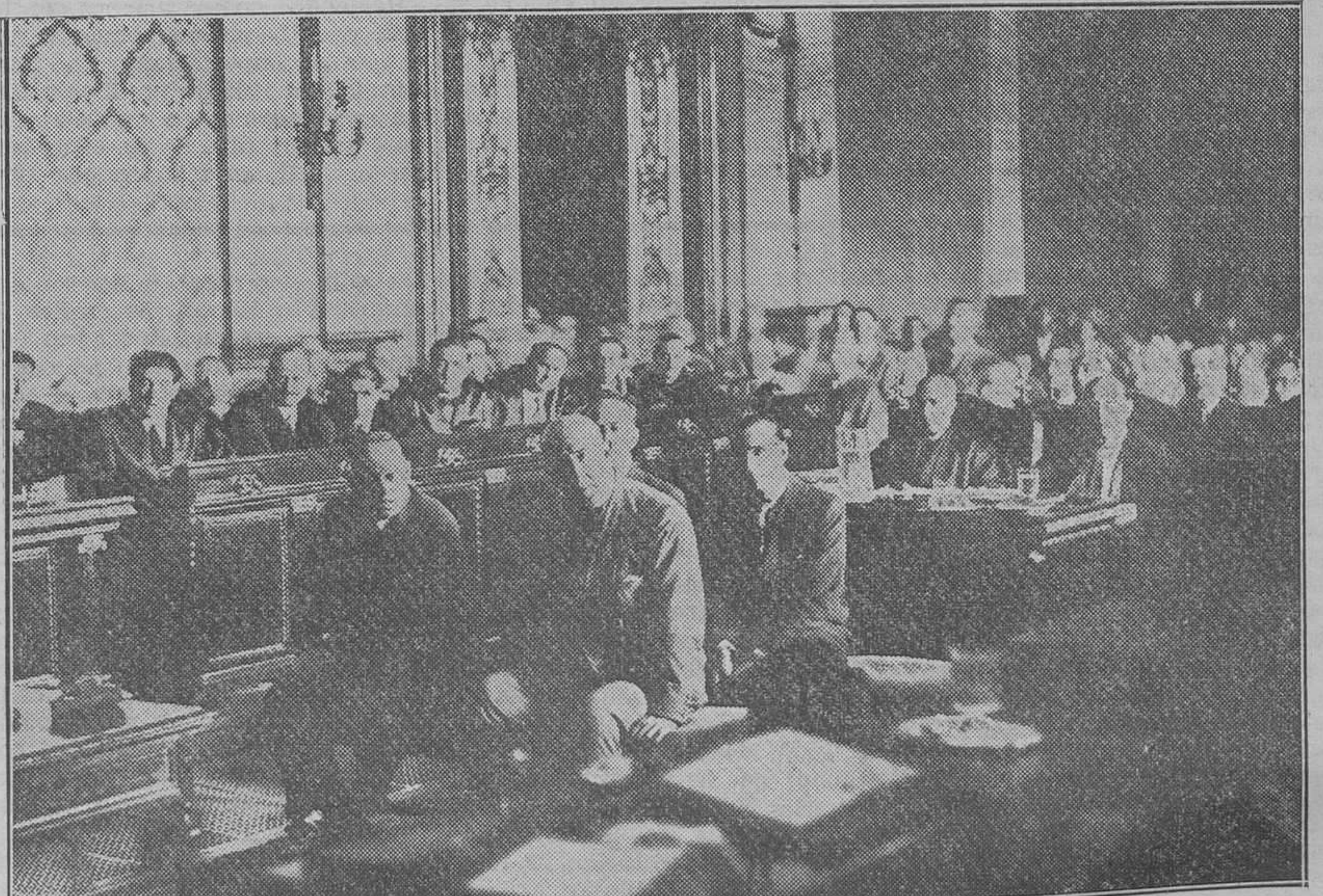
Los procesados por el complot de Sevilla, ocupando el banco de los acusados en el Consejo de guerra del miércoles

la la incoación del sumario y la detención incommunicada del teniente general don José Sanjurjo, éste prestó una segunda declaración, en la que dice que no habló ni trató con el general Cavalcanti ni con ningún jefe u oficial de la guarnición de Madrid ni otras plazas sobre el plan de rebelión, sin