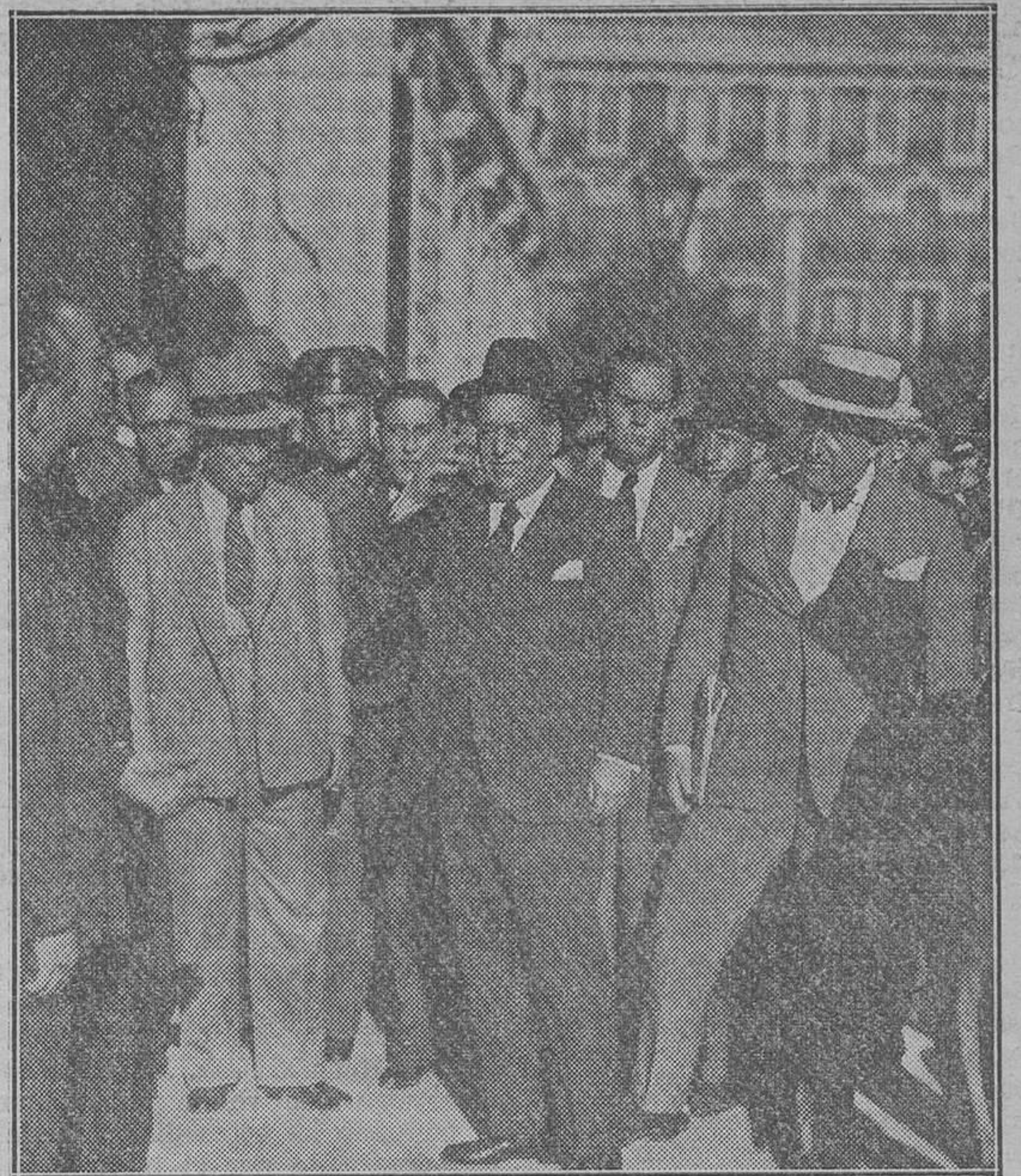
Los generales Sanjurjo y García de la Herranz, a su llegada al Palacio de Justicia

con el de Sevilla; y por lo último, preguntado si en alguna ocasión reclamó del Gobierno, del cual era funcionario público, reparación por las injurias a que alude al principio de su declaración, dijo que hará mes y medio protestó verbalmente ante el ministro de la Guerra de unas frases pronunciadas en un mitin de Avila por el ministro de Justicia y que estimó injuriosas para el Ejército, e igualmente en otra ocasión anterior que no puede precisar, reclamó ante el mismo señor ministro, y siendo director general de la Guardia civil, por injurias a este instituto, en cuyo cargo repetidas veces hizo análogas protestas. Después de acordada por la Sa-