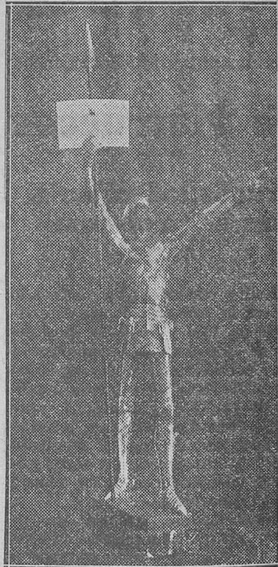
Premio concedido por el presidente de la República Española para el tema "Semblanza de Castelar", en el Certamen literario