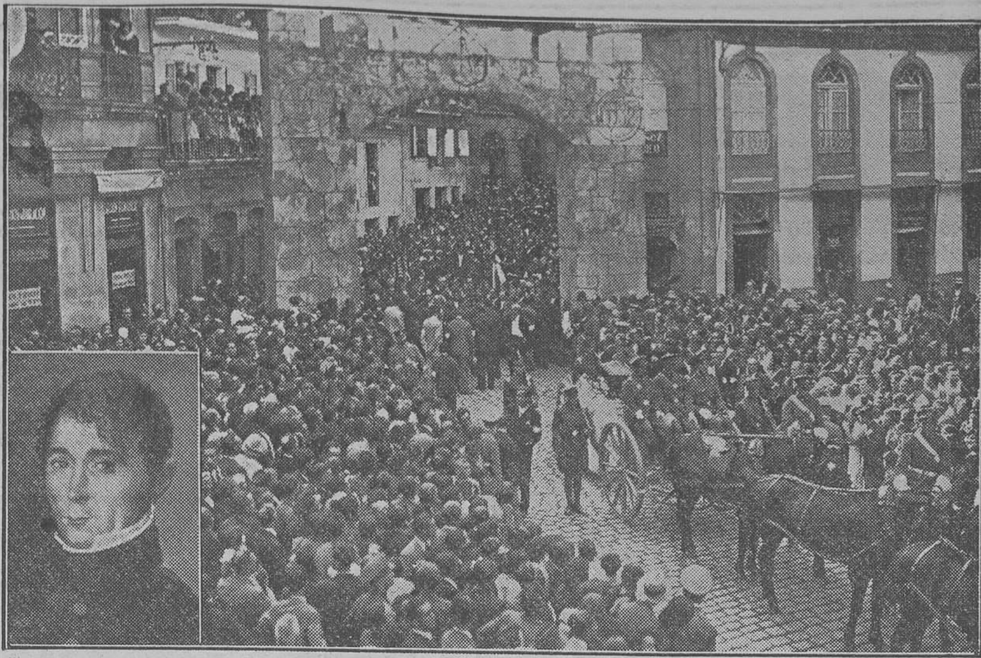
Vigo.—Los restos del coronel Cachamuiña, al pasar por debajo de la puerta de la Gamboa, sitio donde se dió el hecho histórico de la Reconquista de Vigo en el año 1809

Y, en efecto, poco tiempo después he aquí que Gonfle, la ciudad de Clemencia, tuvo el buen acuerdo de erigir un monumento