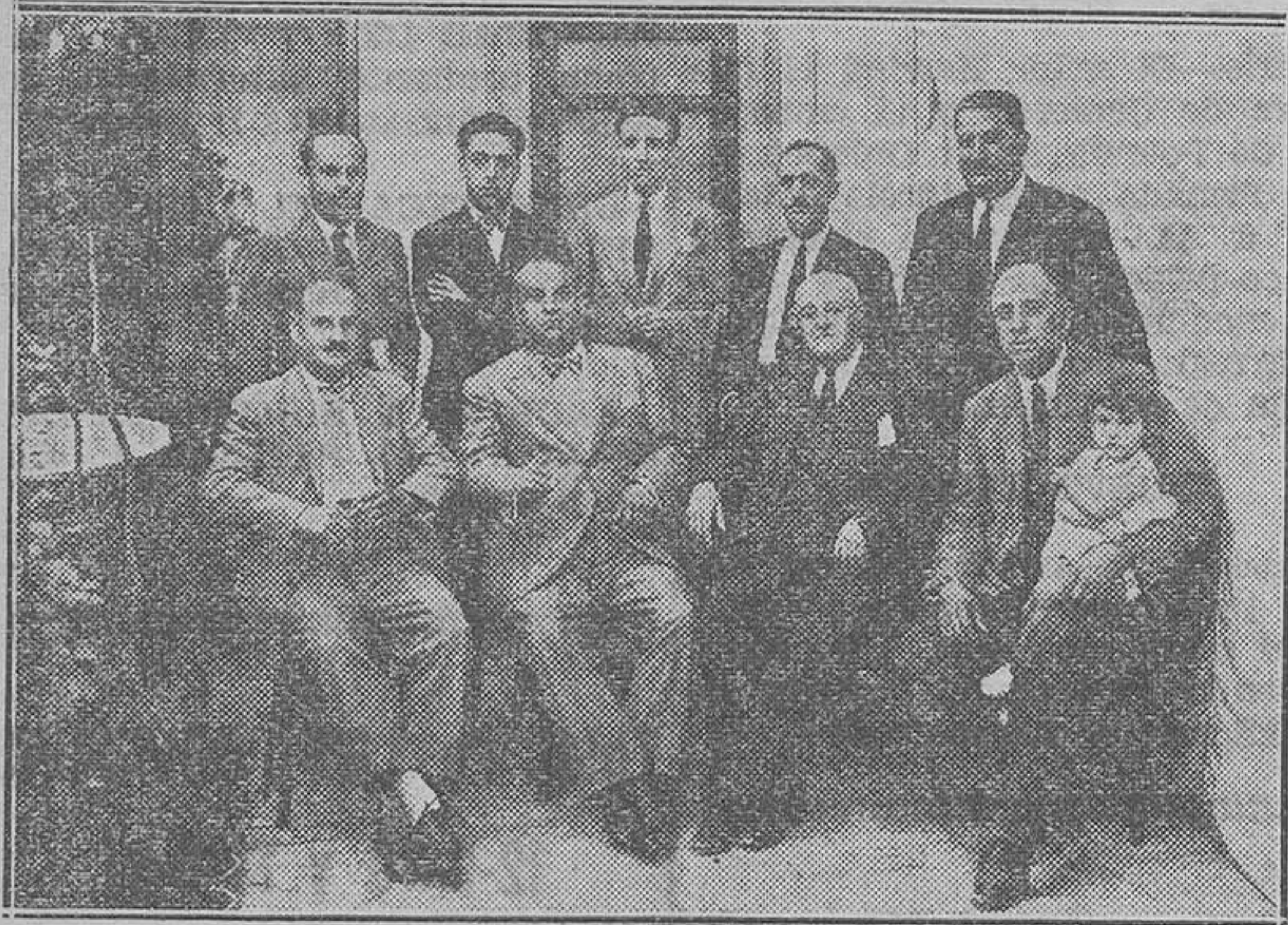
Comisión ejecutiva del monumento de Elda a Castelar

por un deber ineludible, cumple su firme propósito de erigir la estatua al gran orador y con motivo de una sesión general celebrada por la sociedad de casas "El Progreso" en el mes de Mayo de 1926 y en un ambiente de entusiasmo patriótico, quedó constituida la Comisión Ejecutiva para la erección del Monumento a Castelar, por los señores siguientes: