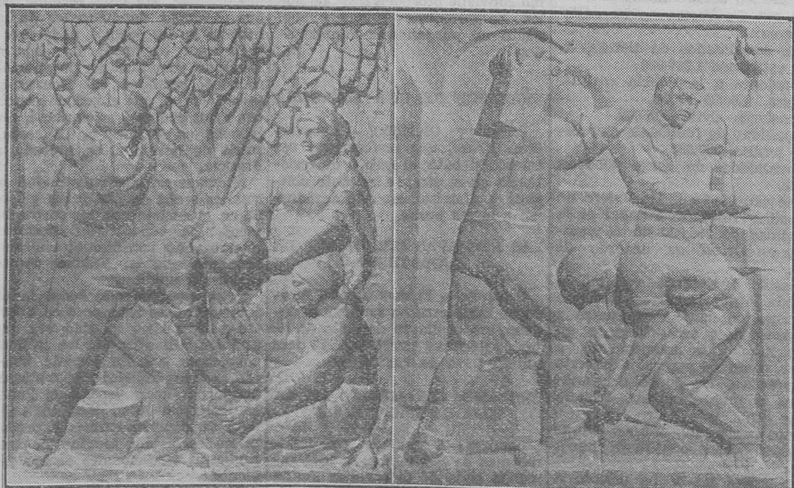
Dos bajos relieves del monumento

Los primeros trabajos encaminados por la comisión, fueron la colocación de una artística lápida de bronce en alto relieve, obra del notable artista de Alicante señor Bañuls, en la fachada de la casa que habitó el gran tribuno, cuyo acto fué llevado a cabo con la