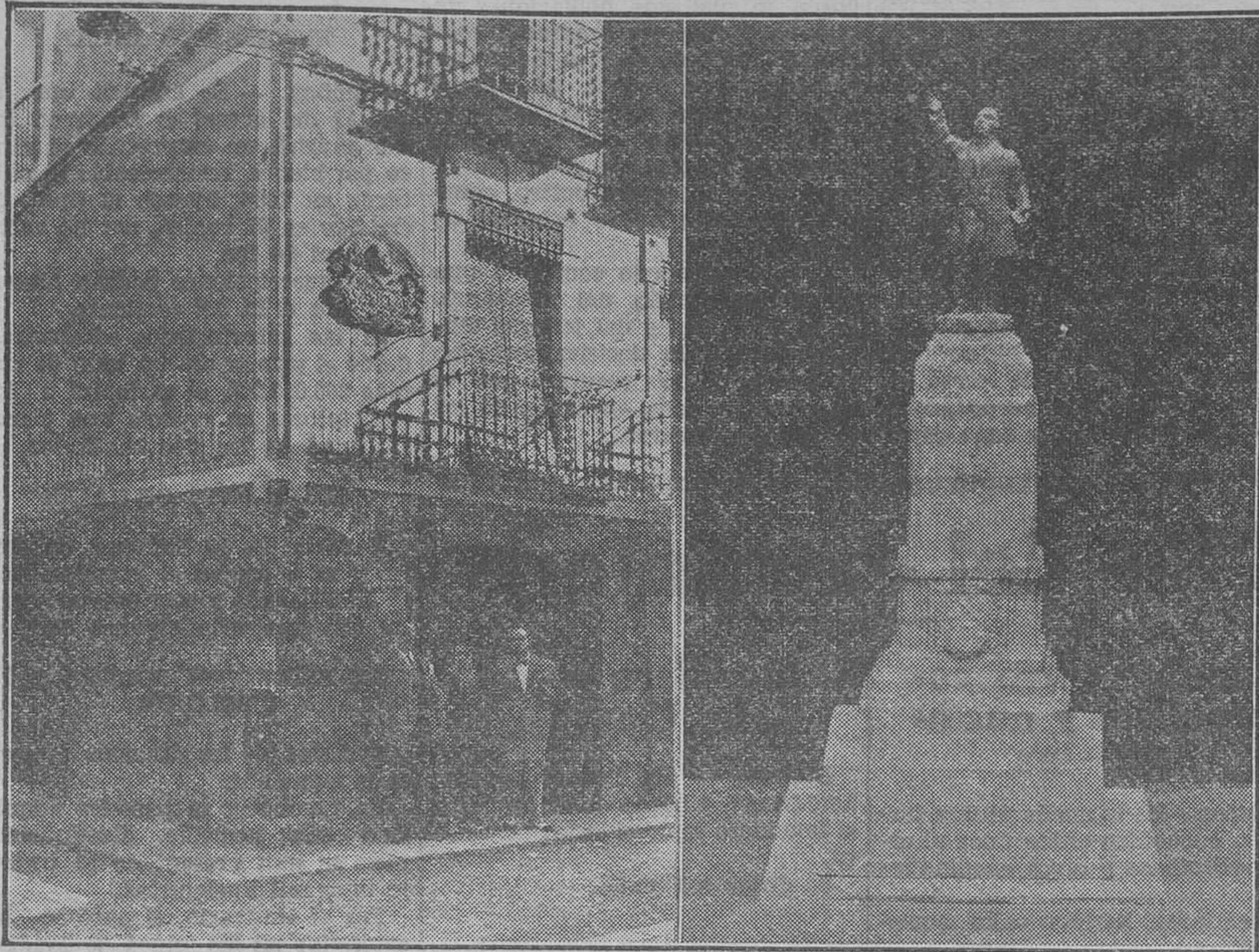
Casa que habitó en su infancia don Emilio Castelar y que ostenta la lápida conmemorativa.— Monumento a Castelar

Tiene de altura 9 metros y la estatua 2'50 metros. En el frente está el escudo de Elda y a conti-