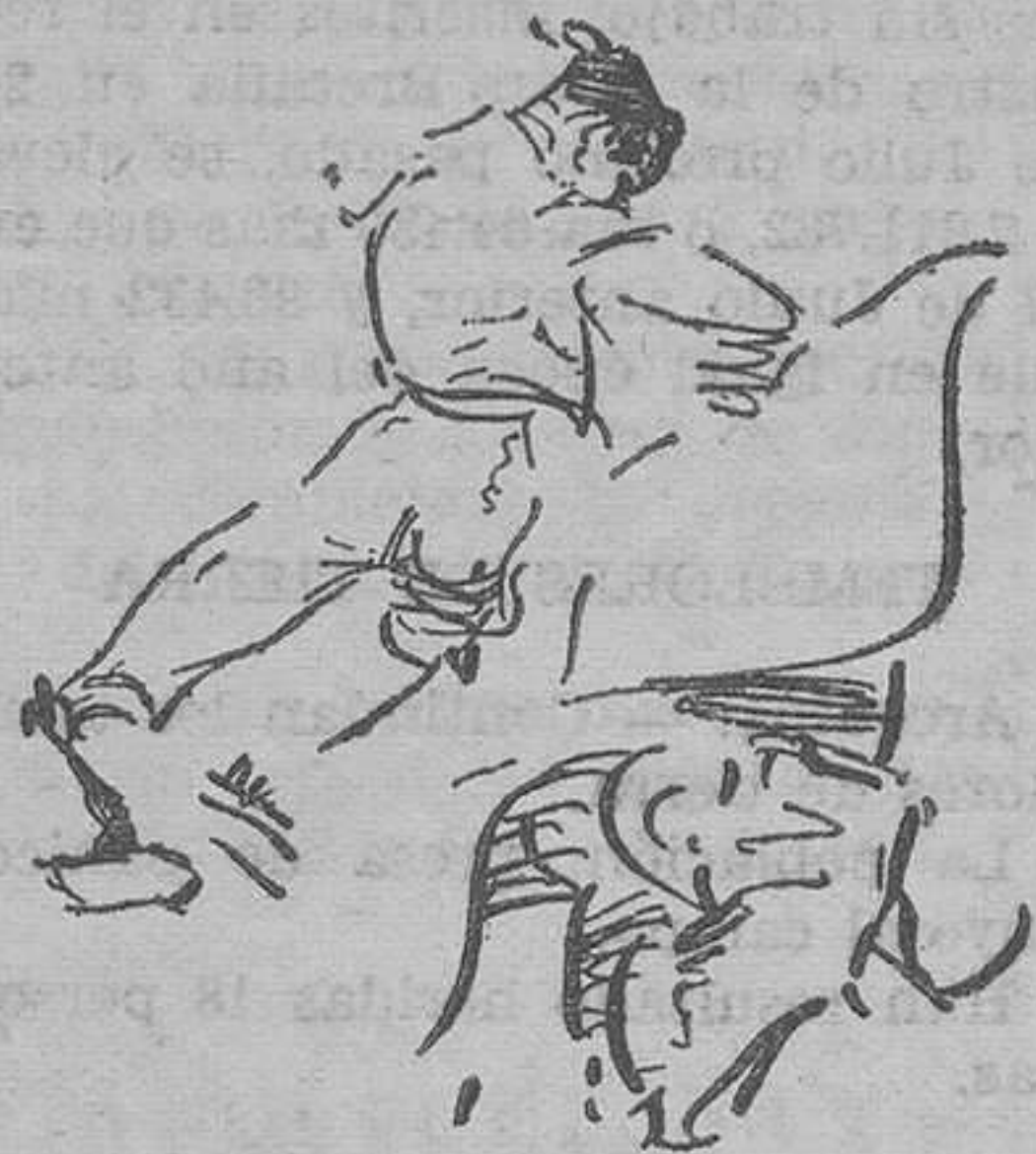
Una faena de Joselito

Otras dos figuras cumbres del torero. Ha sido una lástima que Ruano, al confeccionar su Album no hubiese guardado un or-