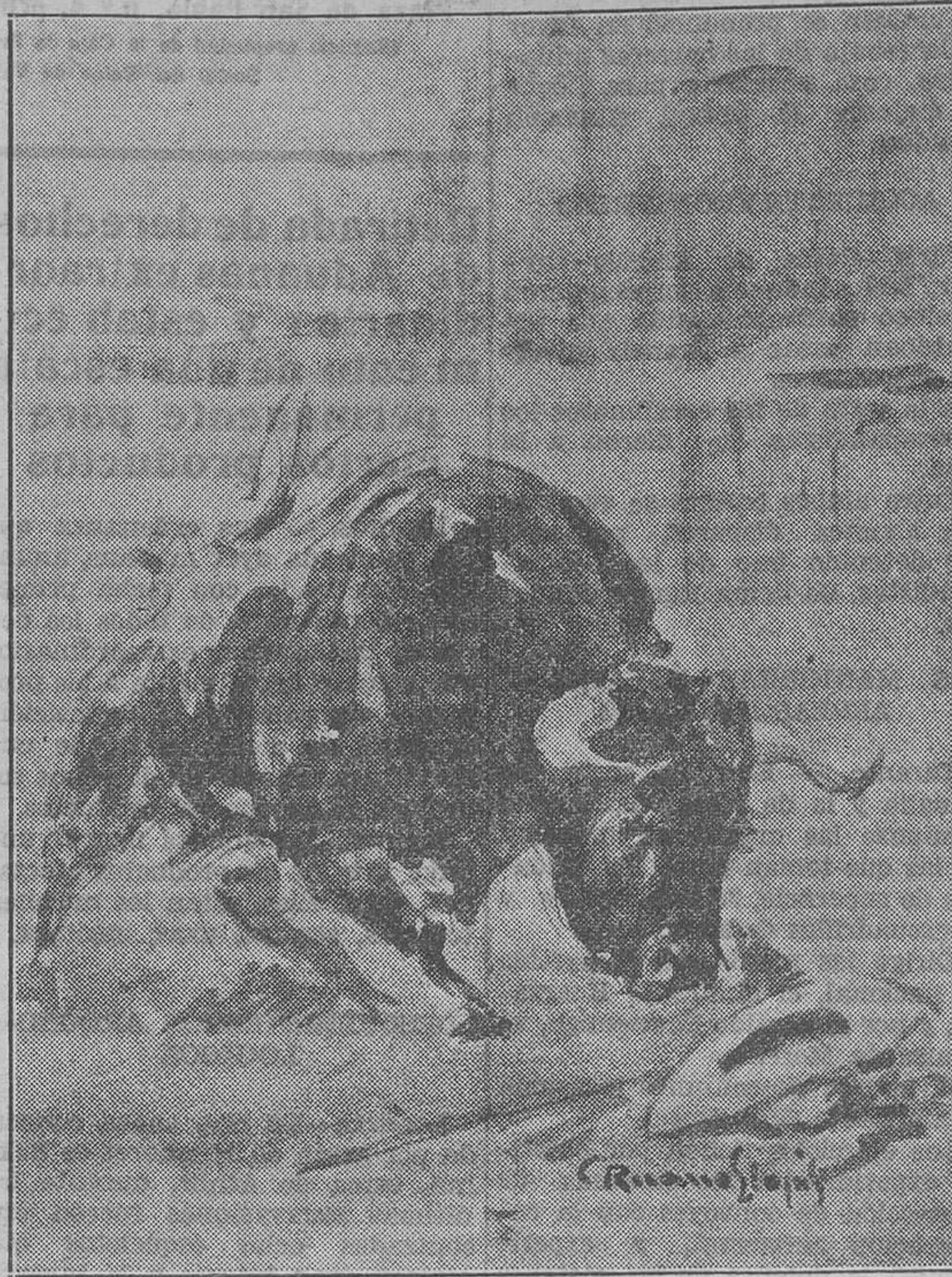
Una de las aguadas del Album

Otro astro de la torería, aunque astro muy fugaz, por arrancarlo