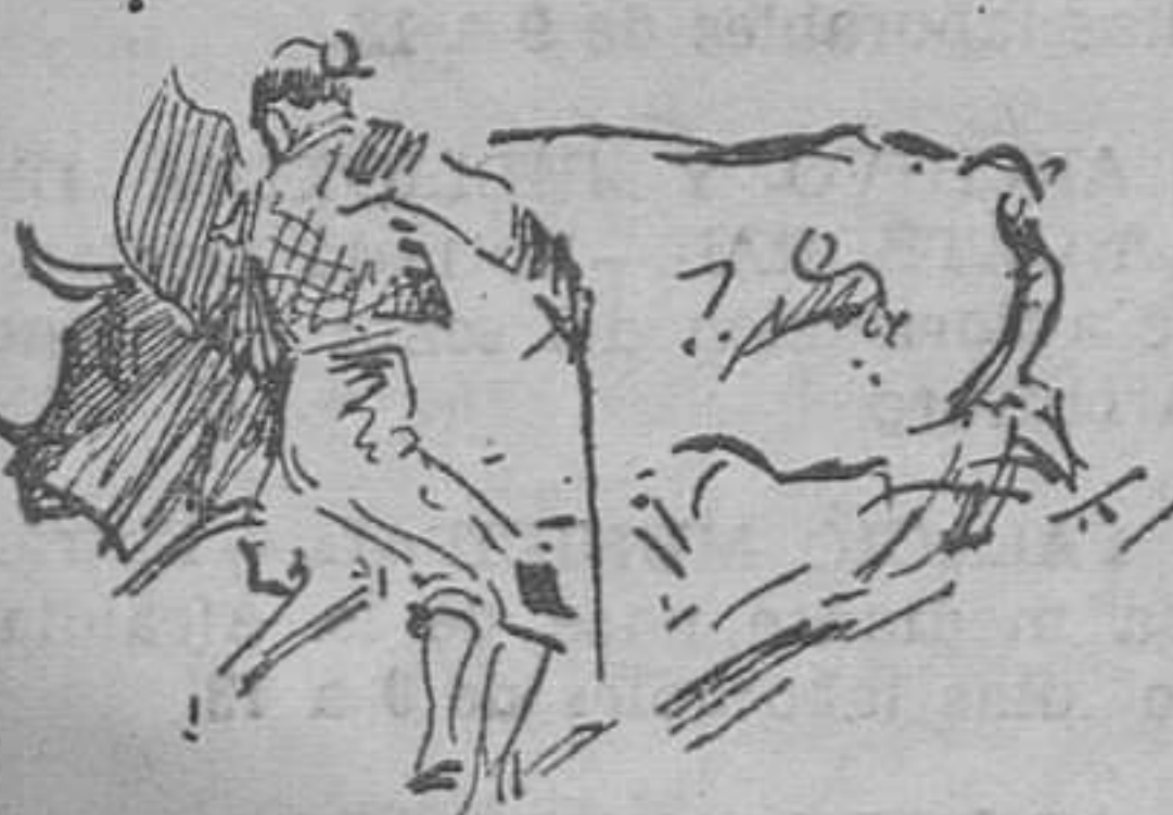
El Gallo cuando indignaba a la afición

Ruano ha cogido los dos momentos del diestro, y en su libro quedan, como documentos históricos. El lápiz del artista no ha podido estar más feliz; en los quinientos dibujos que reflejan su vida torera, se admira la gallardía del diestro en alguna de sus soberbias faenas, y en otros el matador, vencido por la lera, medroso y hecho cisco, entre almohadillas y otros proyectiles más contundentes que ruedan por la arena.