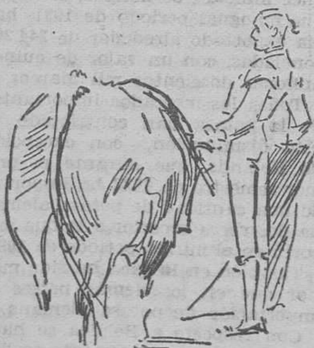
La gallardía de Granero

prematuramente un toro del mundo de los vivos. Granero, ocioso nos parece decir que era valenciano, a las pocas corridas se reveló como un gran lidiador, pues casi de un salto se pasó de atrevido mozalbete en las capeas de los pueblos a matador de reses bravas. Y aquel rápido encumbramiento no era debido al momentáneo capricho de un público, ni a la casualidad de una tarde afortunada, no. Granero llevaba dentro un alma torera, y por eso triunfó. De no haber tenido la desgracia en la plaza de Toros de Madrid, que le costó la vida, hubiera proseguido las glorias de Joselito, de quien se le consideraba heredero, por la similitud de su torero. En Septiembre de 1920 tomaba la alternativa en Sevilla de manos del Gallo. Al año siguiente firmaba 117 corridas, y aquel mismo año, al hacer su presentación en Madrid, después de una serie inacabable de triunfos, en 7 de Mayo, alternando con La Rosa y Lalanda, era cogido por el