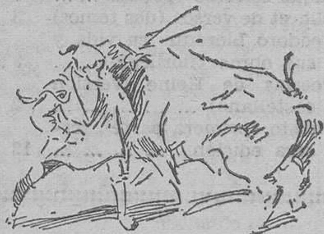
Una brava faena de Belmonte

La figura de Juan Belmonte, con su torero temerario, da un nuevo empuje a la fiesta nacional. El to-