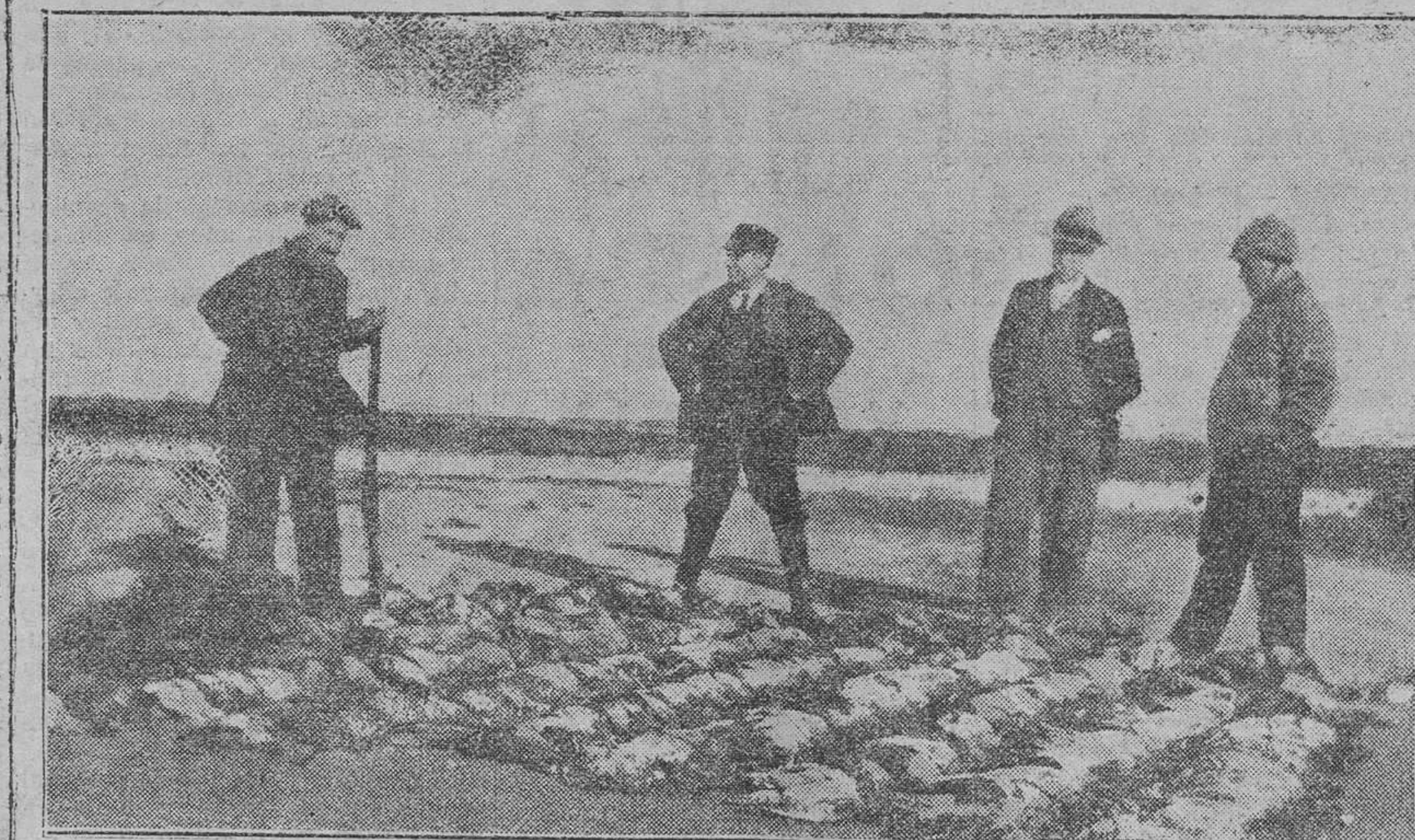
El botín recogido después de una tirada

Considero, lector aficionado a la caza de palmpedras y otras aves, empresa más que difícil la de escribir crónicas y artículos versando sobre este sport, que puedan enseñar algo nuevo en el arte cinegético, y os sean tan amenos como los que en estas mismas columnas se publicaban y eran escritos por el culto aficionado y estilista en esta clase de literatura, Pepe Epila (que en paz descanse). Yo, por complacencia, y no por afición a literatura cinegética ni a otra clase de literatura, pues reconozco lo hago tan mal como cazador soy, me he tomado un trabajo que espero me perdonarás, querido lector, si no consigo deleitarle con mis crónicas como le recreaban las escritas por el desaparecido maestro. Las tiradas, en la presente temporada, se están sucediendo con monótona igualdad que en anteriores años; salvo contados aficionados, y os sean tan amenos como los que en estas mismas columnas se publicaban y eran escritos por el culto aficionado y estilista en esta clase de literatura, Pepe Epila (que en paz descanse). Yo, por complacencia, y no por afición a literatura cinegética ni a otra clase de literatura, pues reconozco lo hago tan mal como cazador soy, me he tomado un trabajo que espero me perdonarás, querido lector, si no consigo deleitarle con mis crónicas como le recreaban las escritas por el desaparecido maestro.