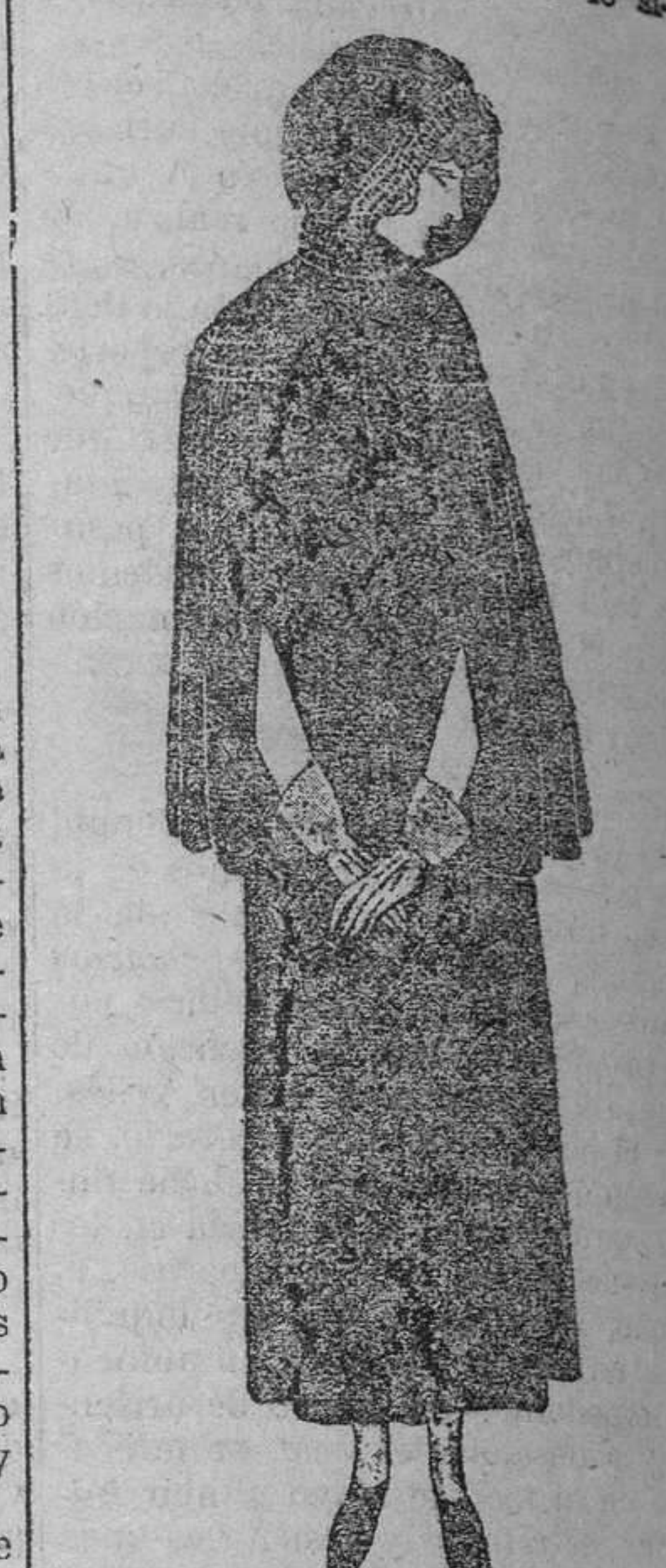
Impermeable en crepón de China, impermeabilizado, negro o azul, acompañado de capuchón y capilla, adornados de frunces.

solver sin la debida meditación y estudio. Hasta que ese momento llegue, solo puede anticiparla lo si-