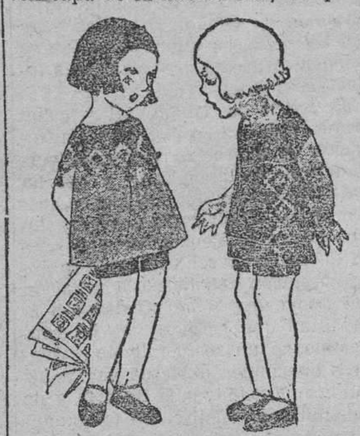
Bob lleva pantaloncitos azules y blusa roja escarlata, con un gran cuello bordado azul marino y rojo. Tito, en cambio, va vestido de terciopelo verde esmeralda, con motivos bordados en seda azul y verde oscuro.

capadas pueden ser un vestido de «jersatchine» rubí, negro y marino con capa de la misma tela, comple-