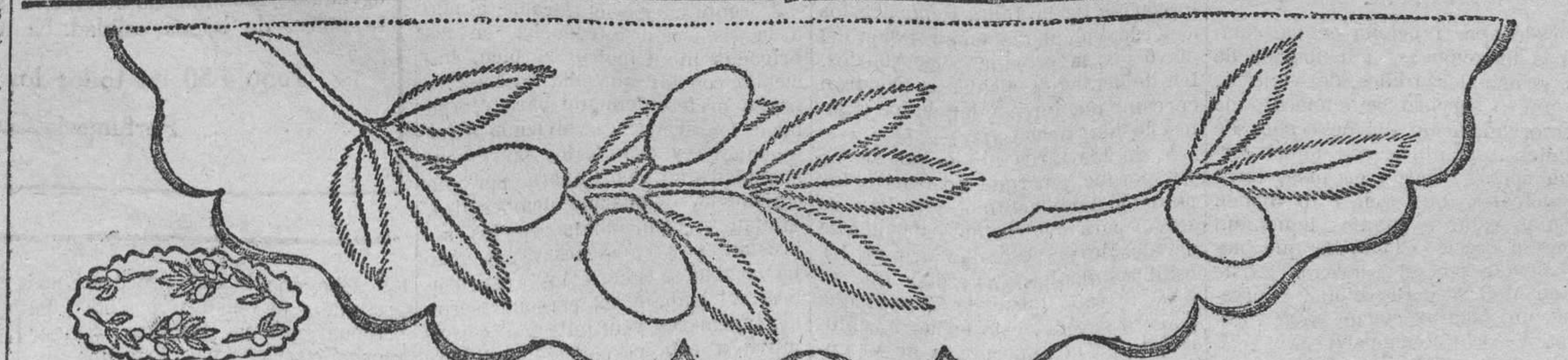
DIBUJO para tapetito, cubre-banegas, etcétera. Las aceitunas se bordan en seda verde oscuro y las hojas en verde más claro. El festón del borde puede ser o blanco, o verde, igualmente

No es posible, señorita, contestar brevemente a su consulta; plantea un problema que no se puede re-