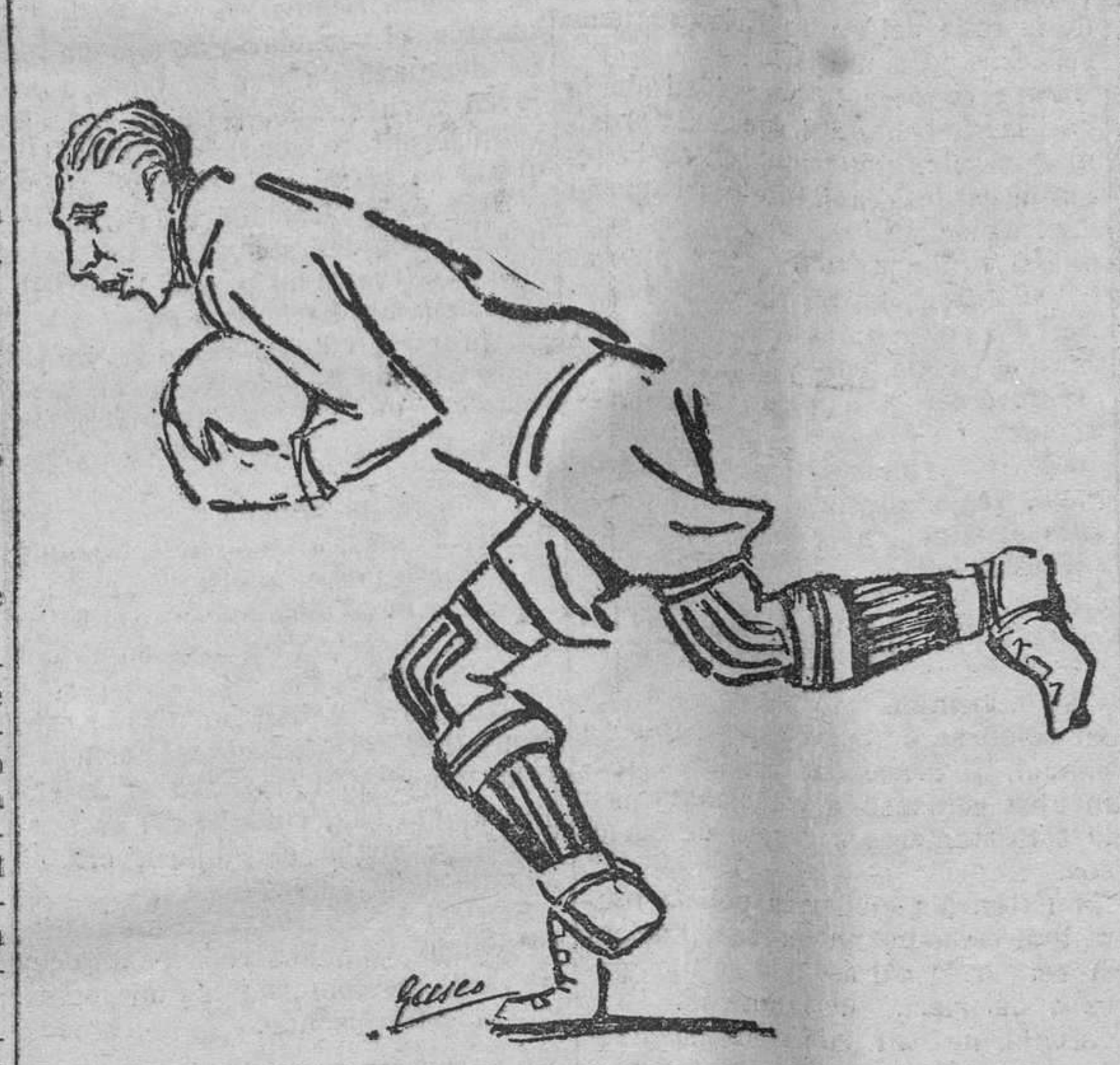
Zamora en la única parada de la tarde