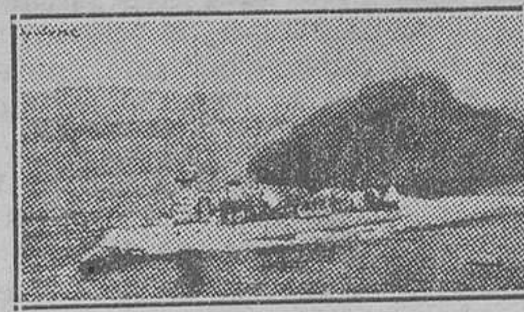
Uno de los primitivos torpederos franceses

Francia, en cuanto a torpederos, todavía conserva en servicio algu-