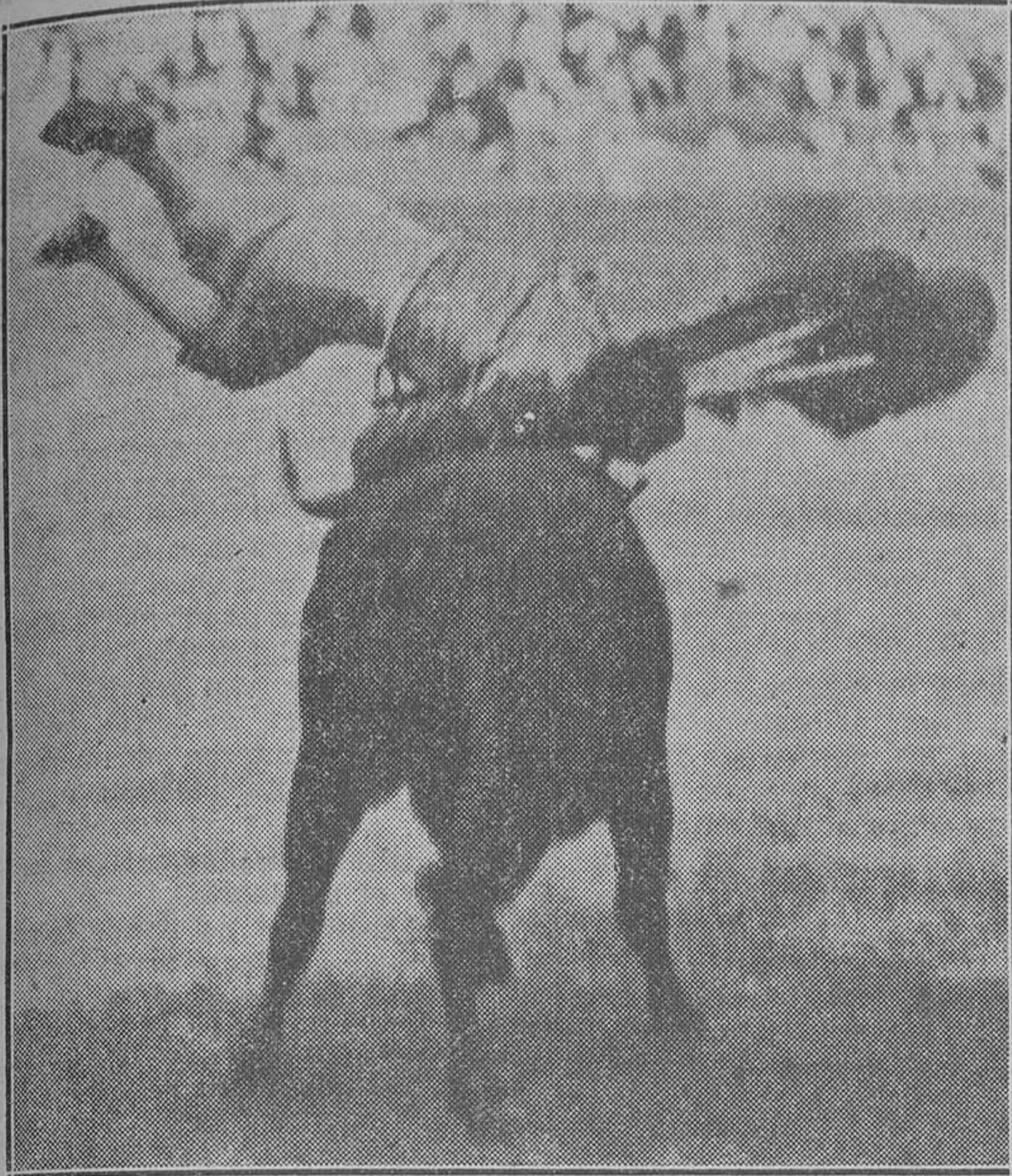
Cogida de Varelito II

la soltura con la muleta, el garbo, la simpatía... y sobre todo lo estupidamente que explicó el toreo de capa en un quite al quinto toro. Dos verónicas y media que valieron, ellas solas, por todo lo que había explicado el muchacho durante toda la tarde. En conjunto... aprobado. Sabe torear y eso ha de reconocersele. Pero para otro examen habrá de traer mejor aprendida la lección que hace referencia al manejo el estoque. De lo contrario, "malorum causa".