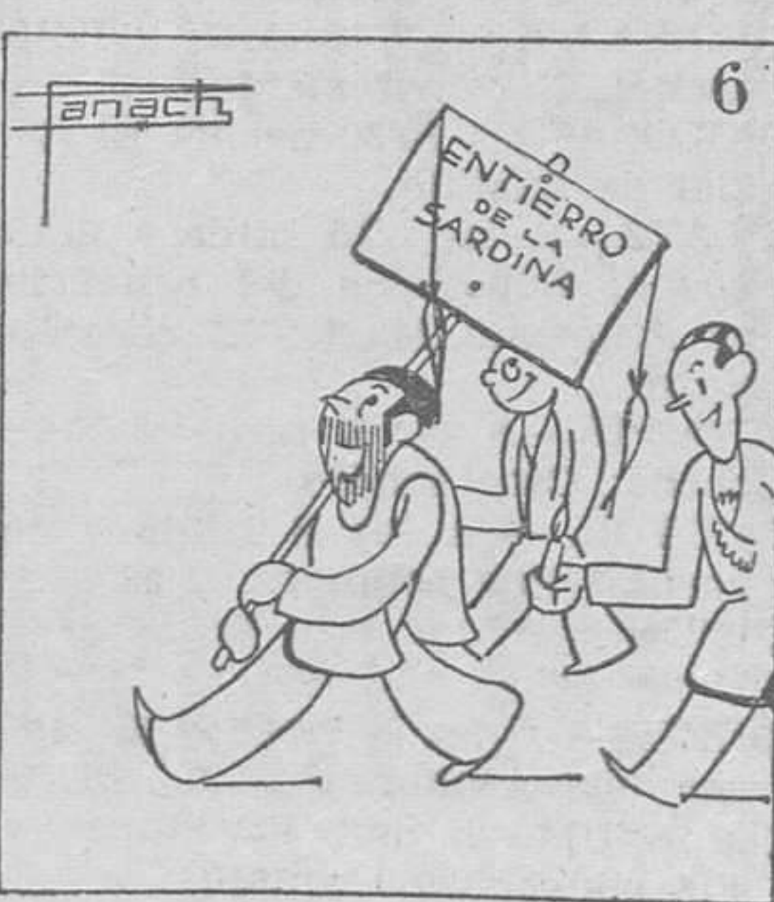
Y apenas Pascua termina, entierran a la sardina. (Texto y monos de Panach.)