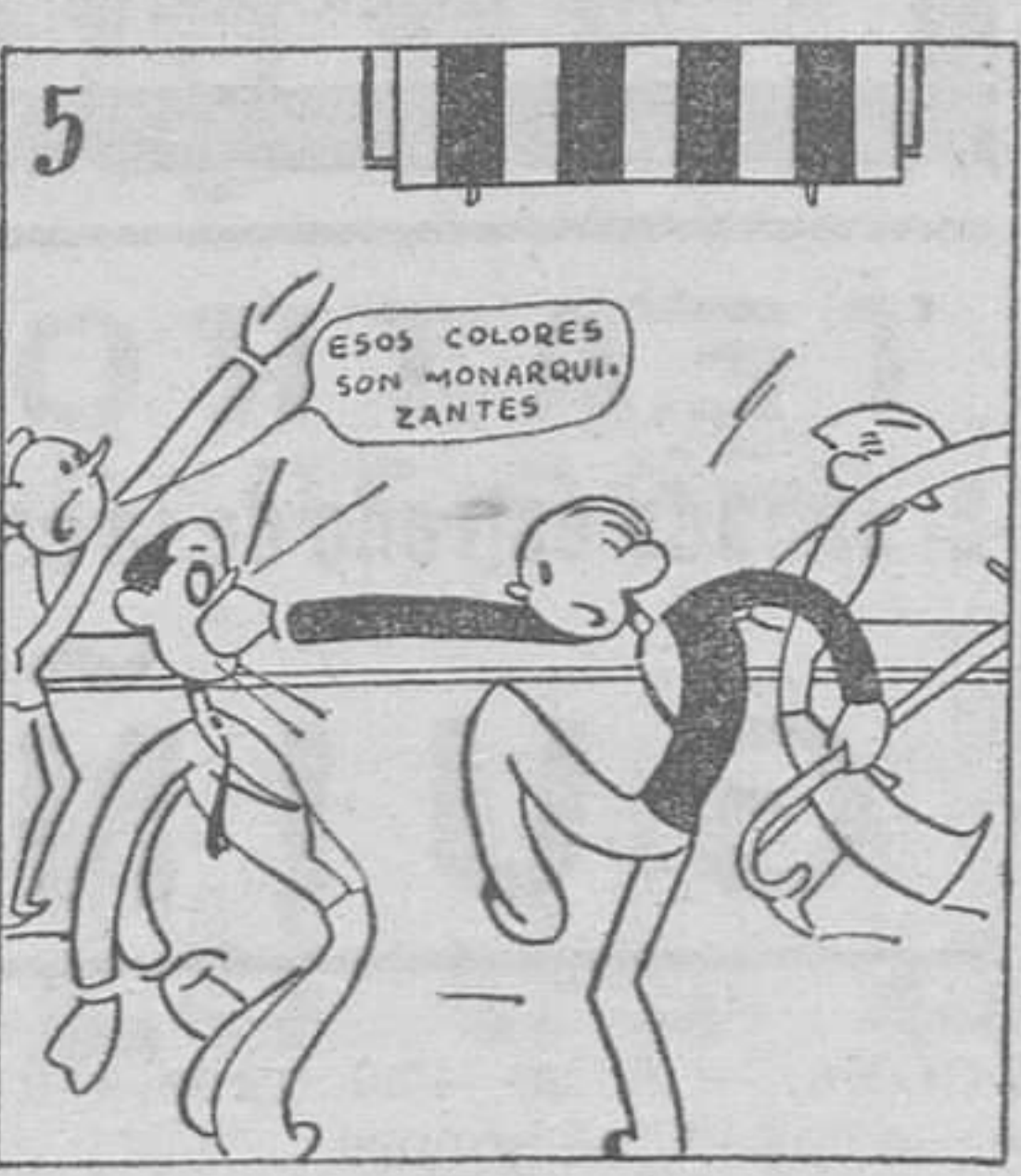
Armó la gran pelotera en Madrid, nuestra Señera.