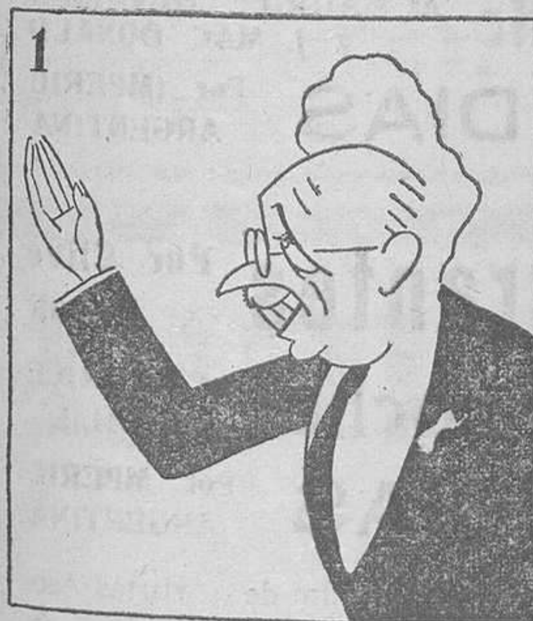
De manera lisa y llana, prolongan la Castellana.