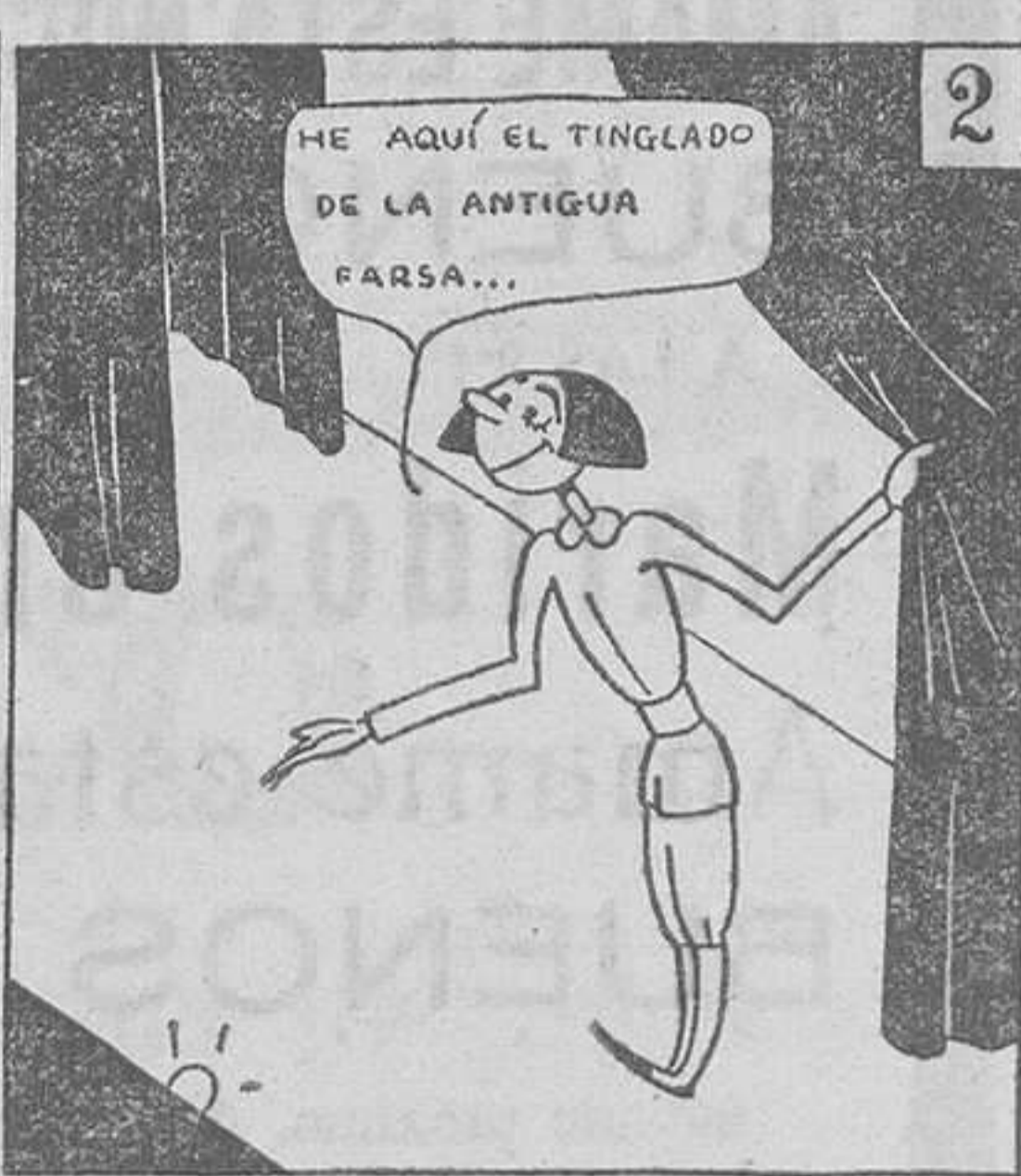
Tras una breve parada, comienza la temporada.