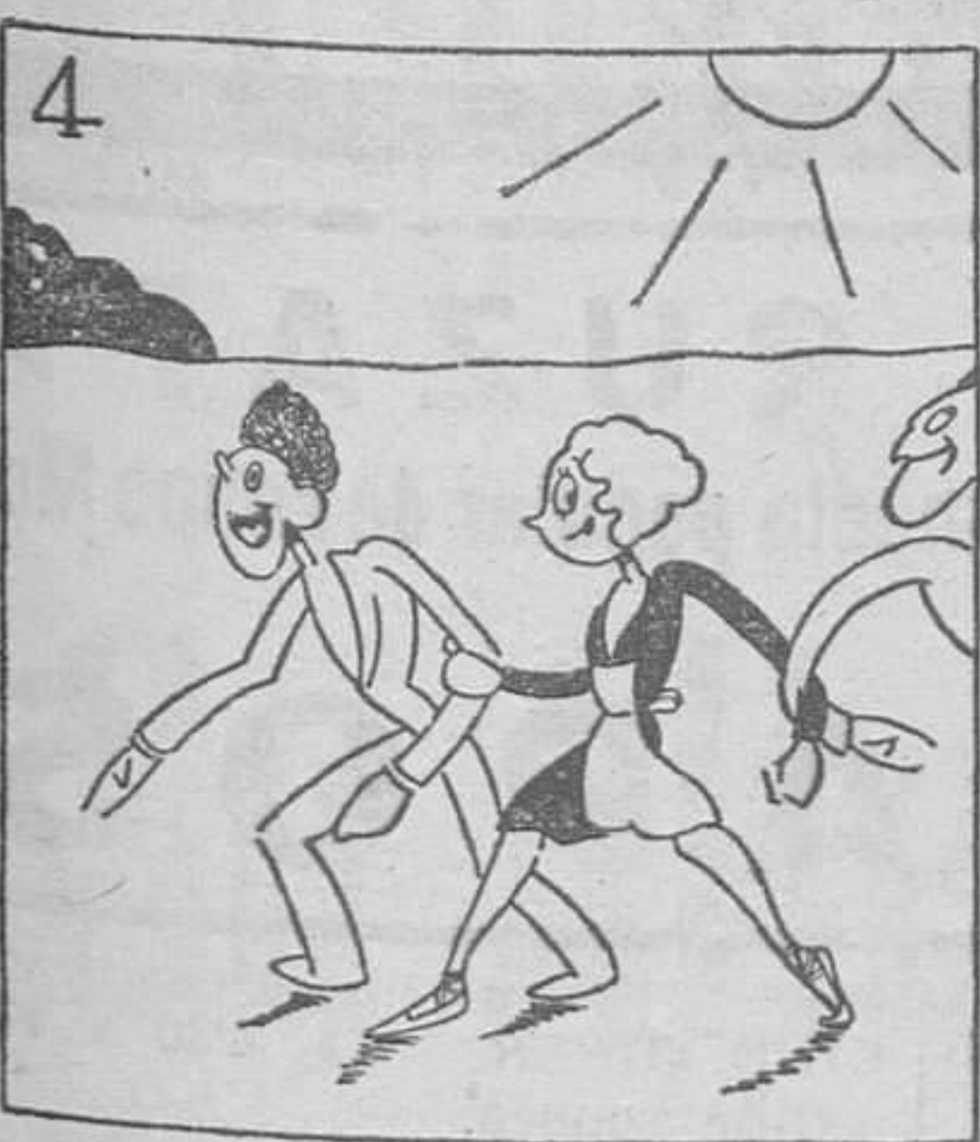
Y con un sol como un ascua, terminó el martes la Pascua.