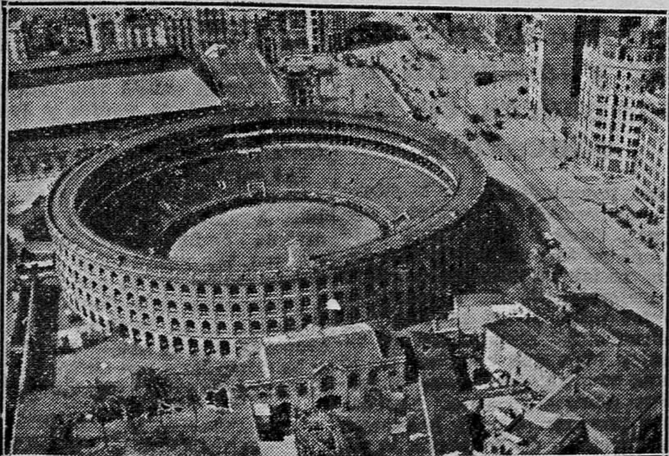
La plaza de Toros, vista desde el avión

—No me extraña que siendo aviador "ascienda" de prisa.