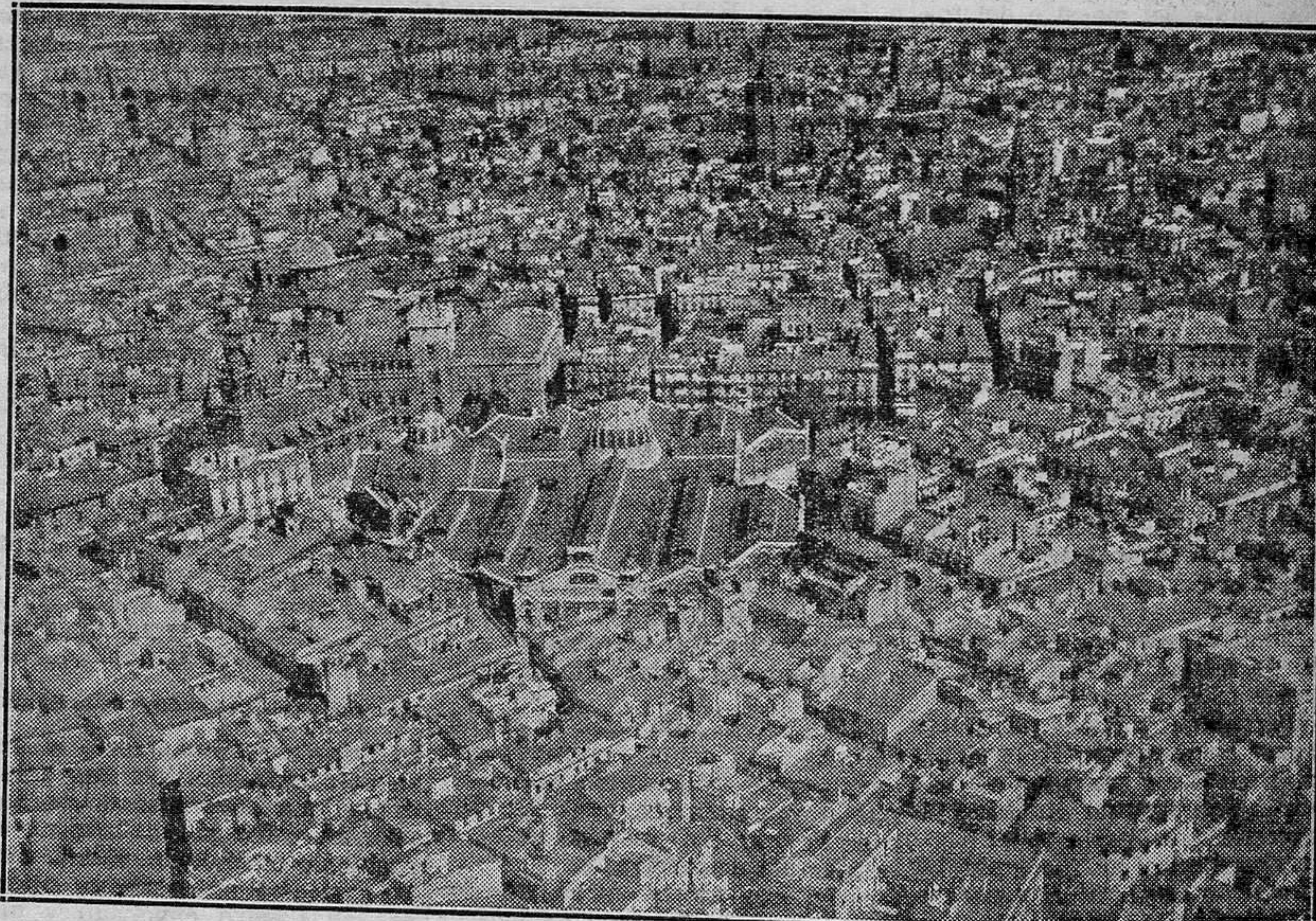
La importancia y grandiosidad de nuestra capital puede apreciarse fácilmente desde un avión

o cinco "ojos de buey", "hablando en plata", se remonta el neófito.