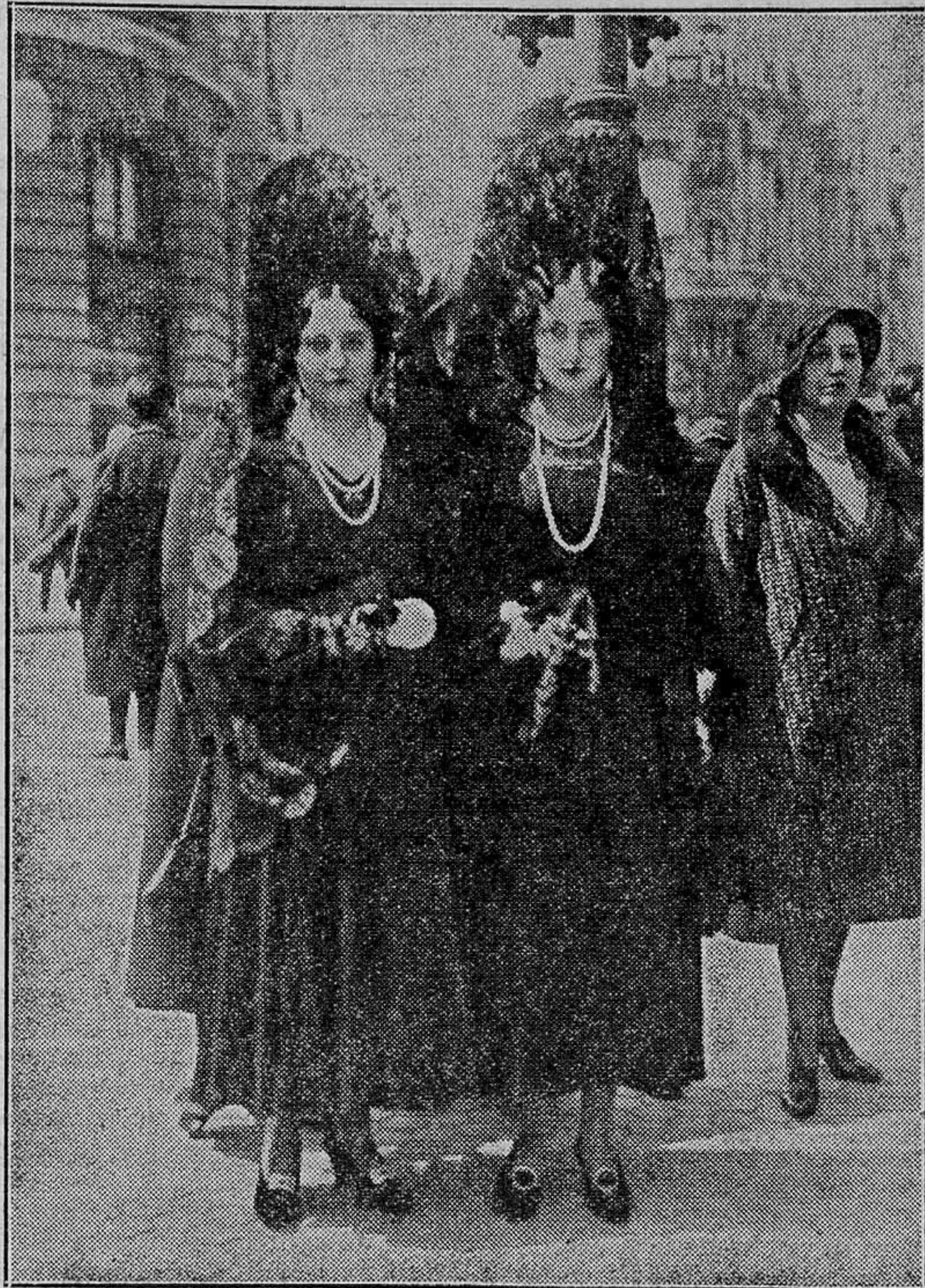
Saliendo de visitar Sagrarios