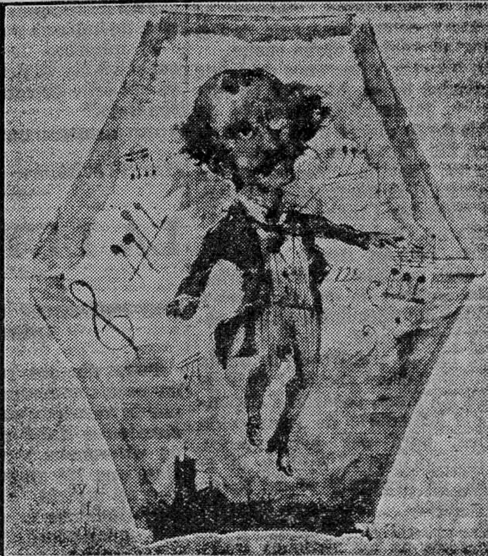
Cometa de Pascua, pintado por el insigne don José Benlliure.—También el inmortal Sorolla dejó alguna obra de su arte, como ésta, en la jocosa levedad del valencianísimo "cachirulo". (Fots. Barberá Mastp.)

misa, o con la chaqueta al hombro y alpargatas.