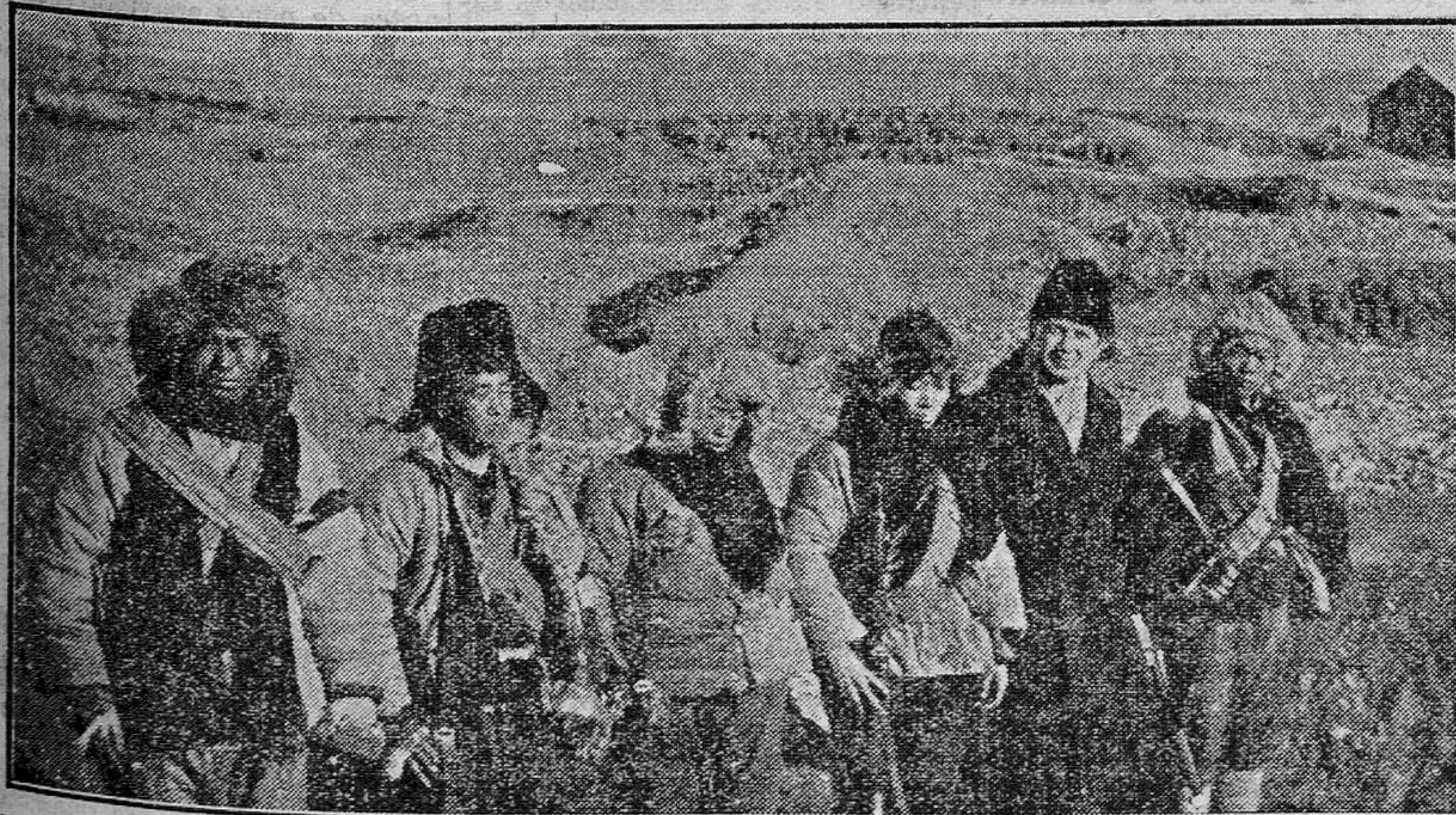
Una trinchera en Harbin, en donde hubo muchas bajas por ambas partes contendientes. La fotografía muestra un grupo de soldados chinos que derribaron un aeroplano que bombardeaba aquellos sitios. Los tripulantes de la nave aérea perecieron