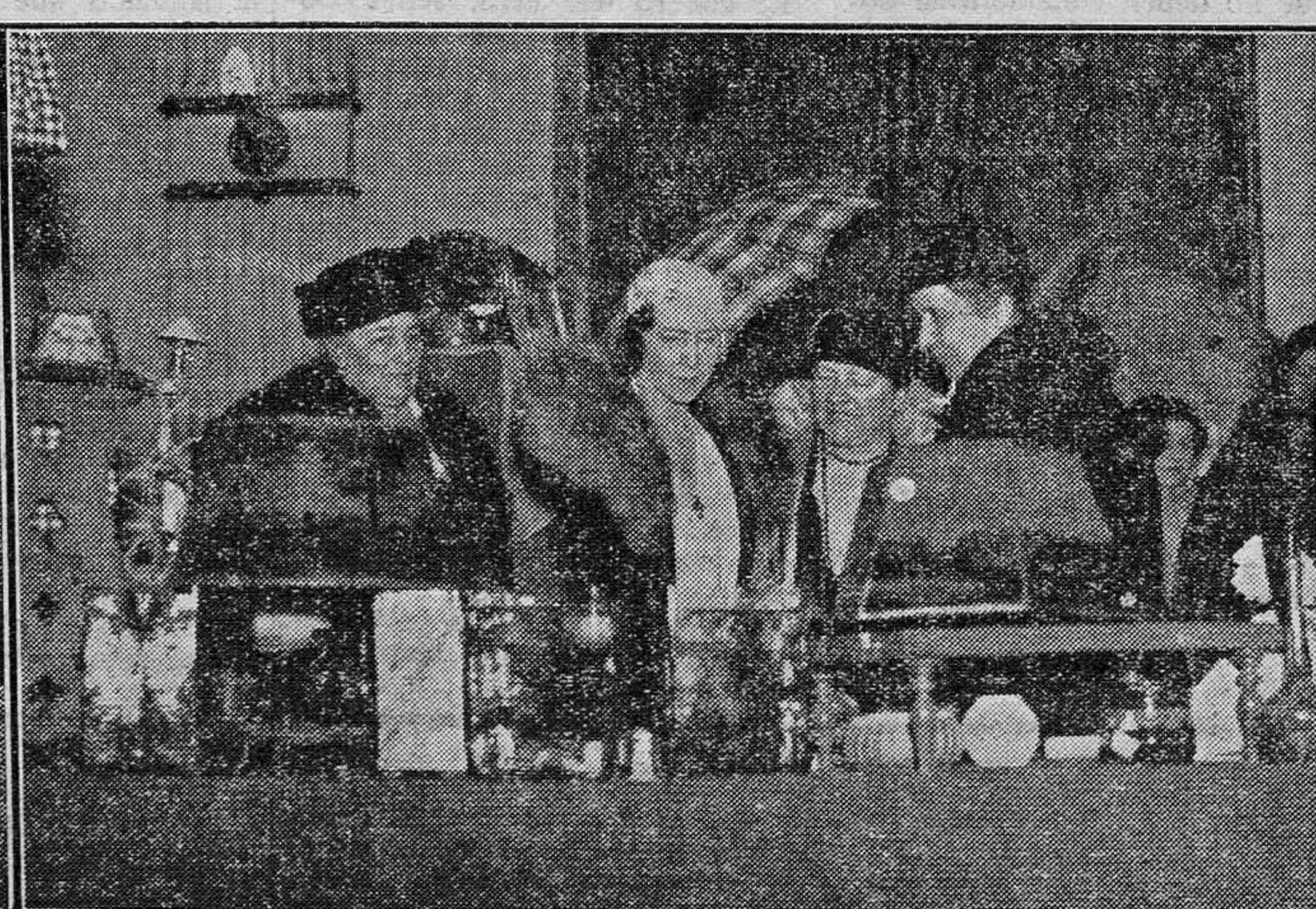
En Tarragona se ha derrumbado un trozo de la muralla romana.—La Reina Isabel de Bélgica visitando la Grande Fancy-Fair