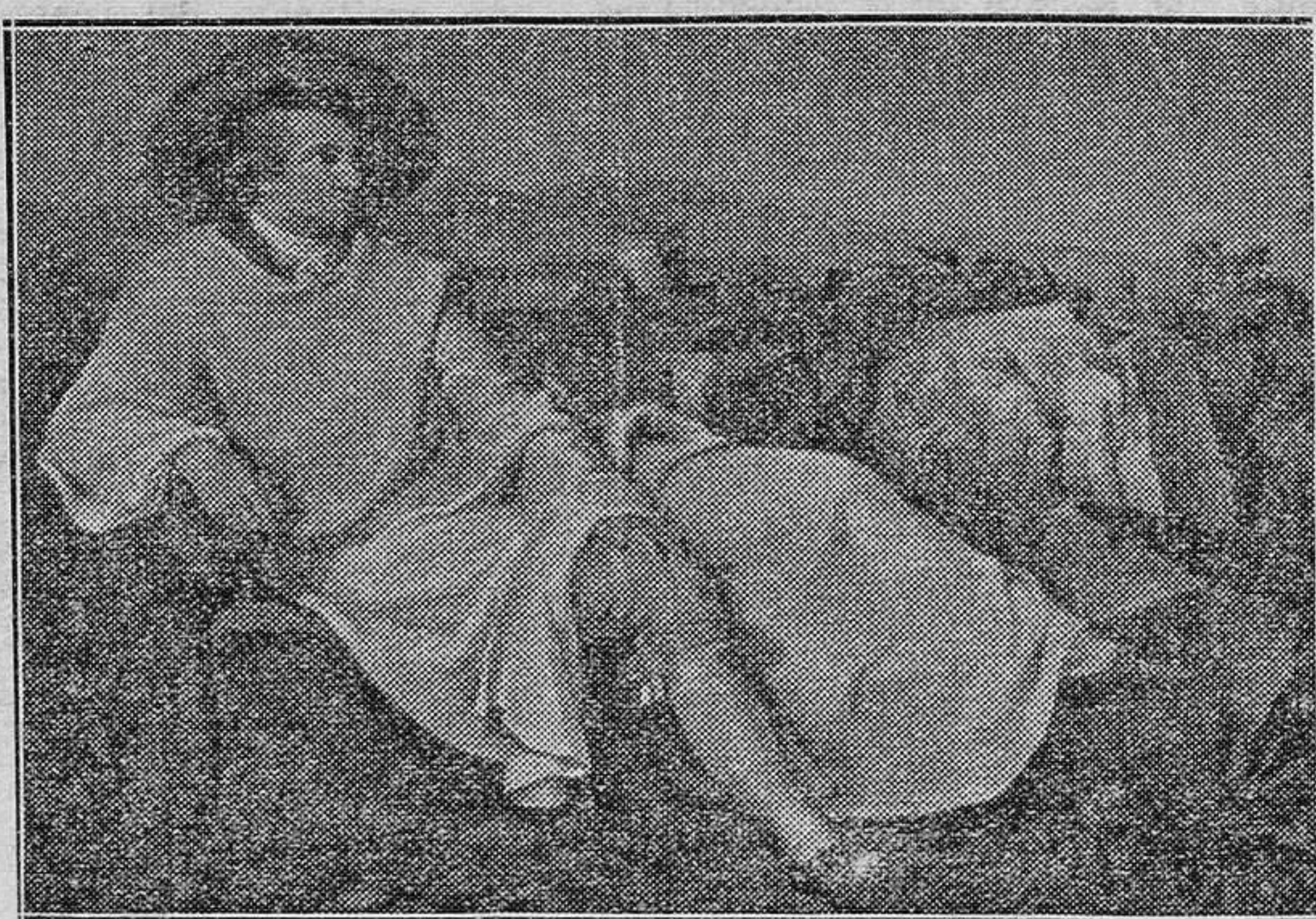
Otro retrato de Goethe

—¿...? —La segunda parte del "Fausto" no produjo tanta impresión como la primera, ni se ha hecho popular como aquélla. El juicio de la crítica sobre ella ha sido muy diverso. Unos la ensalzaron como la epopeya de nuestro siglo; otros vieron confirmada en ella la máxima española que condena las segundas partes a irremisible inferioridad. ¿Por qué no traduje esta segunda parte? Porque su traducción parecióme mucho más dificultosa y mucho menos agradable, y no era cosa de emprender