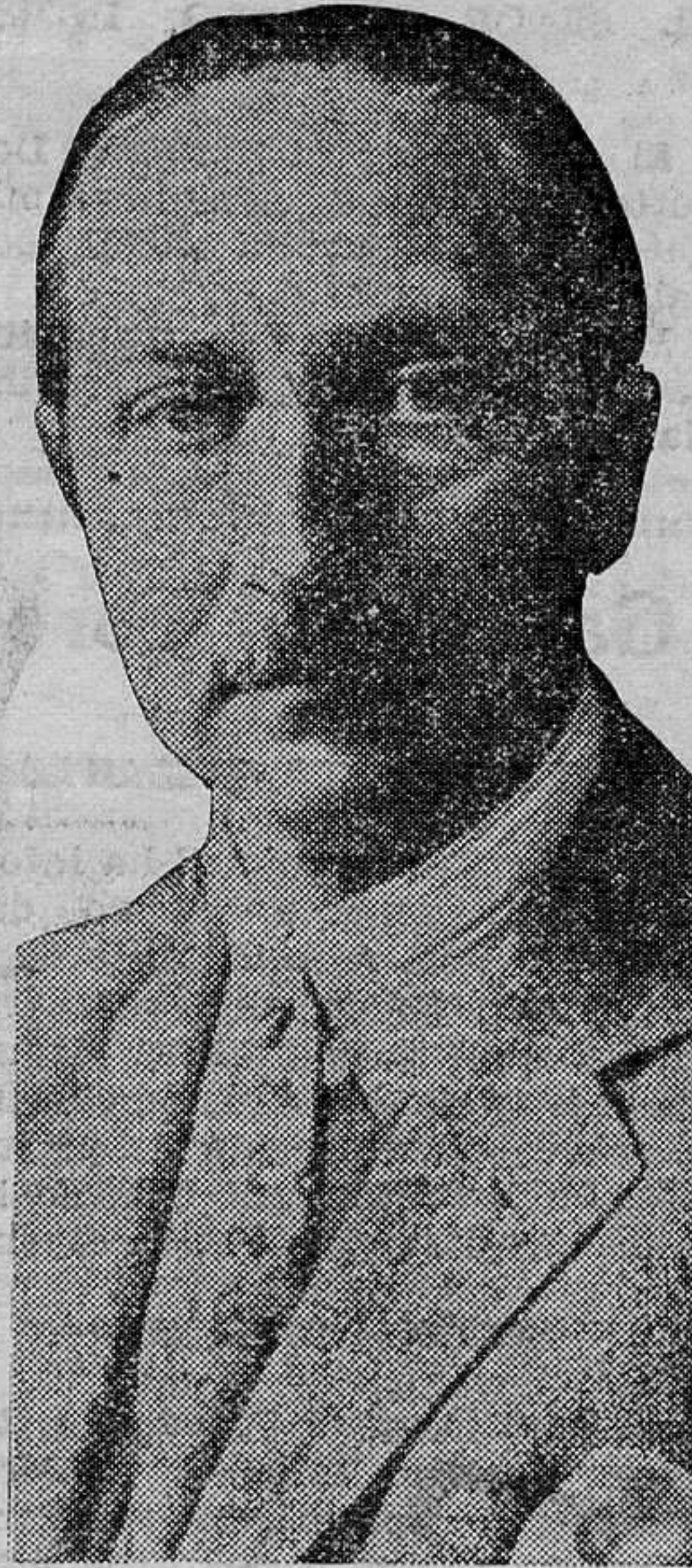
El Príncipe Oscar, de Prusia, quinto hijo de Guillermo II, que probablemente se presentará como candidato para la elección presidencial de Alemania, frente al mariscal Hindenburg

Ya va siendo un tópico muy desacreditado de nuestros revolucionarios ese de la incultura de antaño y de la imperiosa necesidad de crear por todas partes escuelas y centros, como únicos medios de llevar fecundidad al país. No está mal que se procure por todos los medios desterrar del país la incultura, y que se creen escuelas y más que escuelas, maestros; y que en dichas escuelas no se olvide el problema de las lenguas regionales, aunque trine nuestro simpático y querido amigo Royo y Vilanova. Pero a la vez que los gobernantes se preocupan de estos asuntos de cultura, no han de olvidar otro que consideramos primordial: el de la despensa. Rebanar las pocas pesetas que le van quedando al país para crear centros, como esos que está inventando don Fernando de los Ríos de Escuela Polilingüe, Centro de Estudios Económicos, con relaciones internacionales; Escuela de aplicación de la ciencia a la industria y a la agricultura; Bibliotecas para misiones pedagógicas, que ya le suponen al Erario público 1.400.000 pesetas, es un verdadero despilfarro, cuando el ministro de Hacienda va recogiendo todo ese dinero a fuerza de recargar tributos que a tanto equivalen