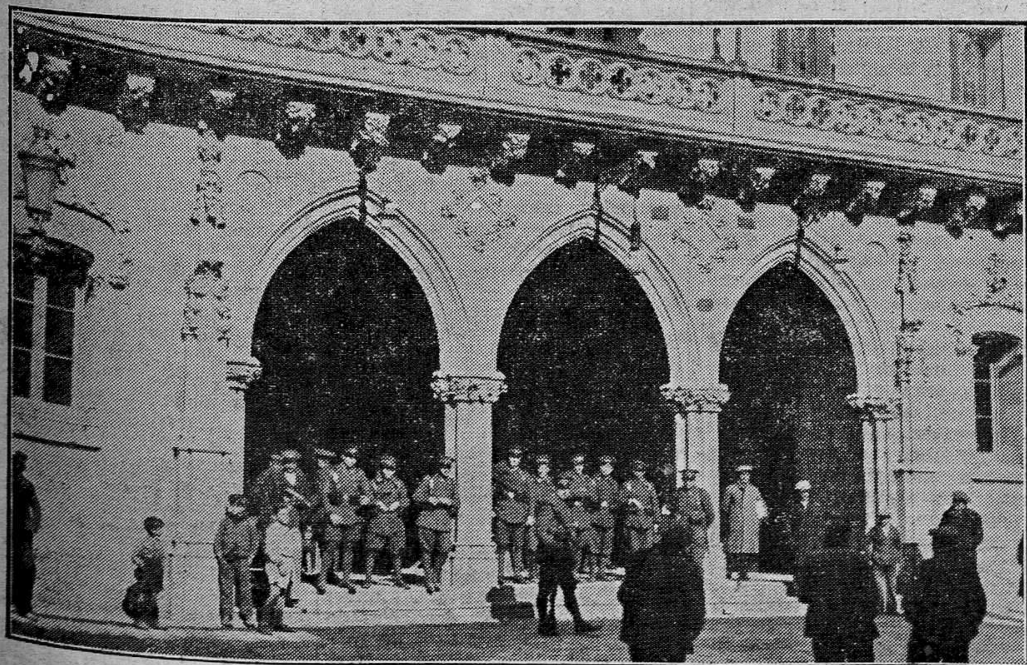
Tropas custodiando el Ayuntamiento de Tarrasa, después de la revuelta

En contestación se han recibido expresivos telegramas, concebidos en parecidos términos, manifestando que el Gobierno español realiza activas gestiones cerca del Gobierno inglés, con energía e interés, en defensa de la exportación española.