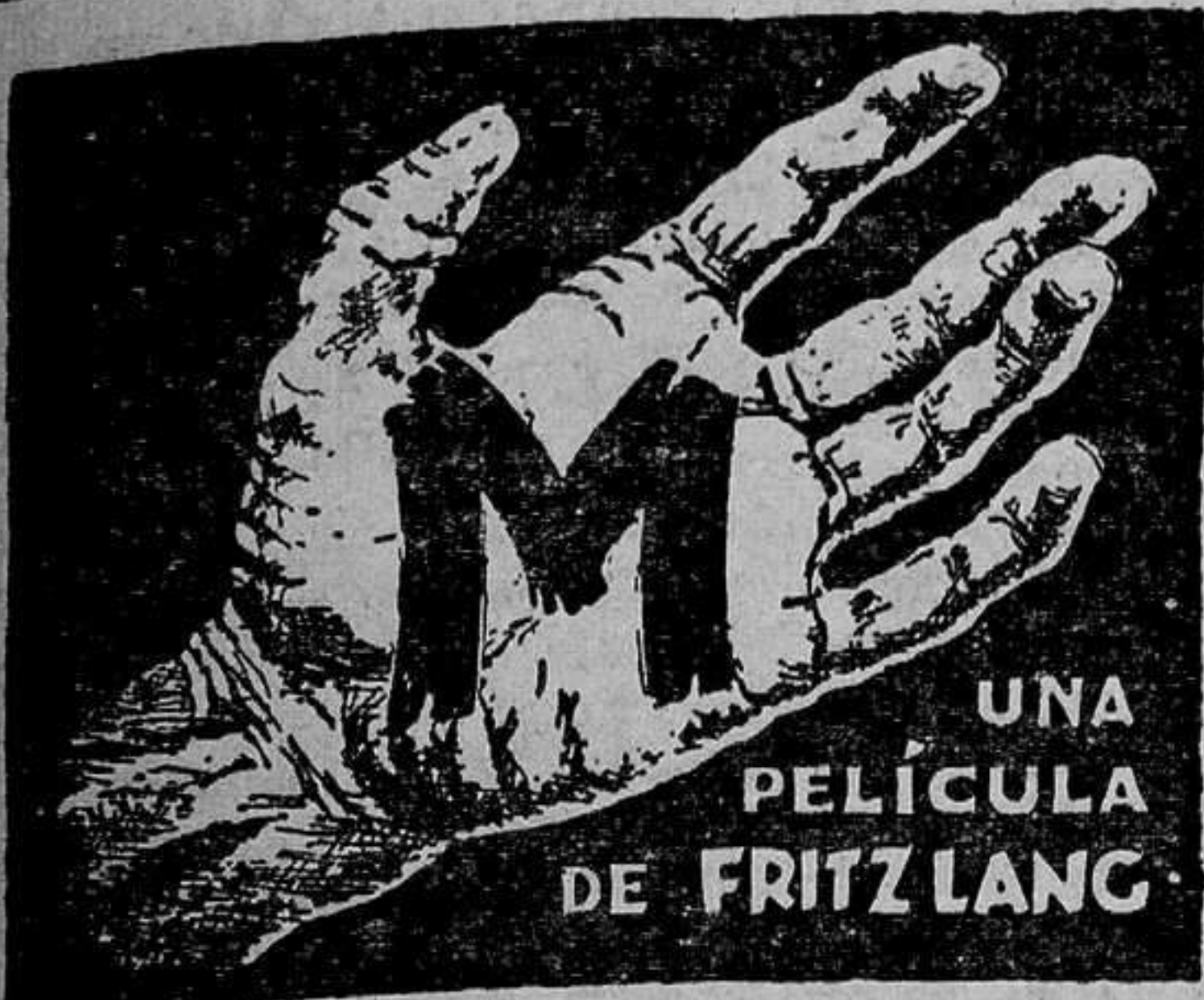
UNA PELÍCULA DE FRITZ LANG

El director Fritz Lang ha reconstruido en esta película la vida del delincuente de un perturbado