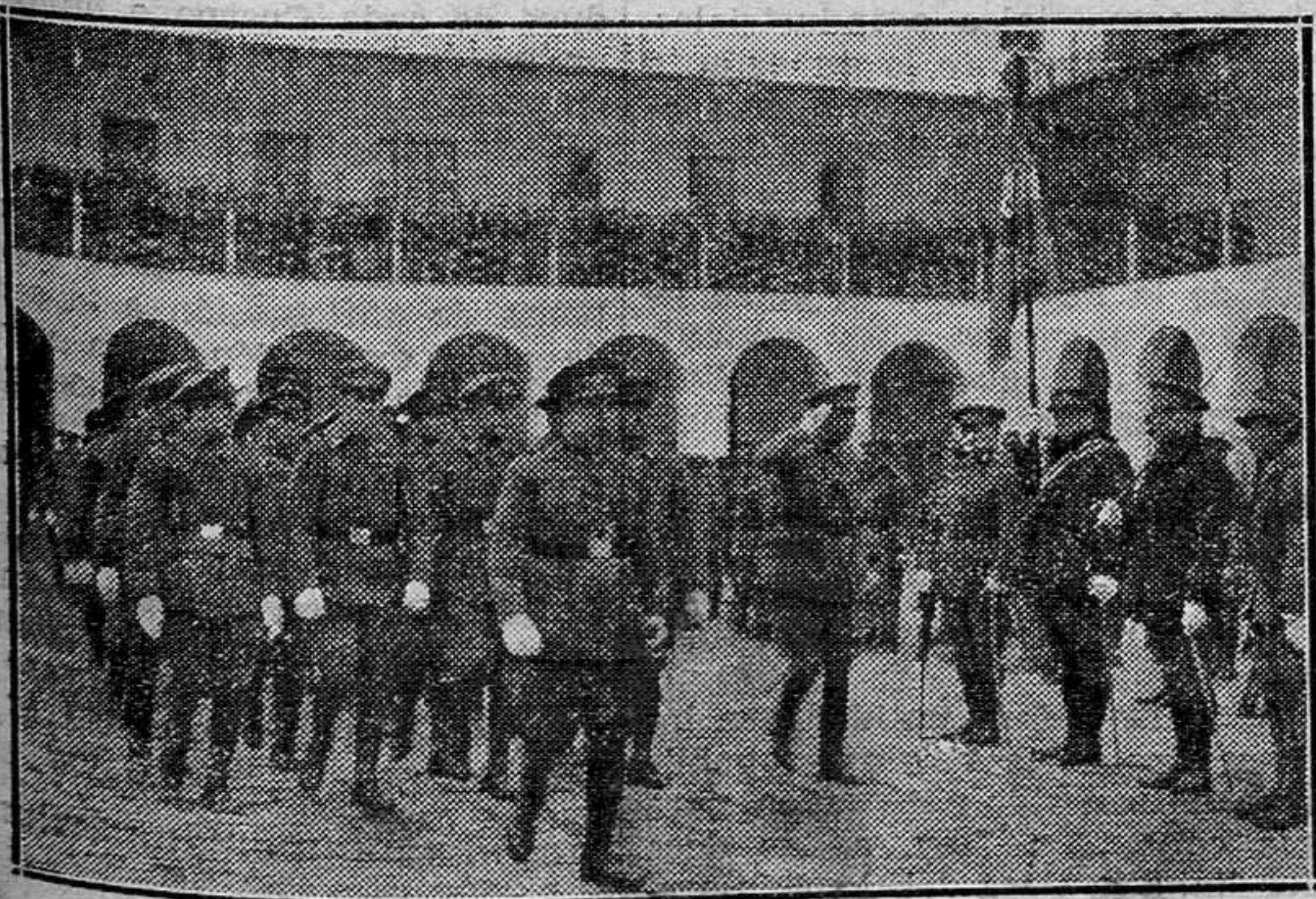
El acto de la promesa de los nuevos reclutas en el patio del cuartel del regimiento de Infantería número 13, de guarnición en Valencia