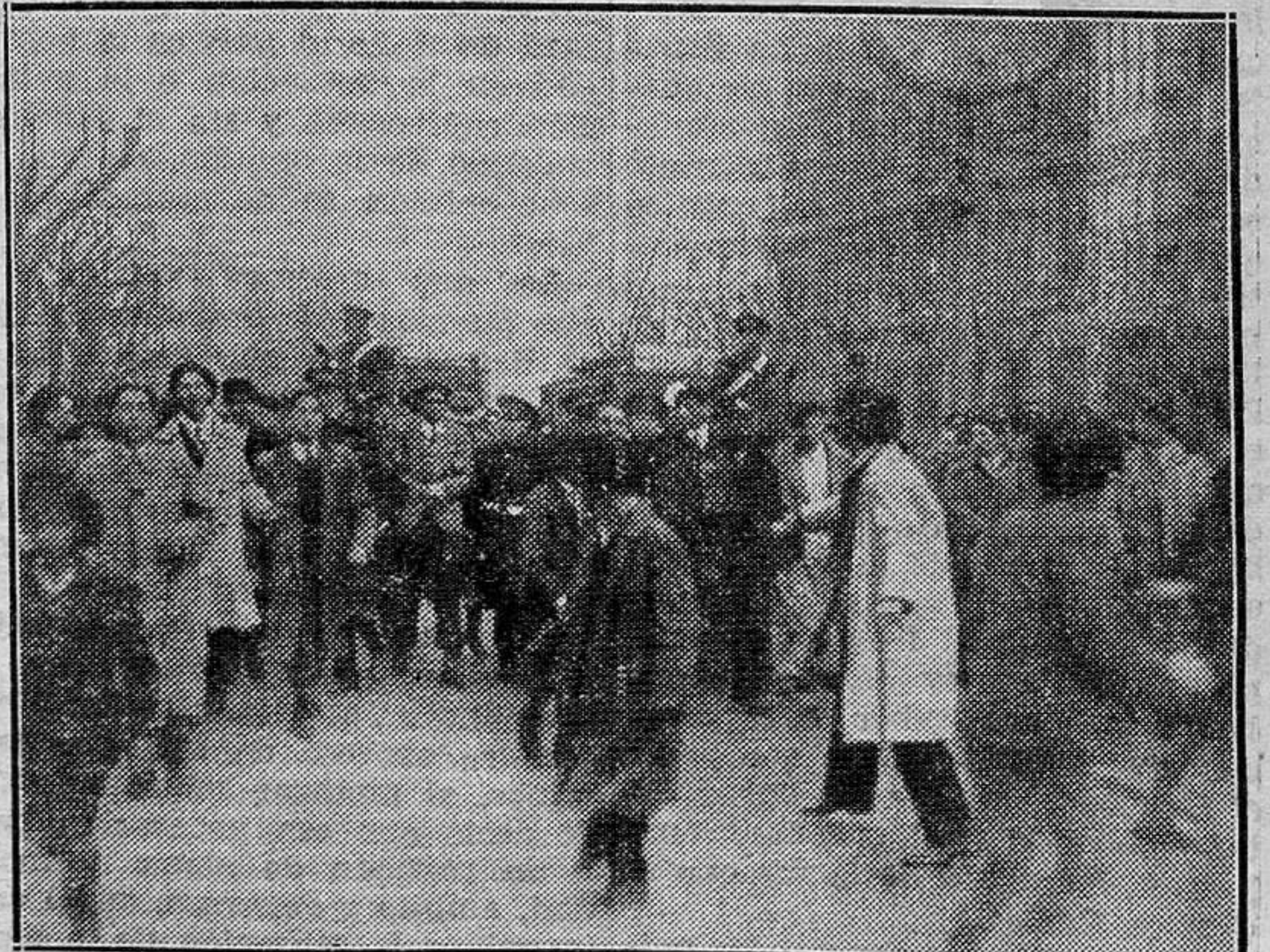
Los detenidos en los sucesos de Bilbao, siendo conducidos por la Policía