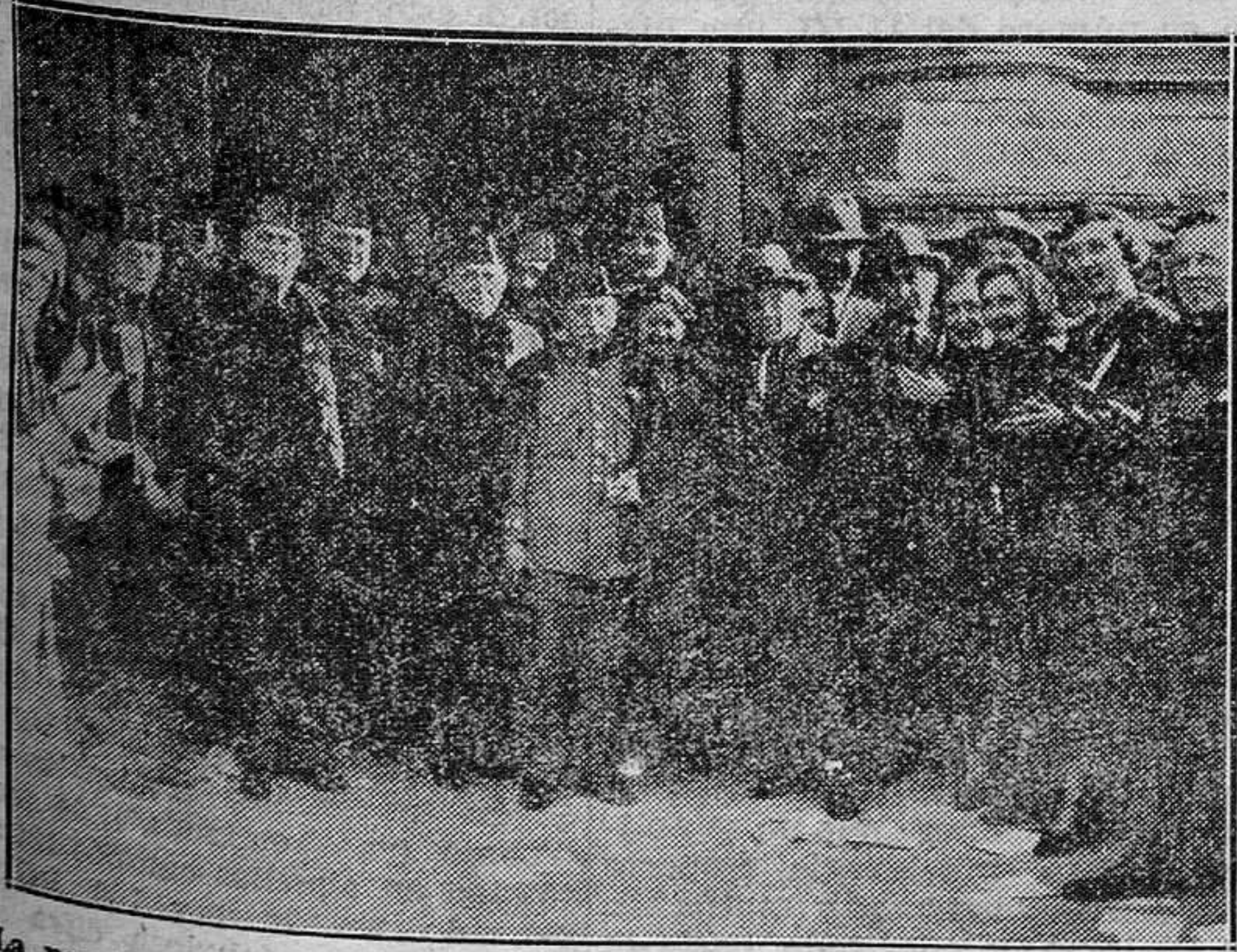
La presidencia del duelo saliendo de la iglesia de Santo Domingo, de Valencia, entre los aplausos de la multitud