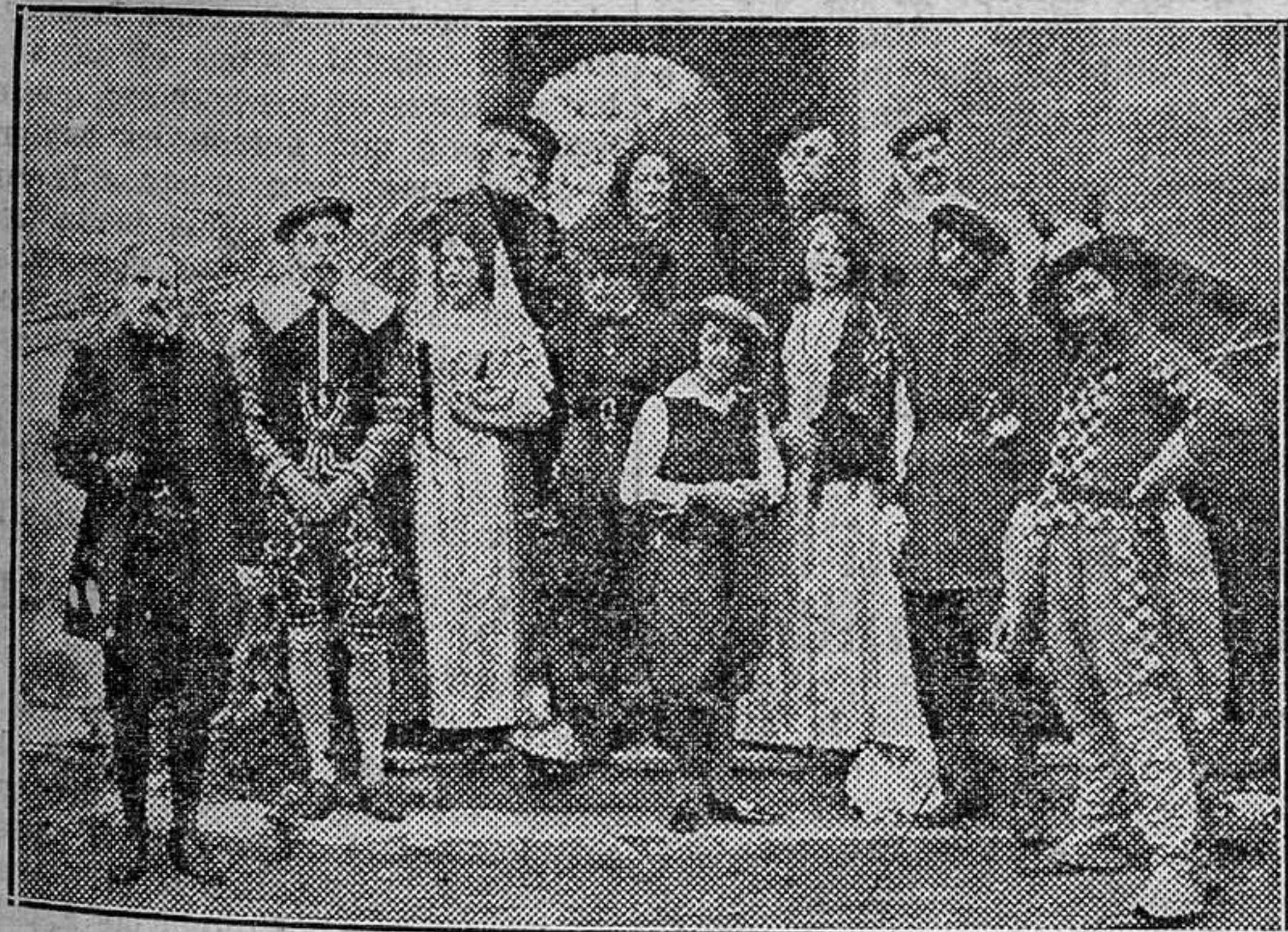
Grupo de aristócratas que tomaron parte en el festival a beneficio de los niños pobres, representando el entremés de Cervantes, "El juez de los divorcios", teniendo por escenario el Alcázar