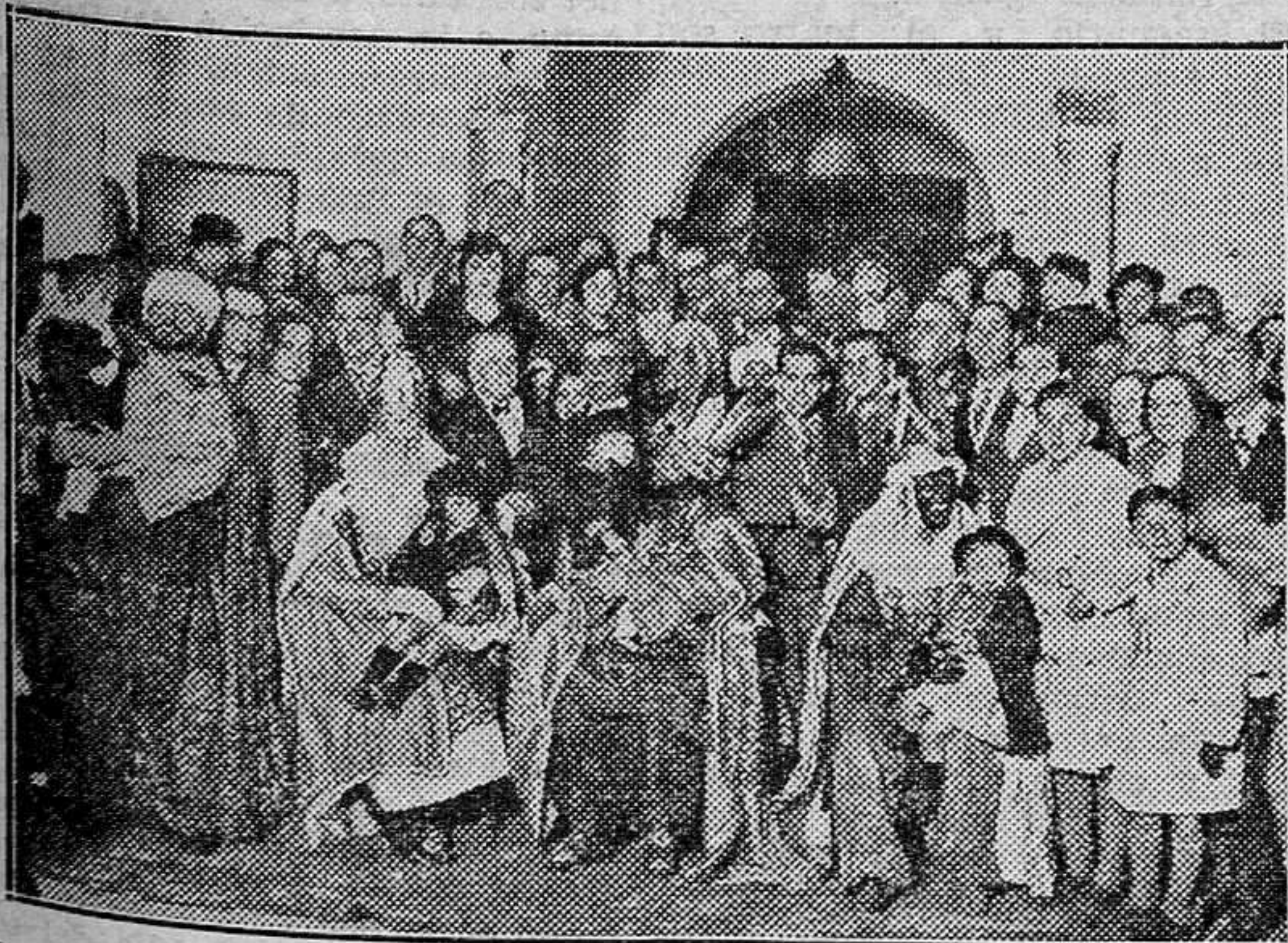
Los Reyes Magos en su visita al Hospital provincial, acompañados de las autoridades