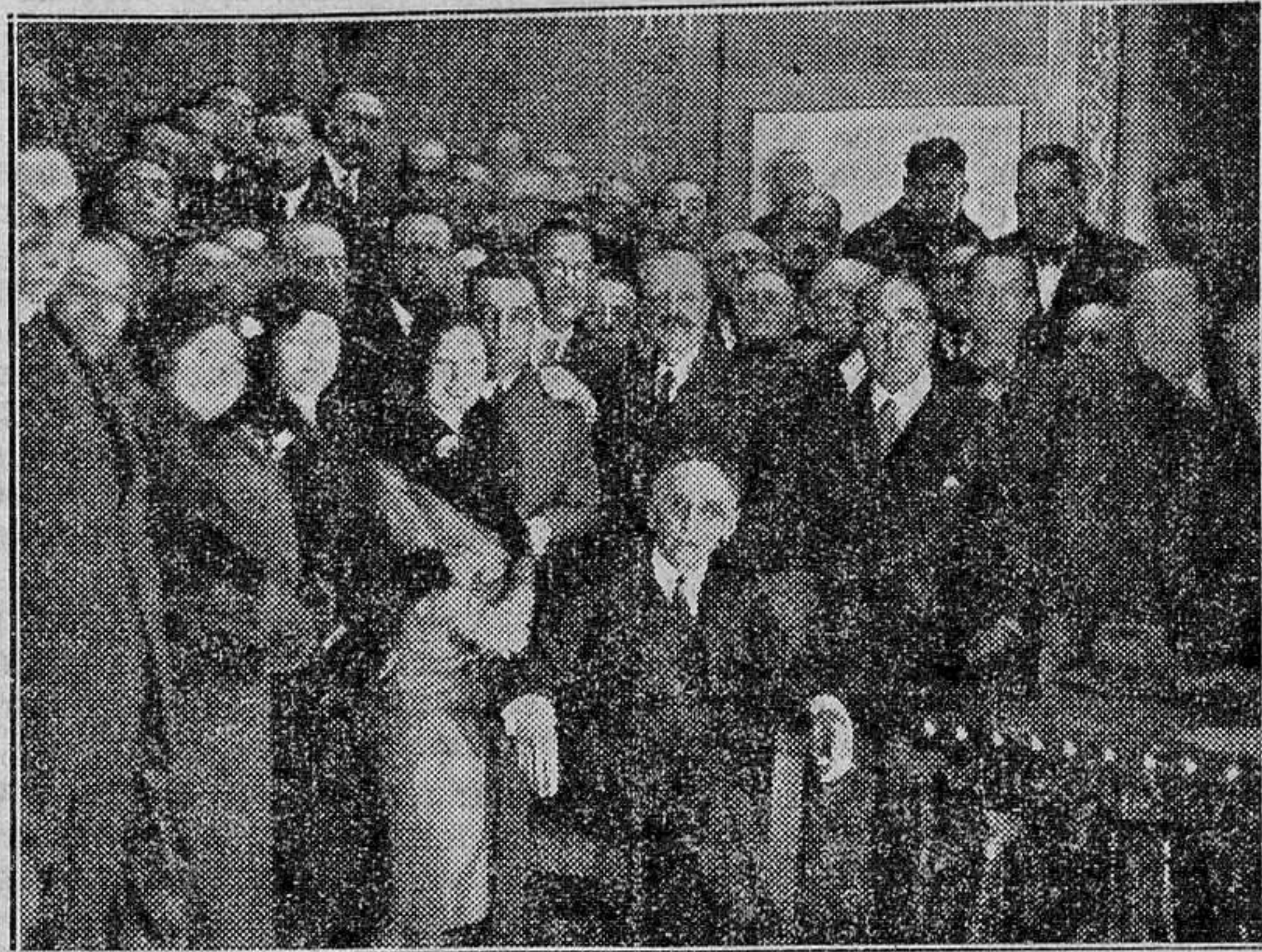
Don Melquiades Alvarez después de su reciente discurso en el teatro de la Comedia de Madrid

Frente a tales demasías, la Iglesia no cesará de reivindicar en un país católico como el nuestro, el reconocimiento oficial de su competencia, el acuerdo de la legisla-