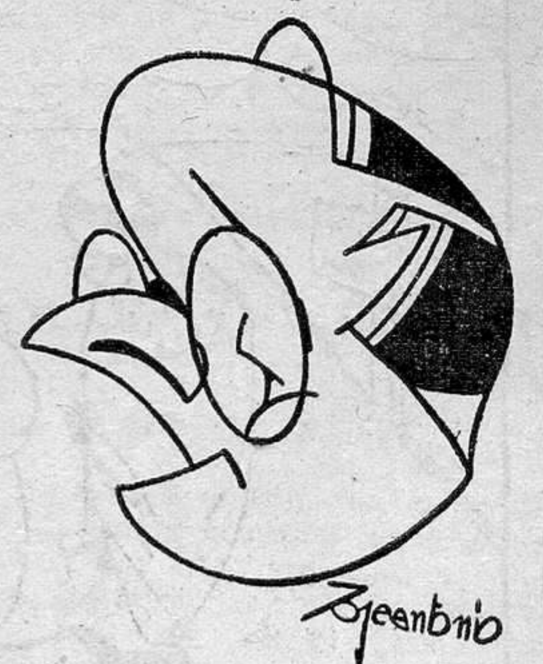
El ministro de Marina, señor Giral