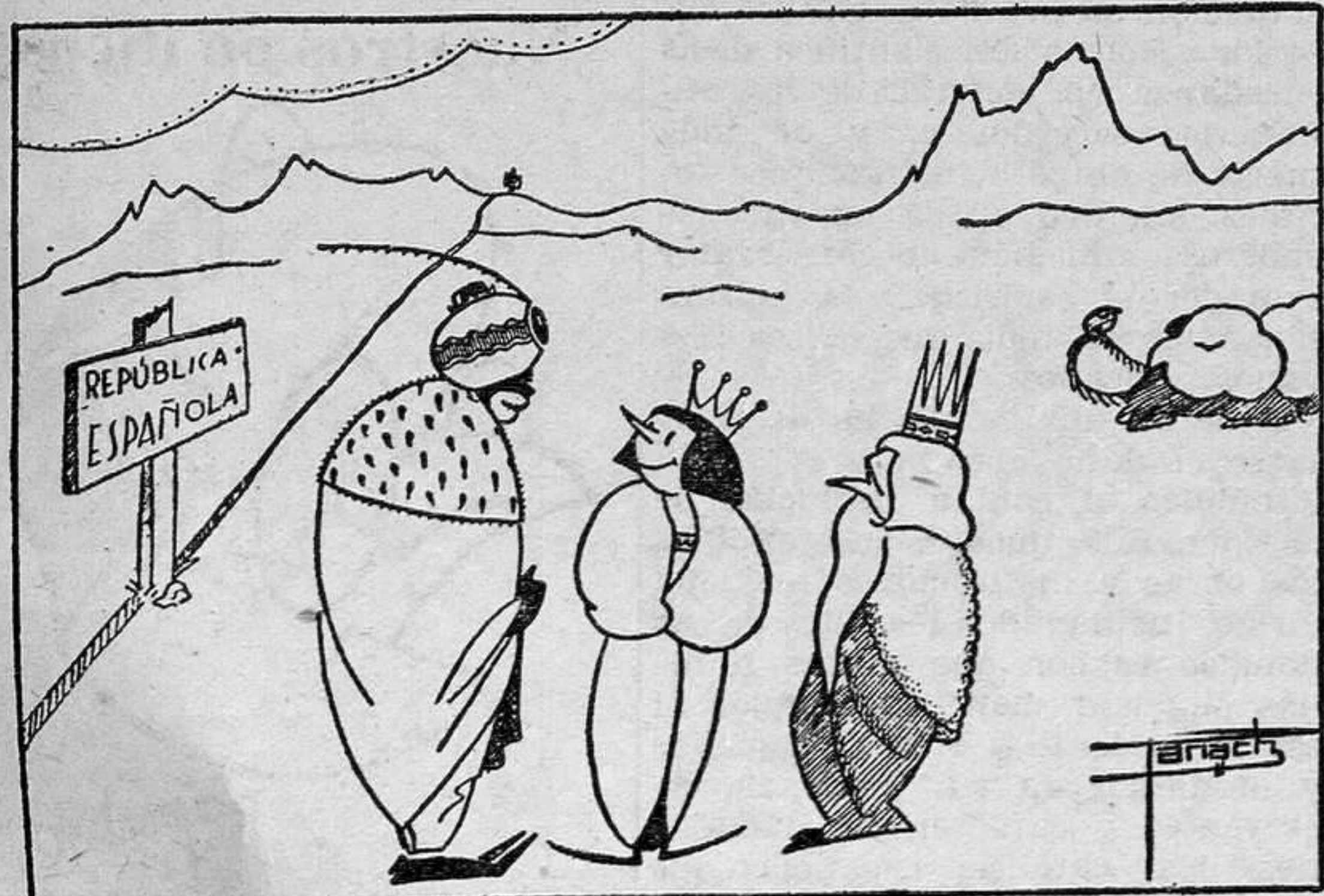
—¿Qué hacemos?...¿Entramos? ¡Y las coronas! ¡¡Si al menos fuesen murales!!