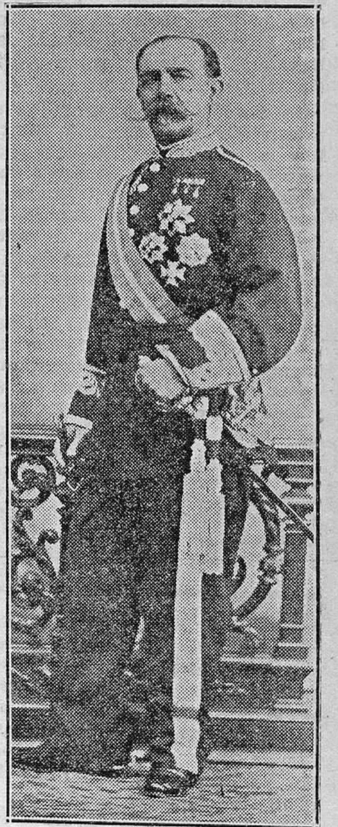
El general Villacampa, jefe del último alzamiento republicano, en el reinado de Alfonso XII, y en el que se hallaba complicado el actual jefe del Gobierno, quien desea rendir un homenaje a dicho general y a cuantos por la causa republicana expusieron su vida

Un aliciente más hallarán nuestros lectores en estos cuentos, y es su ilustración, de la cual se ha encargado un artista joven y menos conocido, con ser ya mucho, de lo que merece, debido a su gran