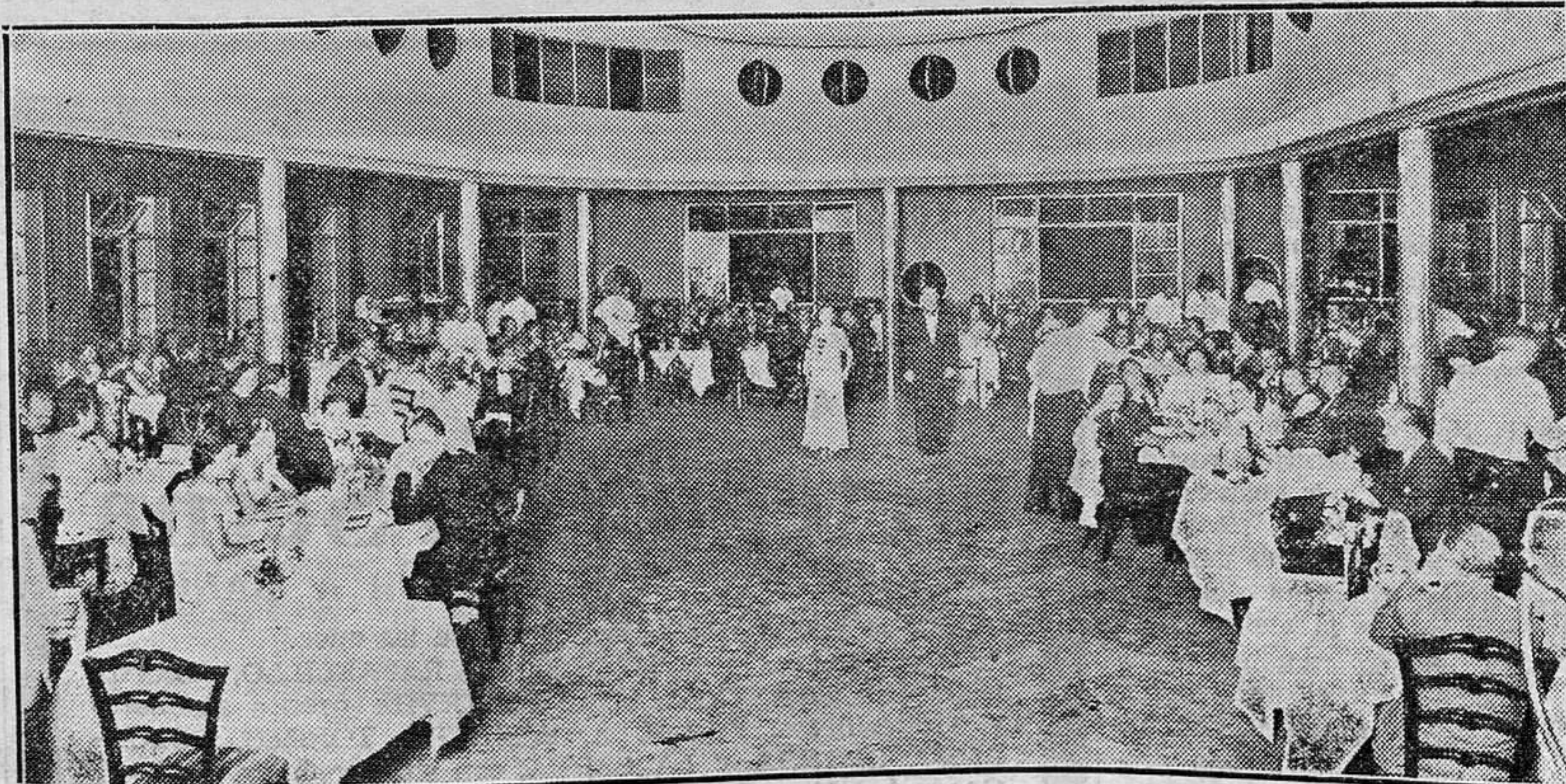
La cena americana del pasado viernes en el comedor del Club Náutico.