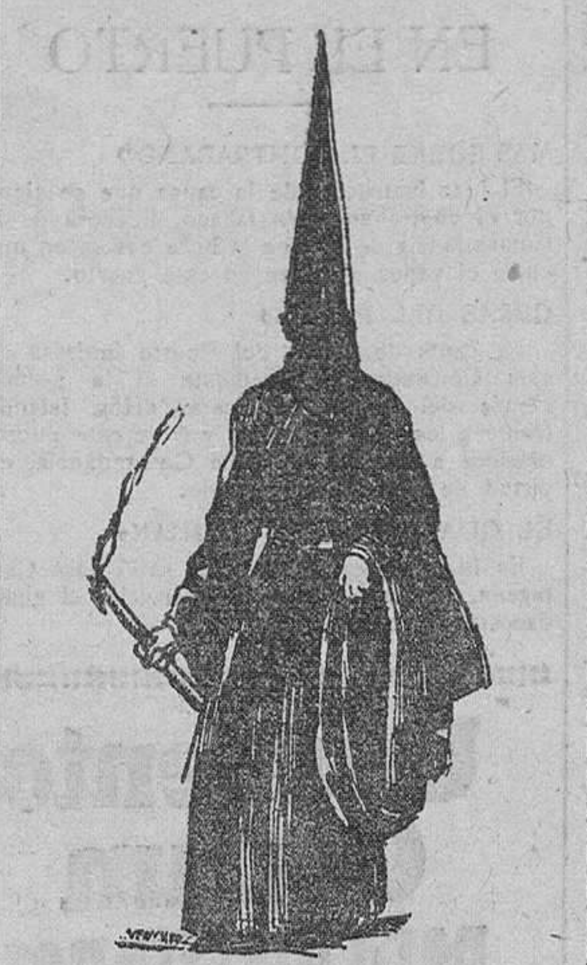
Hermandad del Cristo de San Salvador