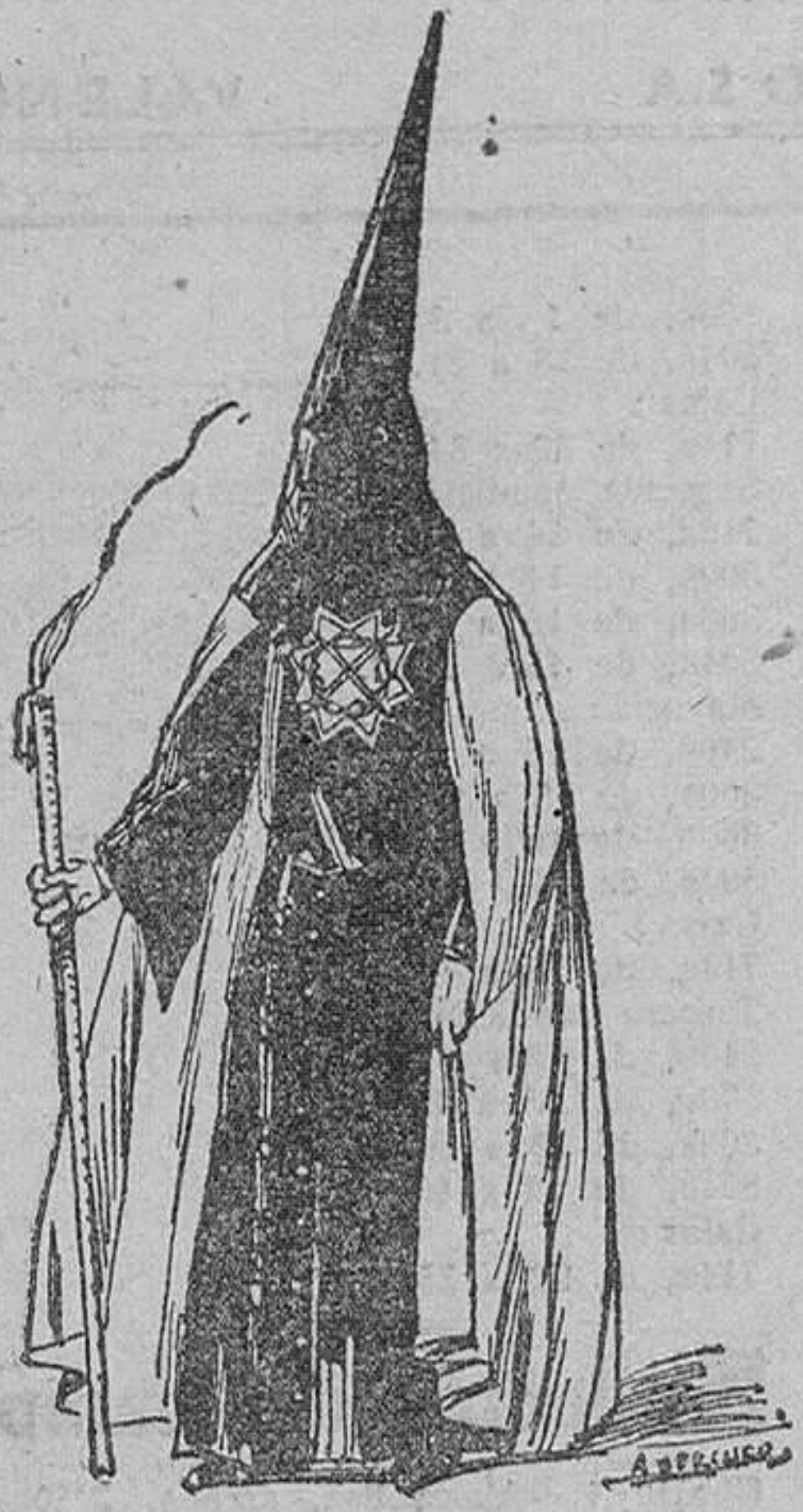
Hermandad del Ecce-Homo

Han comenzado las solemnísimas fiestas de Semana Santa, que las parroquias de Santa María del Grao, Nuestra Señora del Rosario del Cabañal y Nuestra Señora de los Angeles del Cabañal, conjuntamente, celebran este año. No sólo en Valencia, sino en toda la región, son ya famosas estas solemnidades de los poblados marítimos, que se desenvuelven durante la presente Semana Mayor. Desde hace muchos años, se celebra con tanto entusiasmo como severidad y era tradicional en el pueblo valenciano acudir durante la citada semana a contemplar aquellas procesiones, desfiles de sayones, Hermandades, etc., siempre concurridos, magníficos siempre en las que tomaba parte con ejemplar devoción el vecindario.