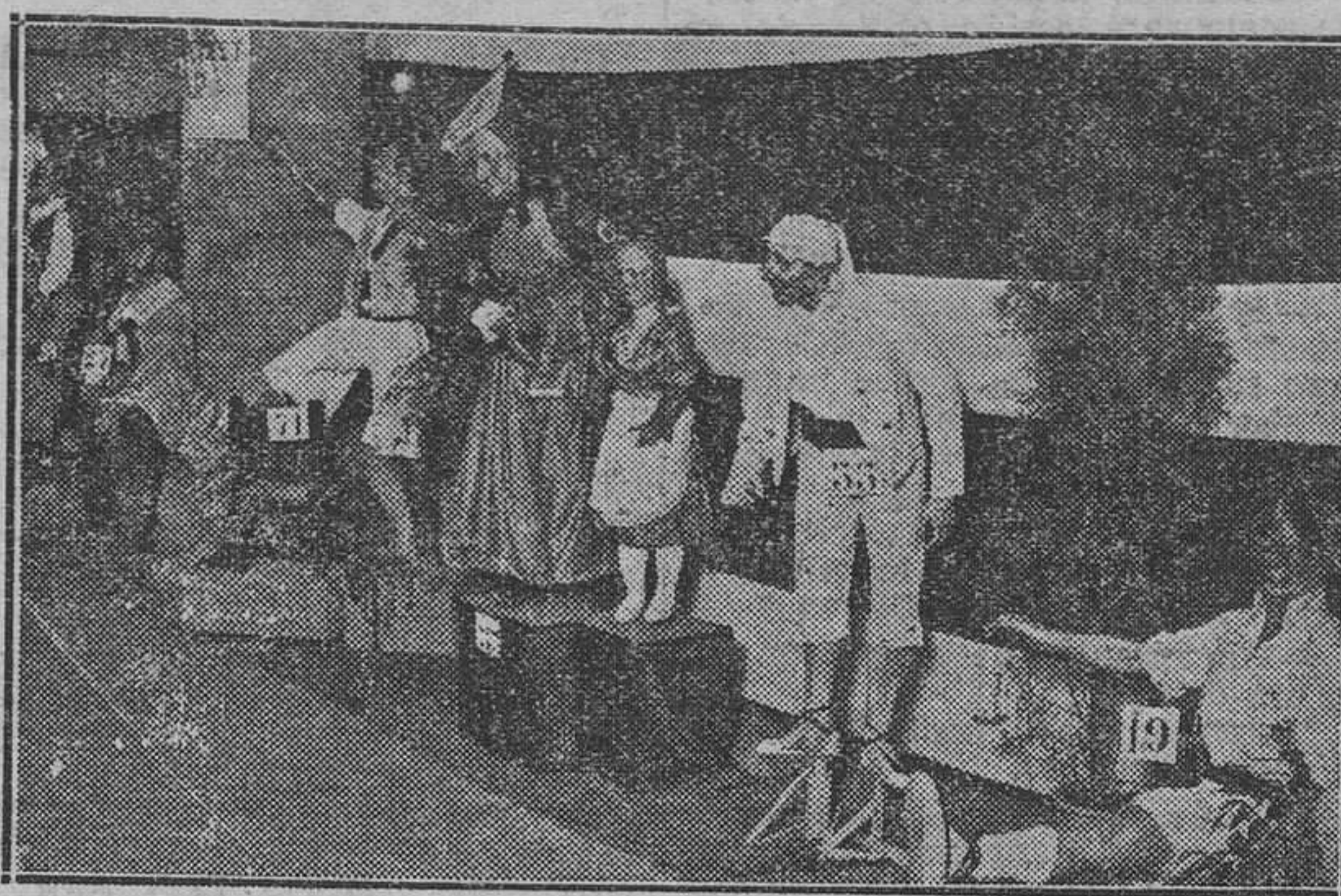
La Exposición del "Ninot" que se celebra en los sótanos del Mercado Central