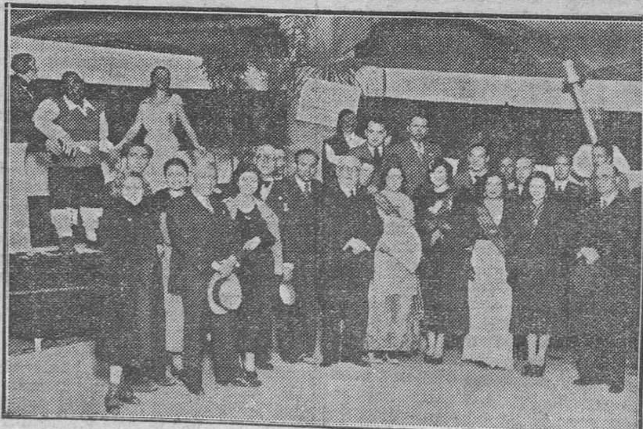
Las autoridades valencianas y las Misses Falleras en el acto inaugural de la Exposición del "Ninot".