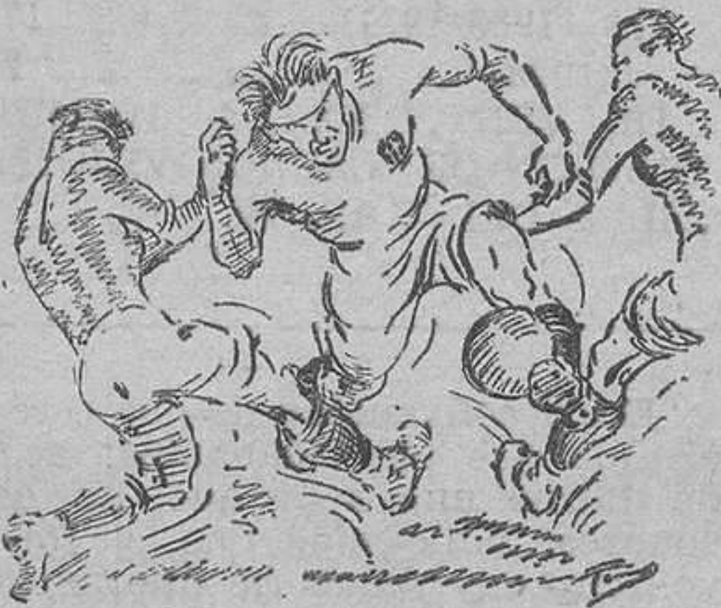
¡Que viene Torregaray!

Rueda la bola. El Valencia, durante los primeros instantes, juega solo. Los medios, especialmente Iturraspe, llevan ropa de fiesta. Y vemos a los nuestros cómo se pasean ante Beristain, esperando que se distraiga para meterle las patatas en el puchero. Juega bien el Valencia. Y domina. El primer corner es contra el Donostia. No pasa nada. Como sucede siempre en los corners. No vemos a los del Donostia por ningún lado.