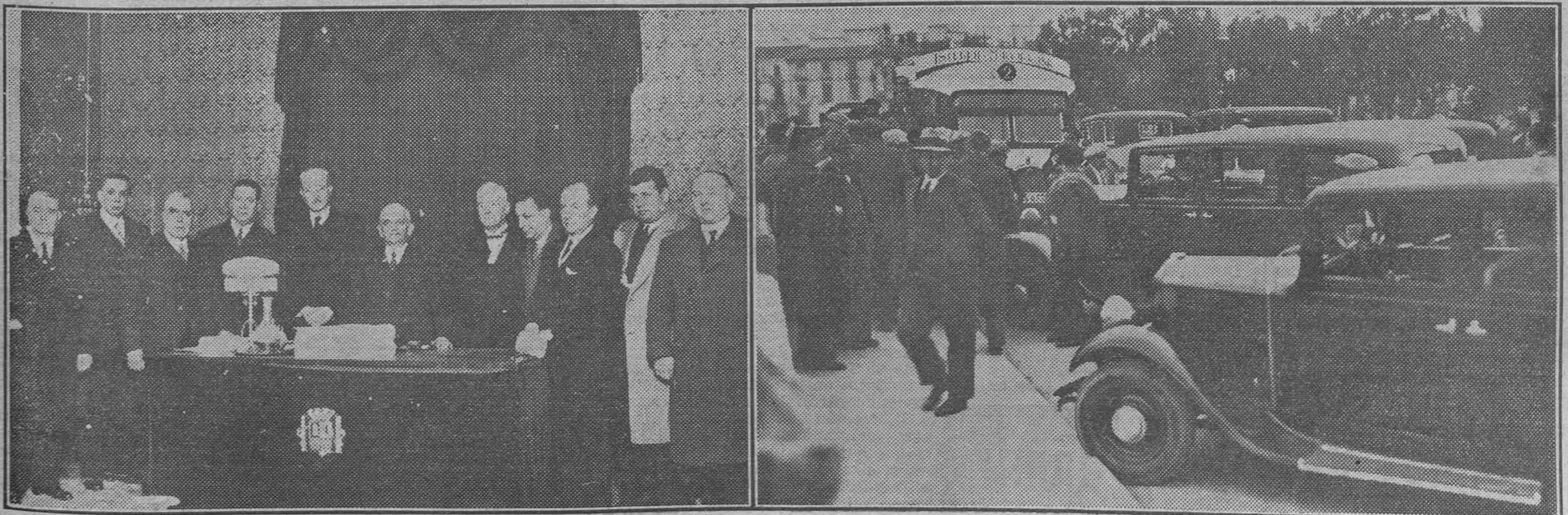
Solemne sesión de apertura de curso de la Academia de Medicina, celebrada el domingo.—Los taxis impidieron el domingo el servicio de autobuses a los campos de fútbol, y formaron una barrera en el puente del Real.

Comunican de Berlín que el velero Mopelia, con 25 hombres de tripulación y cuatro pasajeros, al mando del capitán Lauterbach, ha establecido una nueva marca para la travesía desde Nuev York a Bremen, en 26 días, con mar muy movido.